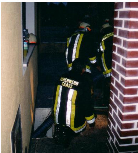
Kameraden beim Auspumpen des überfluteten Kellers.