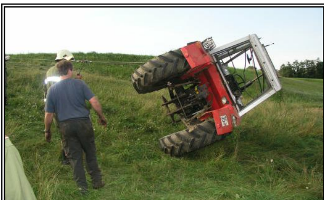
Traktor als er gerade mittels Seilwinde aufgezogen wird. Der Einsatz konnte ohne Probleme abgewickelt werden.