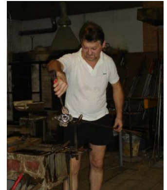
Neu Nagelberg: Vorführung in der Glasbläserei bei der Fa. Zalto.