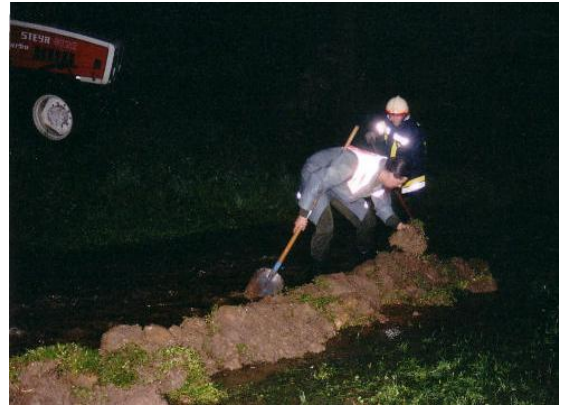
Kameraden beim Errichten eines kl. Damms um die Wassermassen umzuleiten.