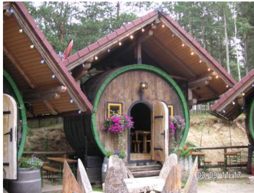
Fassldorf in Großpertholz: Ein Faß von vielen Fässern, welche sehr nett hergerichtet sind.