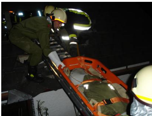
Bergung der vermissten Person über das Dach und einer Leiter mittels Personentrage.