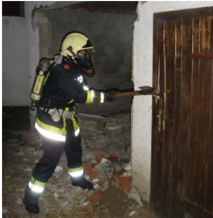
Atemschutzmann beim Aufbrechen einer Tür, wo sich vermutlich dahinter ein Brandherd befindet.

Dass die Garstner Feuerwehren für den Einsatz bestens gerüstet sind und dabei gut zusammenarbeiten, wurde bei dieser Großübung unter Beweis gestellt, da alle Aufgaben und Tätigkeiten sehr gut erledigt wurden. Es nahmen insgesamt 43 Kameraden von den 4 Feuerwehren teil.