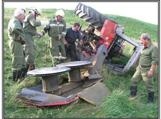
Traktor mit dem Kreiselmähwerk: Es wird dieses abgehängt um den Traktor bergen zu können.