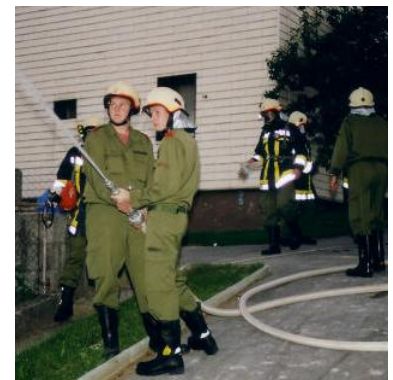
Kameraden welche das Nachbargebäude mit einem C-Angriffrohr schützen.