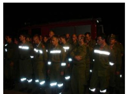
Schlussbesprechung über die durchgeführte Großübung mit allen Kameraden der 4 teilnehmenden Feuerwehren.