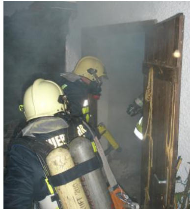
Atemschutztrupp beim Vordringen zum Brandherd im Nebengebäude.