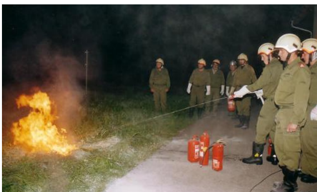
Löschen eines Flüssigkeitsbrandes mittels Wasser aus einer Kübelspritze (keine Löschwirkung)