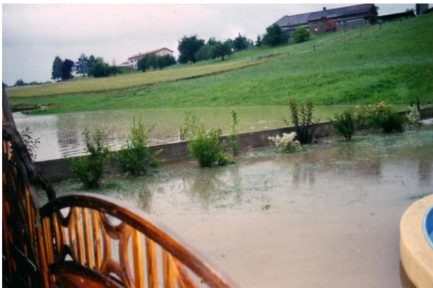
Große Wassermengen die sich hinter der Gartenmauer aufgestaut hatten, und anschließend den Garten und den Keller überschwemmten.