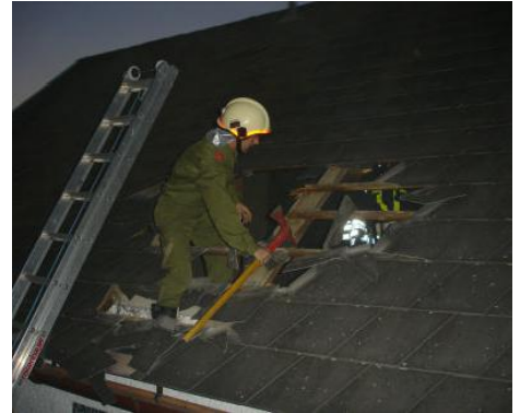
Kamerad beim Aufbrechen des Daches, um die Bergung der vermissten Person zu ermöglichen.