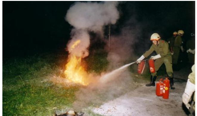
Löschen eines Flüssigkeitsbrandes mittels eines Pulverlöschers (sehr gute Löschwirkung)