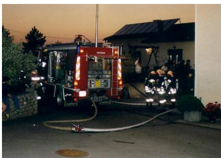
Löschwasserversorgung vom Tankwagen Sand für die Angriffstrupp zum Löschen der Brandherde.