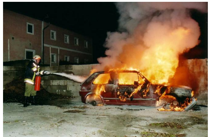
Der erste Löschversuch mit einem Pulverlöscher, der bei einem Vollbrand nur eine geringe Löschwirkung hat.