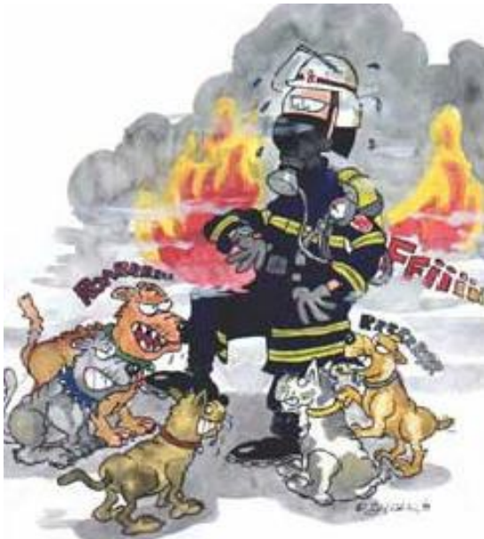
DER EINSATZ IM TIERHEIM STELTE HELMUT VOR UNGEÄHRTE PROBLEME