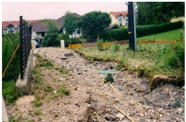
Ebenfalls am Tag danach: Hier war die Hauszufahrt zum Einfamilienhaus.