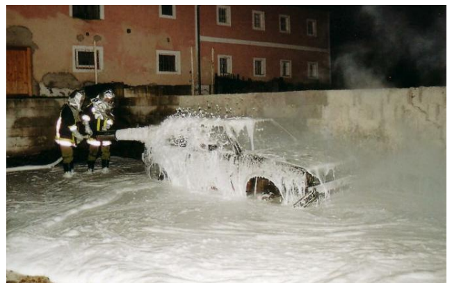
Der PKW ist hier bereits fast vollständig gelöscht und vollkommen mit Löschschaum zugedeckt. Es wurde auf Grund der Hitzestrahlung auch der Hitzeschutz verwendet.