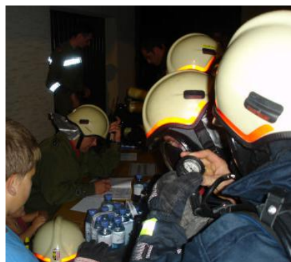
Atemschutzsammelstelle: Hier werden alle Aufzeichnungen über die eingesetzten Atemschutztrupps durchgeführt.