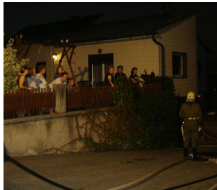
Zahlreiche interessierte Zuseher waren während der Übung anwesend.