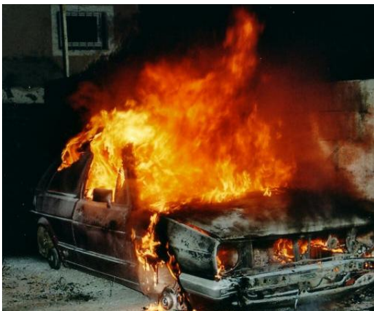
Der PKW befindet sich im Vollbrand, wobei gut ersichtlich ist, wie gut auch der Autolack brennt.