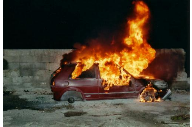
Hier hat sich das Feuer innerhalb kurzer Zeit auf das ganze Fahrzeug ausgebreitet