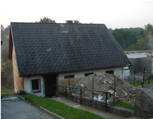
Das Objekt für die Großübung

Aufgrund dieser Aufgaben ergaben sich somit viele Tätigkeiten. Es wurden alle Wehren, je nachdem sie am Übungsobjekt eintrafen, zu den verschiedenen Aufgaben eingeteilt: Einsatzleitstelle aufbauen und Einsatzleitung übernehmen, Lotsen abstellen (Straßenverkehr umleiten, ankommende Feuerwehren einweisen), Aufbau einer Löschwasserleitung zur Brandbekämpfung und Tankwagenversorgung, Atemschutzsammelstelle einrichten, 4 Atemschutztrupps zu je 3 Mann bereitstellen (Personensuche im stark verrauchten Gebäude und bergen, 3 Brandherde lokalisieren und löschen), Aufbauen einer Löschwasserrelaisleitung für zusätzliche Wasserversorgung von Erlenbrunn.