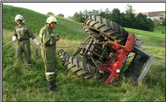
Kameraden beim Anbringen des Bergeseiles am Traktor, um diesen dann aufziehen zu können.