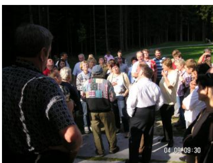
Führer bei den Erklärungen zur Himmelsleiter und zum Moor.

Am nächsten Tag wurde vormittags der Naturpark Hochmoor in Schrems und der Himmelsleiter mit einer Führung besucht (Dies war sehr interessant und besonders sehenswert, da das Wetter sehr schön war). Danach fuhren wir weiter über Zwettl nach Voitschlag (Mittagessen). Nachmittags ging die Fahrt weiter nach Armschlag (Führung im Mohnhof, sehr aufschlussreich über die Mohnproduktion und Verwertung) anschließend ging es Richtung nach Hause, wo wir zum Abschluss bei einem Mostheurigen in Perg einkehrten. Es waren dies wiederum wie jedes Jahr 2 sehr schöne Ausflugstage, wo auch die Kameradschaftspflege nicht zu kurz kam.