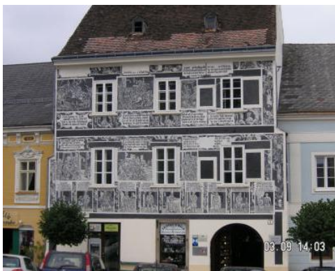
Sehenswertes Bürgerhaus mit Sgraffitomalerien in Weitra.