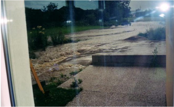
Ansicht vom Hauseingang aus, wo die Hauszufahrt komplett weggespült wird.

Am 10.07.2005 musste unsere Feuerwehr nach dem verheerenden Hochwasser im Jahr 2002 wieder zu einem Hochwassereinsatz ausrücken. Es wurde an mehreren Einsatzstellen gearbeitet. Am schwersten betroffen war ein Einfamilienhaus im Hofergraben, wo uns auch die FF Saaß unterstützte. Hier waren viele Kameraden eine große Anzahl von Stunden im Einsatz, unter anderem musste ein Teil von der Gartenmauer weggestemmt werden, um das Wasser abfließen lassen zu können (siehe Fotos). Der Keller musste auch ausgepumpt werden.