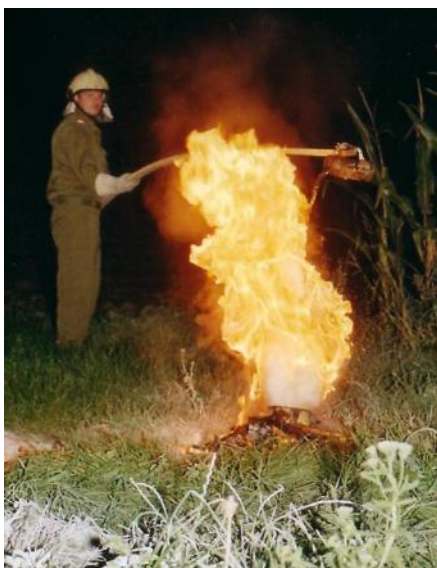
Demo: Fettbrand in einem Topf, wobei hier versucht wird den Brand mit Wasser zu löschen (katastrophaler Fehler).