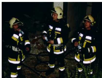
Atemschutztrupp, der sich nach dem anstrengenden Innenangriff mit Mineralwasser erfrischt.