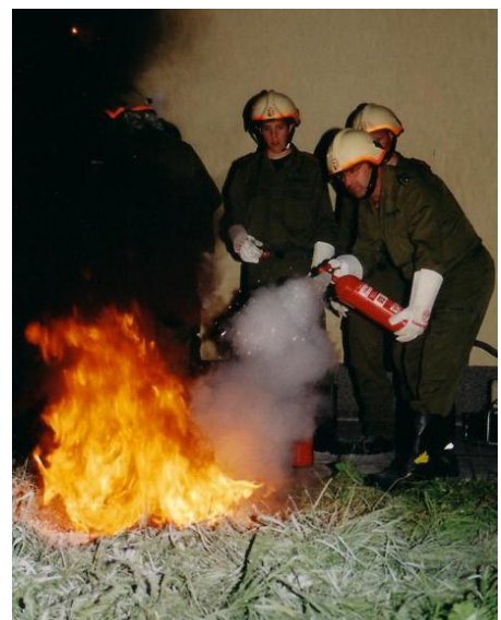
Löschen eines Flüssigkeitsbrandes mittels eines CO2 Löschers (schlechte Löschwirkung, Rückzündung)