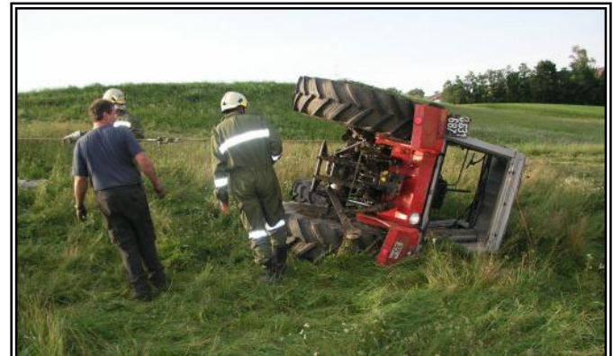
Vorsichtiges Straffen des Bergeseiles, um mit dem Aufstellen des Traktors zu beginnen.