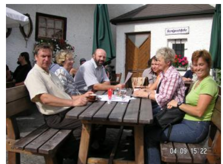
Gemütliche Einkehr bei Mohnwirt in Armschlag.