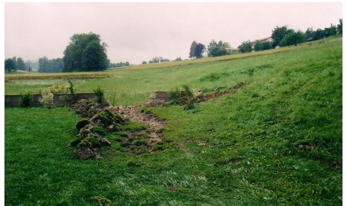
Am Tag danach: Hier ist ersichtlich wo die Gartenmauer weggestemmt wurde, damit die Wassermassen abfließen konnten.