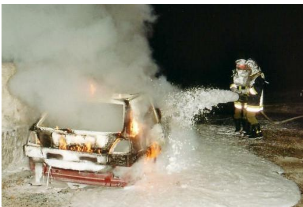
Das Fahrzeug mit Schaum zu löschen, ist wie hier zu sehen ist, der beste und schnellste Weg um Erfolg beim Löschen eines Fahrzeugbrandes zu haben.