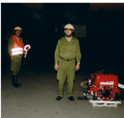
Wasserentnahme mit unserer Pumpe von einem Hydranten zum Speisen des Tankwagens.