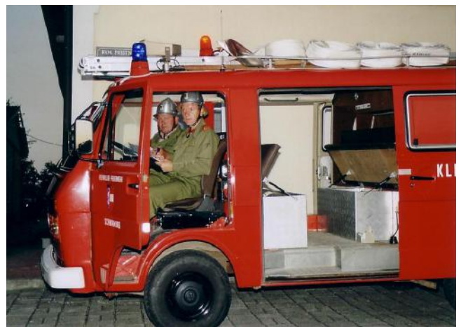
Einsatzleitstelle: Unsere Feuerwehr leitete die Großübung. Hier liefen alle Fragen und Informationen zusammen und es wurden die Befehle für einen erfolgreichen Übungsverlauf ausgegeben.