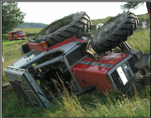
Ausgangslage als unsere Feuerwehr beim umgestürzten Traktor eintraf.

Am 11.08.2005 wurde unsere Feuerwehr zu einem Einsatz gerufen, den es bis dato in unserer Wehr noch nicht gegeben hat: Ein Traktor war bei Mäharbeiten mit einem Kreiselmähwerk in steilem Gelände umgestürzt. Dieser hatte sich mehrere Male überschlagen. Sehr viel Glück hatte der Lenker dieses Traktors, der sich selber befreien konnte und die Feuerwehr alarmierte, obwohl anzunehmen war, dass er sich im Schockzustand befand. Anschließend ließ er sich vorsichtshalber in das LKH Steyr einliefern, um sich auf eventuelle innere Verletzungen untersuchen zu lassen, wo sich herausstellte dass er nur leichte Prellungen und Schürfwunden abbekommen hatte. Um den Traktor wieder aufzustellen und bergen zu können, alarmierten wir die FF Neuzeug-Sierninghofen mit ihrem Rüst- und Bergefahrzeug, da unsere Feuerwehr für solche Bergetätigkeiten nicht ausgerüstet ist. Der Einsatz konnte in Zusammenarbeit mit der FF Neuzeug-Sierninghofen erfolgreich bewältigt werden.