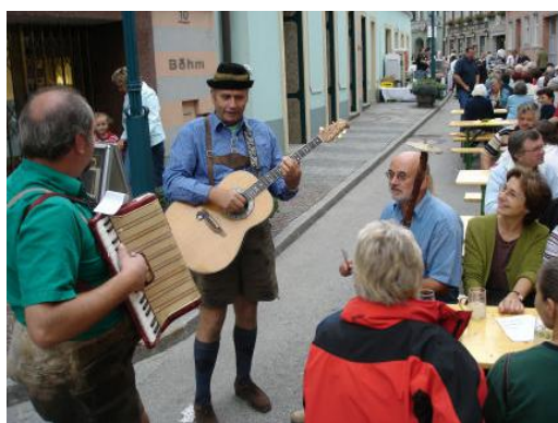
Zwetschkenfest in Schrems, welches wir auch besuchten.