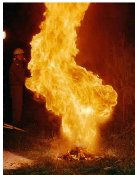
Folgewirkung: Es entsteht eine gewaltige explosionsartige Stichflamme mit verheerender Auswirkung (z.B.: Fettbrand in der Küche).