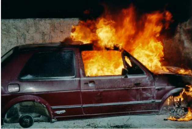
Das Feuer ist vom Motorraum aus auf den vorderen Teil des Fahrzeuginnen vorgedrungen.

Am 19.10.2005 wurde eine Einsatzübung in Schwaming durchgeführt, wo ein Verkehrsunfall angenommen wurde. Es kam hierbei zu einem Brand im Motorraum, der sich auf das gesamte Fahrzeug ausbreitete. Das Auto wurde für diesen Zweck im Motorraum angezündet, um den Kameraden zu demonstrieren wie sich ein Autobrand entwickelt und wie schwierig es ist den Brand zu löschen, wenn es auch schon im Fahrzeuginnenraum brennt. Die Löschversuche wurden in 3 Varianten durchgeführt. Der erste Versuch wurde mit einem 12 kg Feuerlöscher durchgeführt. Der zweite Versuch mit einem Schaumrohr, wo das Fahrzeug bereits im Vollbrand stand. Es wurden hierbei 20 Liter Schaummittel (ergibt ca. 40 m 3 Schaum) verbraucht. Der dritte Versuch wurde mit Wasser durchgeführt, wo das Fahrzeug endgültig gelöscht werden konnte.