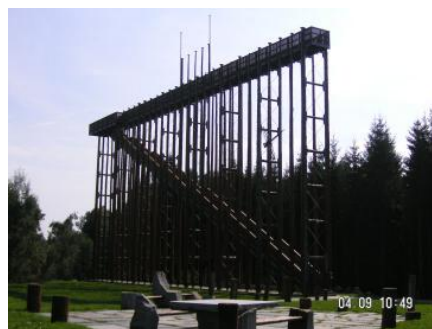
Die mächtige Himmelsleiter, welche wir bestiegen haben.