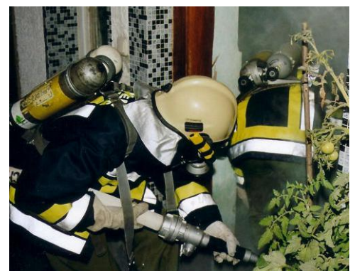
Atemschutztrupp beim Vordringen zu einem der Brandherde im Erdgeschoss.