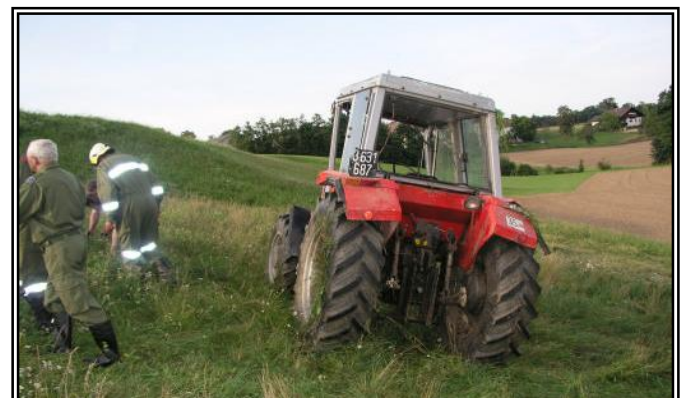
Nach dem Aufstellen des Traktors stellte sich heraus: Dieser Umsturz ist ein Totalschaden.