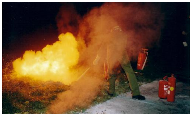
Schlechte Handhabung des Pulverlöschers beim Löschen eines Flüssigkeitsbrandes (Es erfolgte eine Rückzündung).