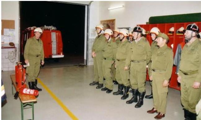
Die versammelten Kameraden beim Vortrag des theoretischen Teiles der Löscherübung

Am 26.09.2005 wurde eine praktische Feuerlöscherübung bei unserem FF Haus durchgeführt. Zuerst wurde in der Theorie über die vielen verschiedenen Feuerlöscherarten und -Typen, auf die verschiedenen Brandklassen, sowie die Handhabung der Feuerlöscher hingewiesen bzw. die Kameraden darüber aufgeklärt. Anschließend machte sich jeder Kamerad der bei dieser Übung anwesend war, von der Wirksamkeit der verschiedenen Feuerlöschertypen ein Bild beim Löschen von Bränden fester und flüssiger Stoffe. Zum Abschluss hatte jeder Kamerad die Möglichkeit mit den verschiedenen Feuerlöschern diese verschiedenen Brände selbst zu löschen und die praktische Handhabung zu üben.