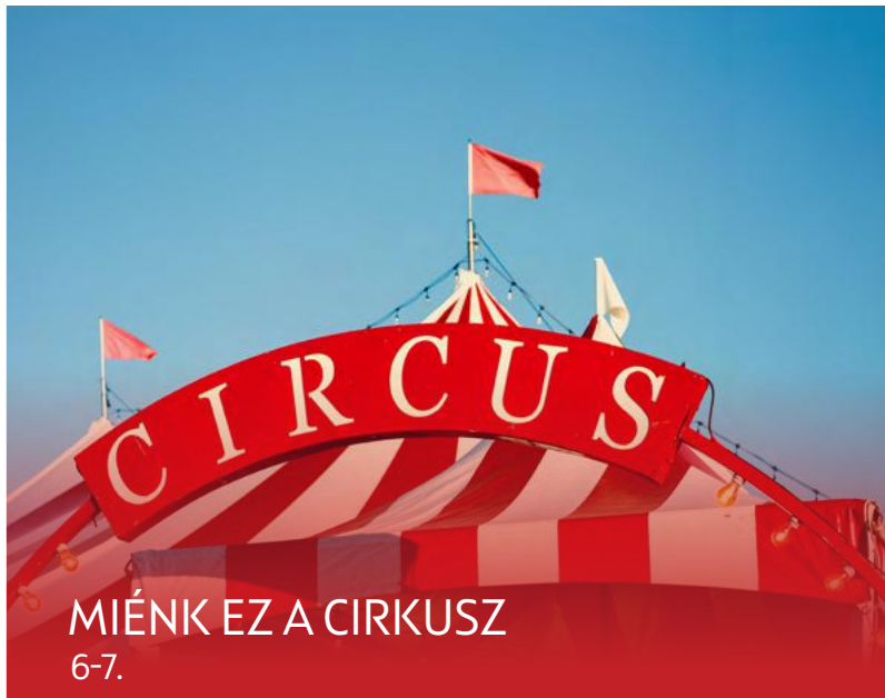
MIÉNK EZ A CIRKUSZ 6-7.