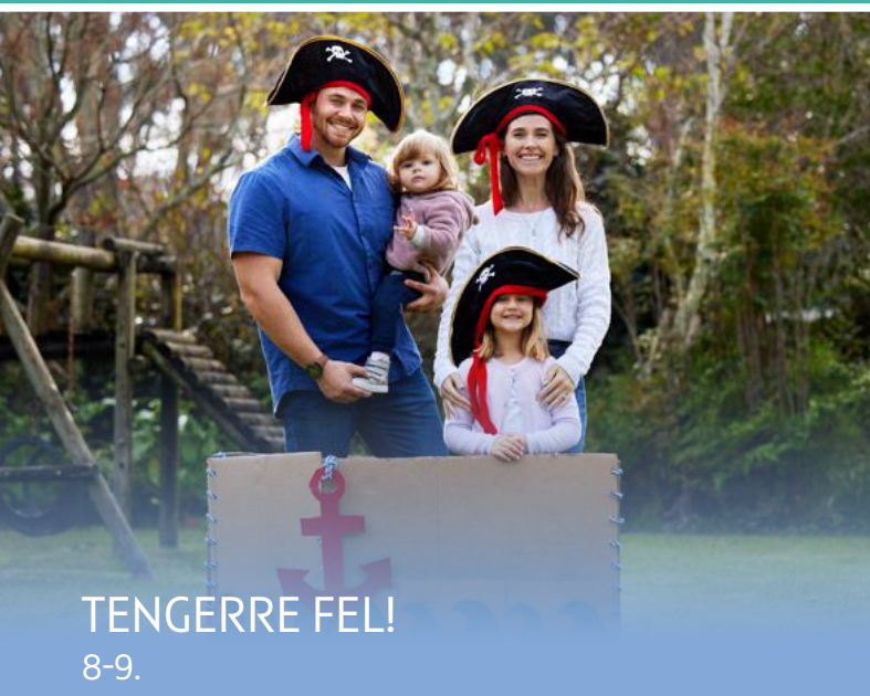
TENGERRE FEL! 8-9.