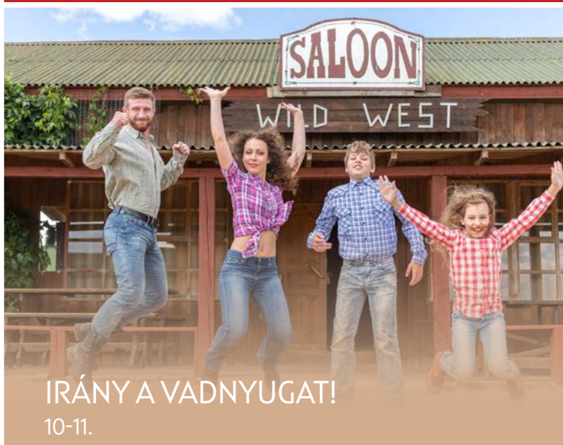
IRÁNY A VADNYUGAT! 10-11.