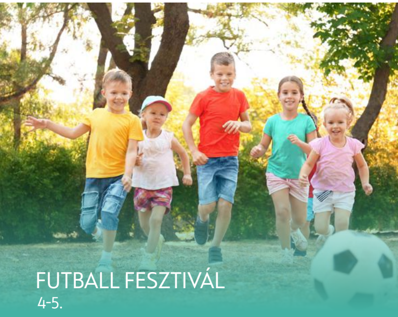
FUTBALL FESZTIVÁL 4-5.