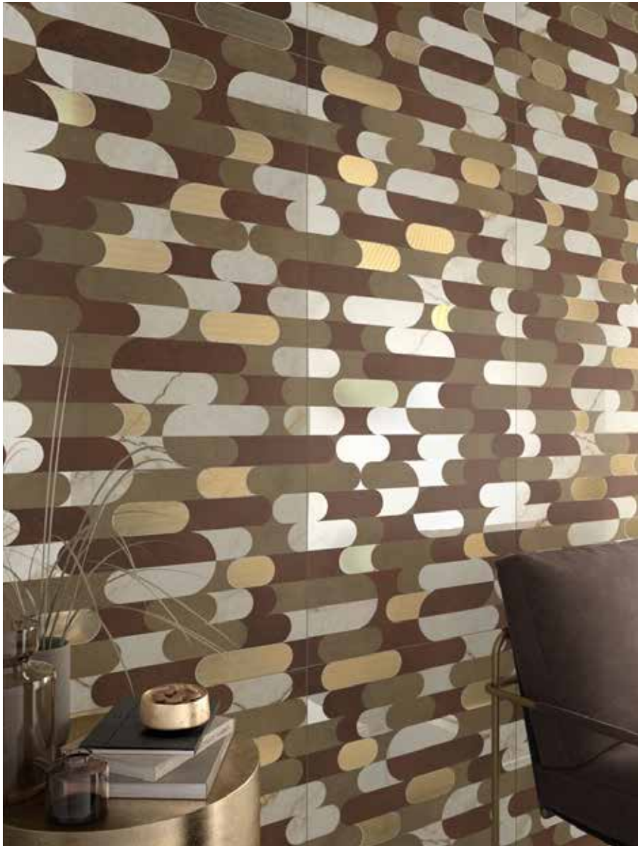
OR CRE DK 12 LP