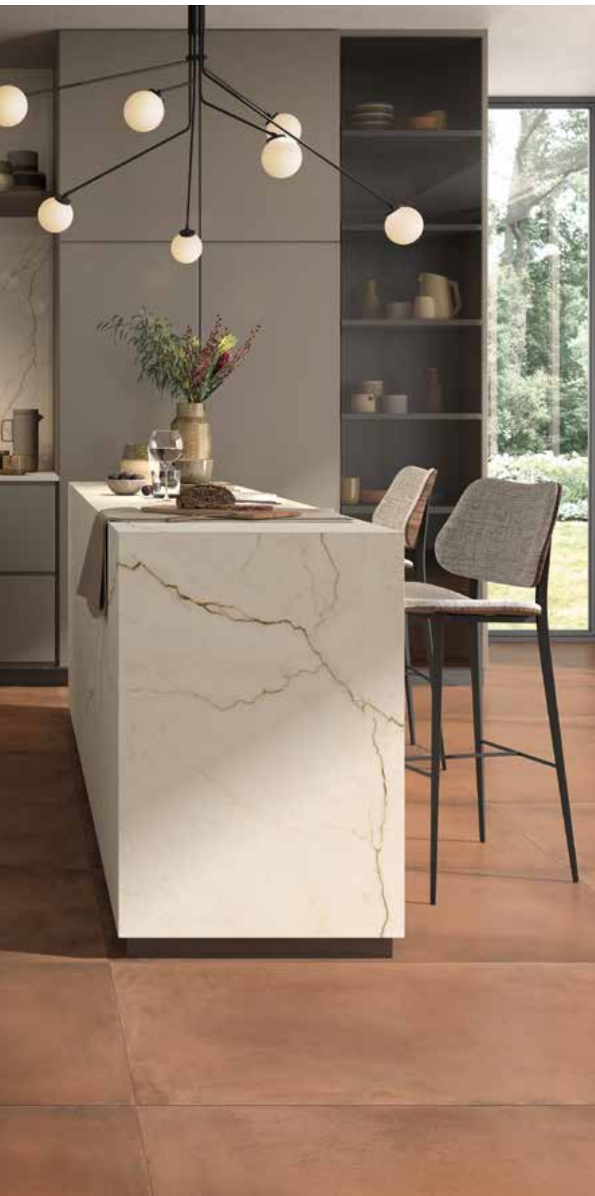
OR CRE 12 RM - OR CRE 12 LP - TERRA 12R RM