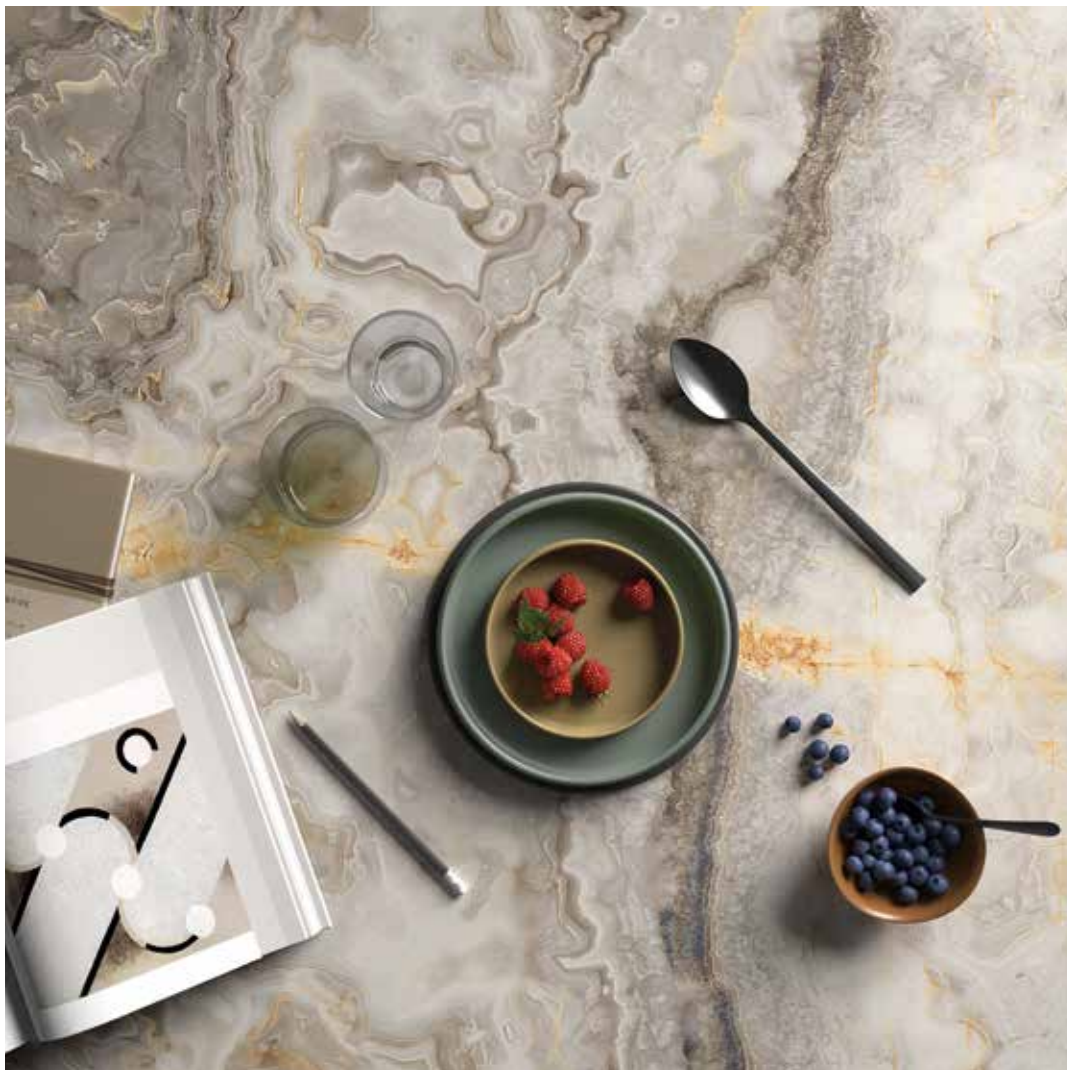
OR OCE 90 LP