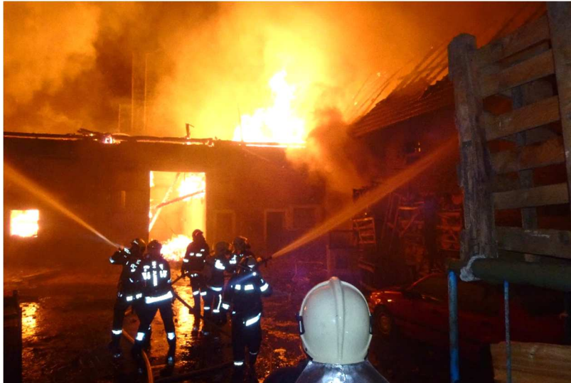
Brandeinsatz in Hofkirchen

Ein arbeitsreiches Jahr ist wieder vorüber. Heuer wurden wir jedoch nicht von großen Bränden verschont. Zweimal rief man uns um Hilfe in die Gemeinde Hofkirchen. Bei diesen Einsätzen waren 2 Atemschutztrupps von Losensteinleiten im Einsatz.