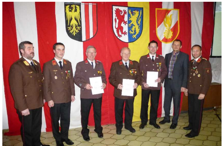
Vollversammlung der FF Losensteinleiten