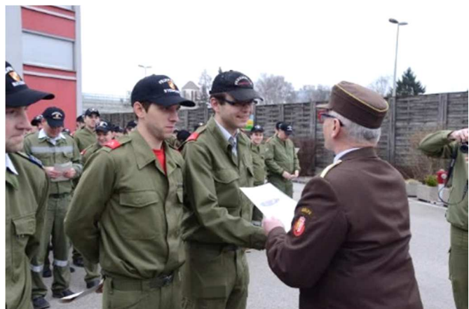
Funkleistungsabzeichen in Gold