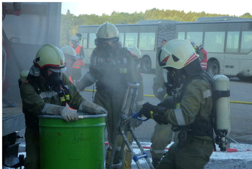
Übung mit Gefährlichen Stoffen

Um aber immer gut gerüstet und auch für schwierige Einsätze vorbereitet zu sein, absolvierten die Kameraden des Atemschutzes 5 Schulungen und bewiesen ihr Können bei 14 Atemschutzübungen.