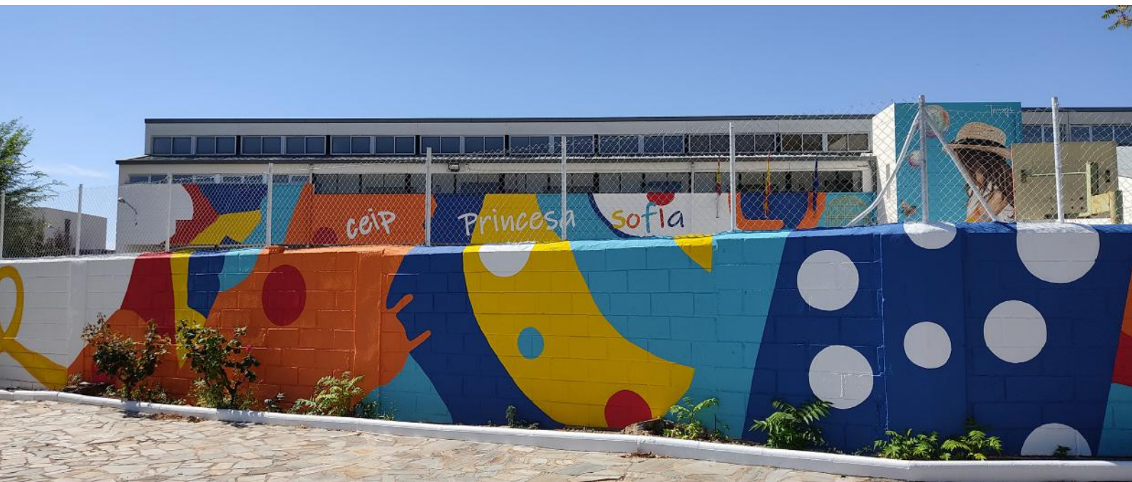
VUELA. CEIP PRINCESA SOFÍA, CTRA. CUENCA-ALBACETE MINGLANILLA. CUENCA. ESPAÑA. 2020