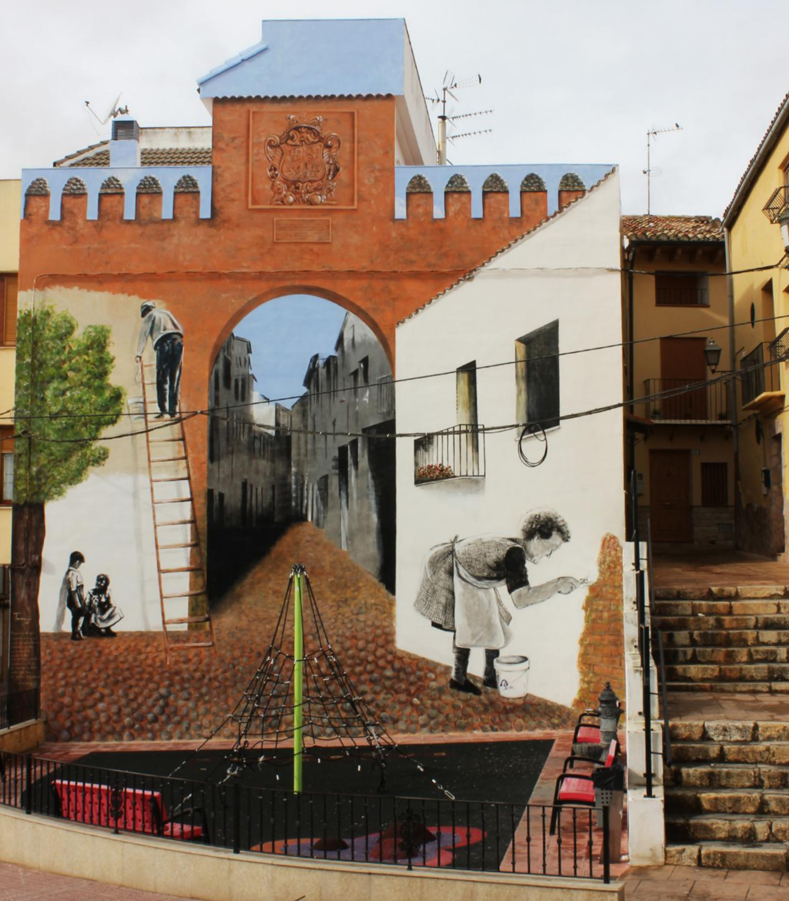
PUERTA NUEVA. CALLE CAMINO, UTIEL. VALENCIA. SPAIN. 2018