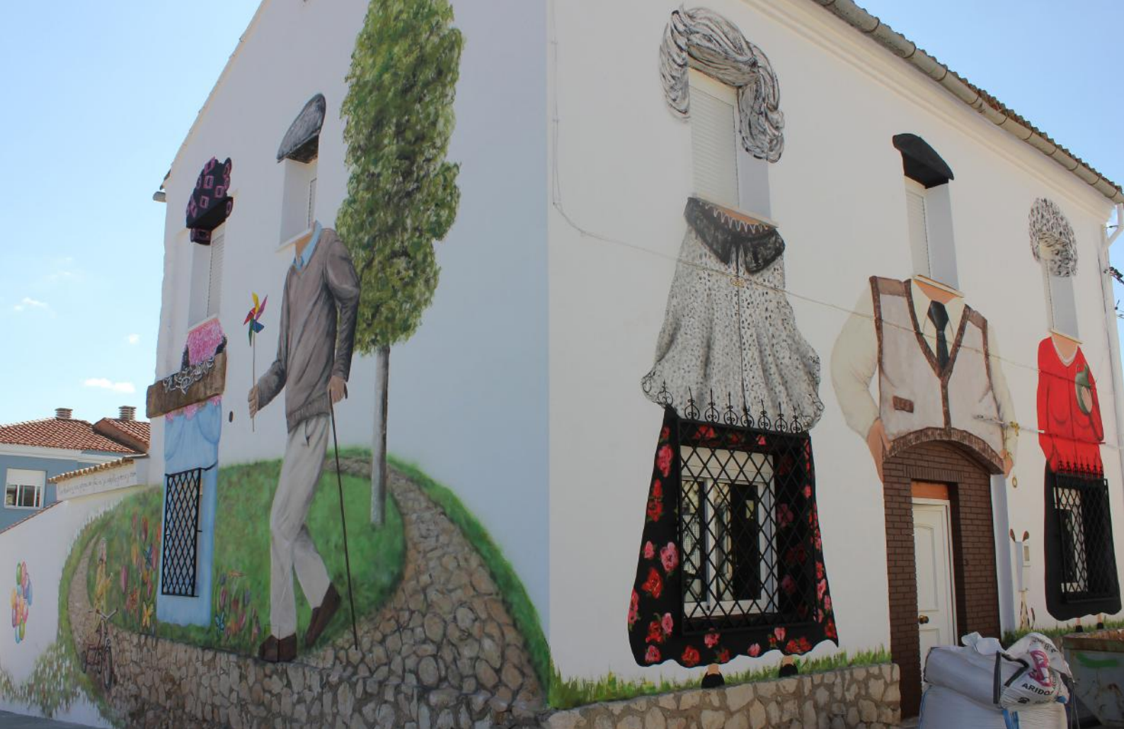
ABUELOS. CALLE DEL FAISÁN Y CALLE ESTE CAUDETE DE LAS FUENTES. VALENCIA. ESPAÑA. 2020