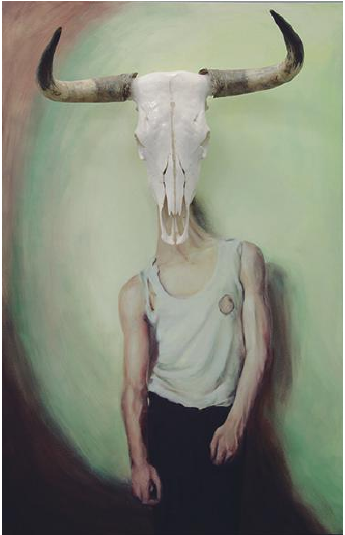
BULL MAN. ÓLEO Y ENSAMBLAJE SOBRE TABLA 154 x 100 x 50 cm. 2017