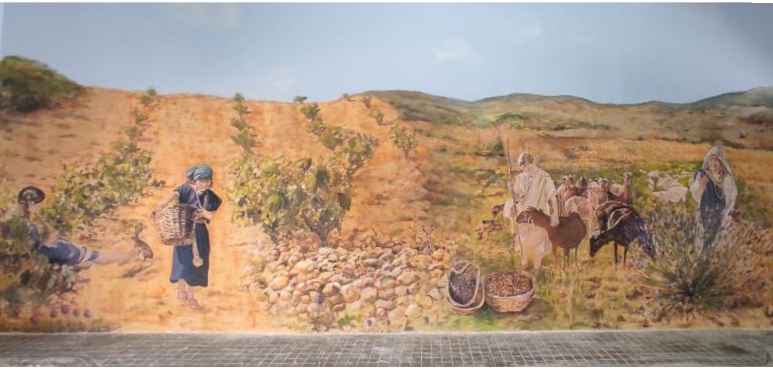
ÍBEROS. MUSEO GRÁFICA L. GARCÍA DE FUENTES, CALLE GARCÍA BERLANGA. CAUDETE DE LAS FUENTES. VALENCIA. ESPAÑA. 2021