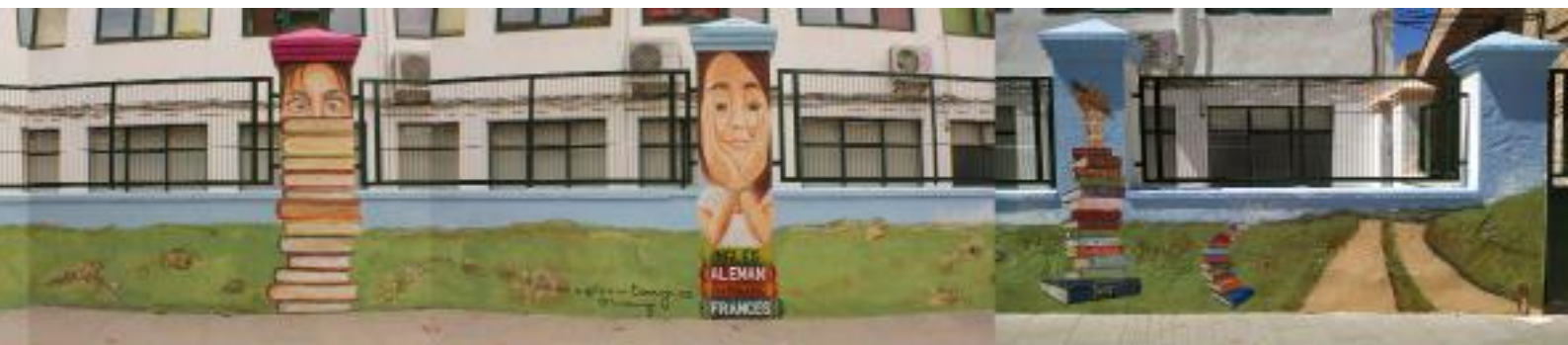
ESTUDIANTES. ESCUELA OFICIAL DE IDIOMAS CALLE SAN ILDEFONSO, UTIEL. VALENCIA. ESPAÑA. 2019