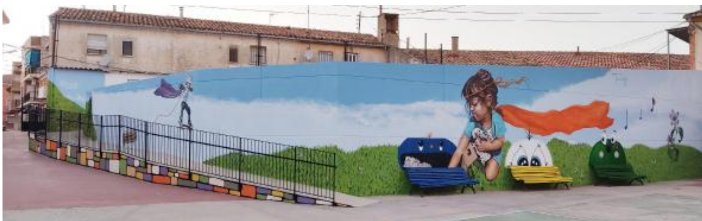
RECICLA. CEIP MAESTRO AGUILAR, CALLE ESCUELAS CAMPORROBLES. VALENCIA. ESPAÑA. 2020