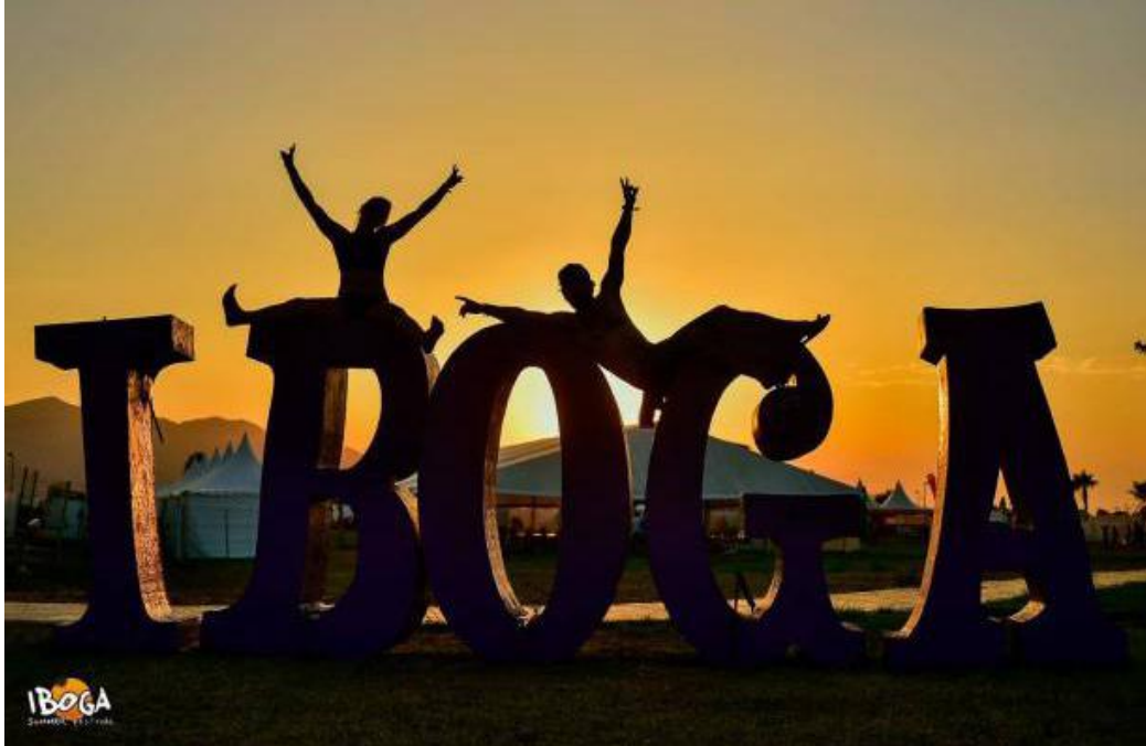
IBOGA SUMMER FESTIVAL, TAVERNES DE LA VALLDIGNA. VALENCIA. ESPAÑA. 2015