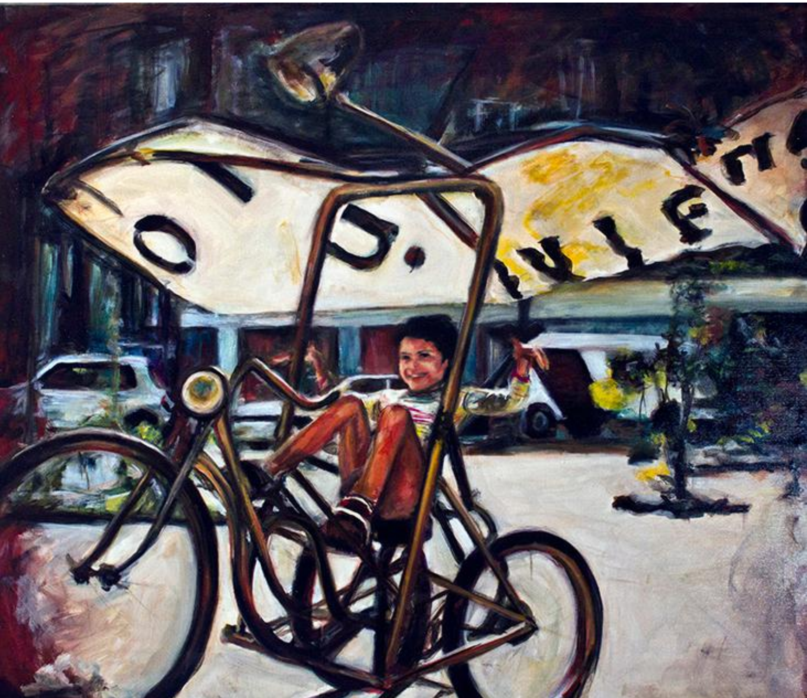
VOLANDO VOY, ÓLEO SOBRE LIENZO, 100 X 120 cm 2013