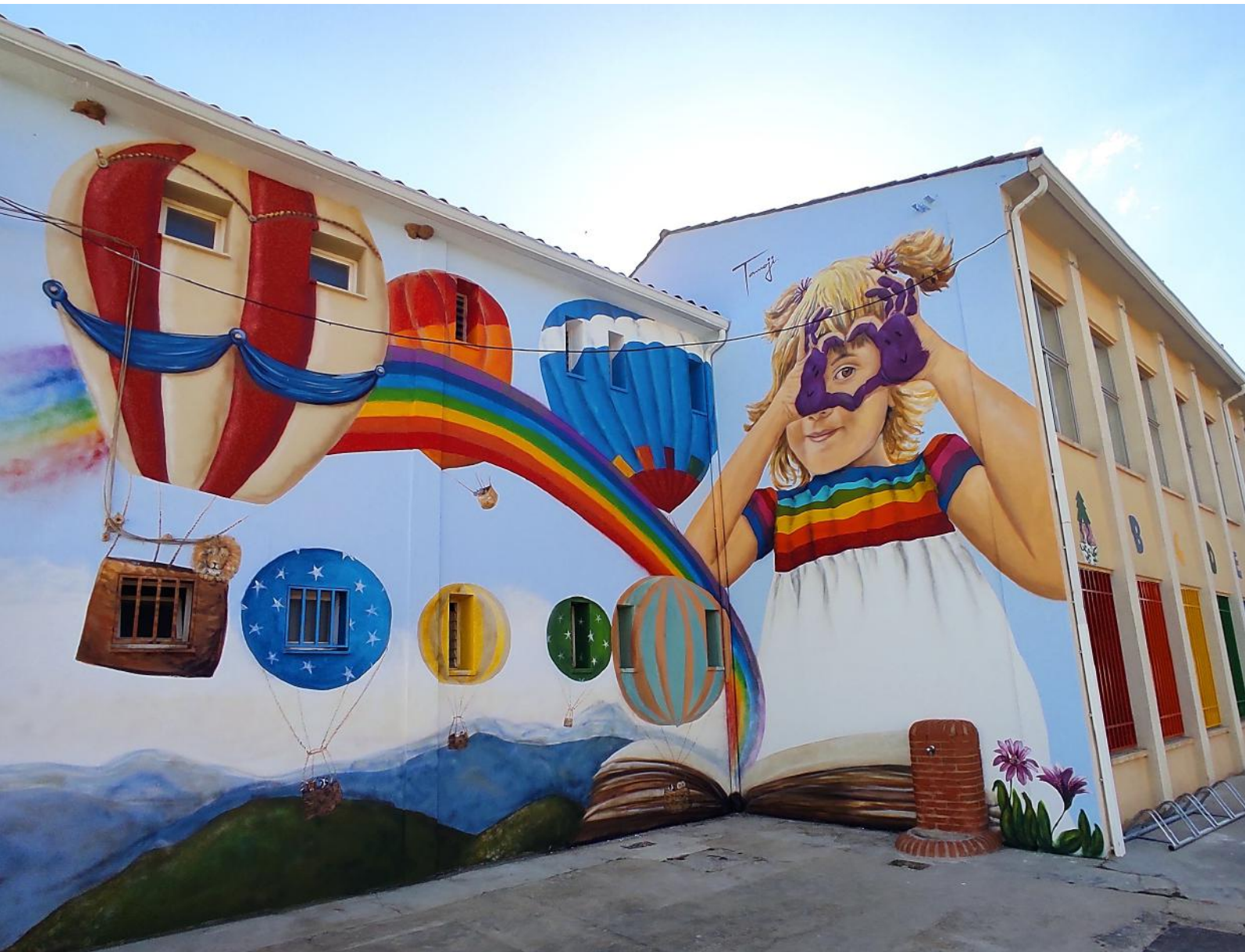
MANOS ARRIBA. CRA LOS PINARES, CALLE TOLEDILLO CAMPILLO DE ALTOBUEY CUENCA. ESPAÑA. 2021