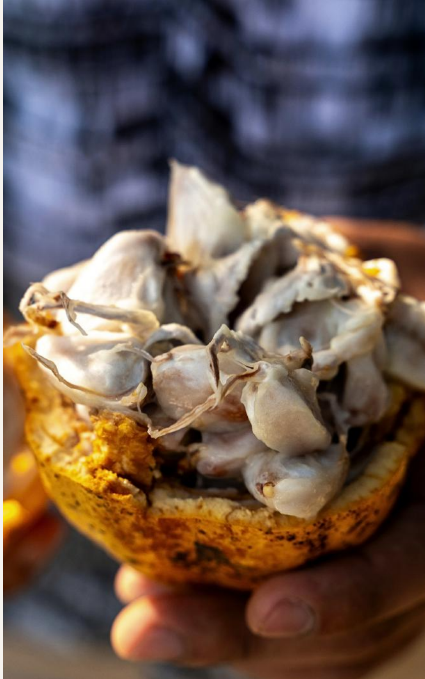
FOTO: CACAU FRESCO AGROECOLÓGICO SÍTIO BOBÁ.

Os fundadores passam a integrar uma rede construída através de circulação, reconhecimento e valor.