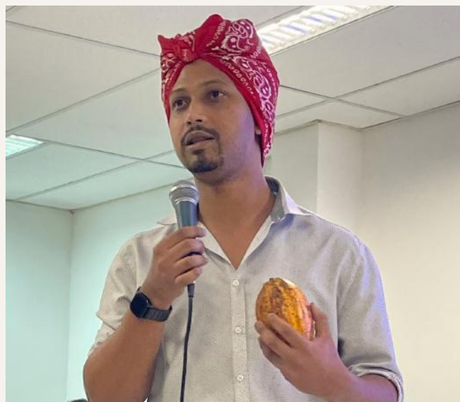
FOTO: PALESTRA SOBRE CONSUMO - UFRJ

Levamos para universidades e eventos um debate que raramente ocupa esses espaços: raça, reconhecimento e desigualdade na cadeia produtiva do cacau. Transformamos pesquisa em diálogo.