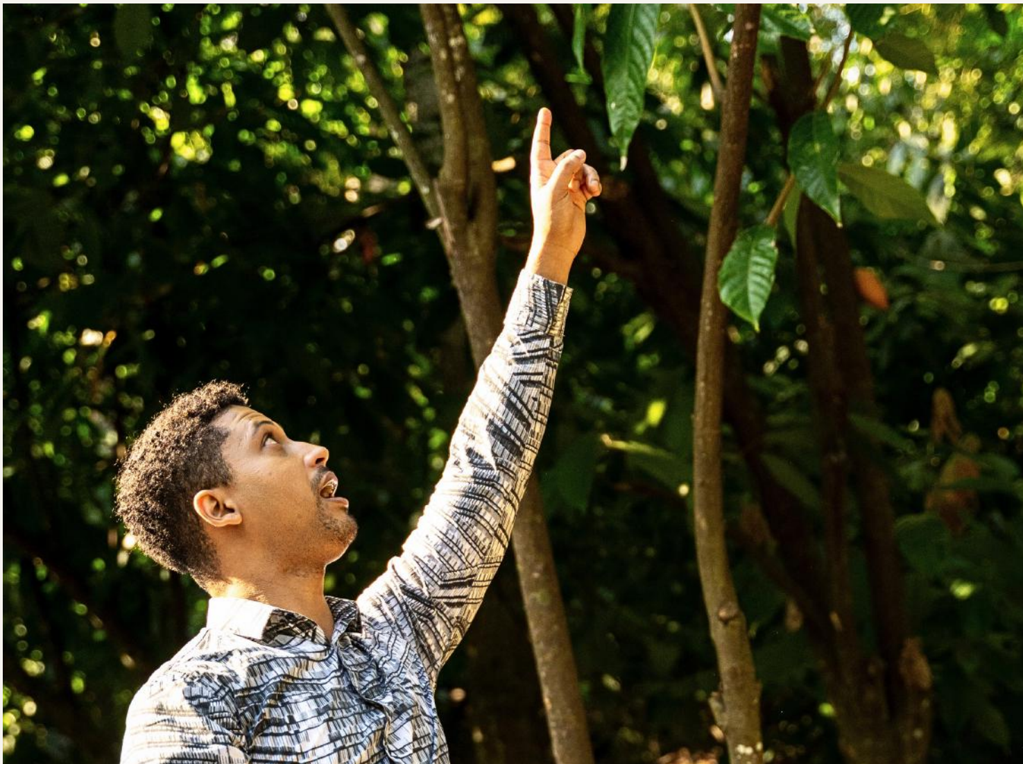
FOTO: SISTEMA AGROFLORESTAL CABRUCO — SÍTIO BAOBÁ • RIO BONITO • RJ