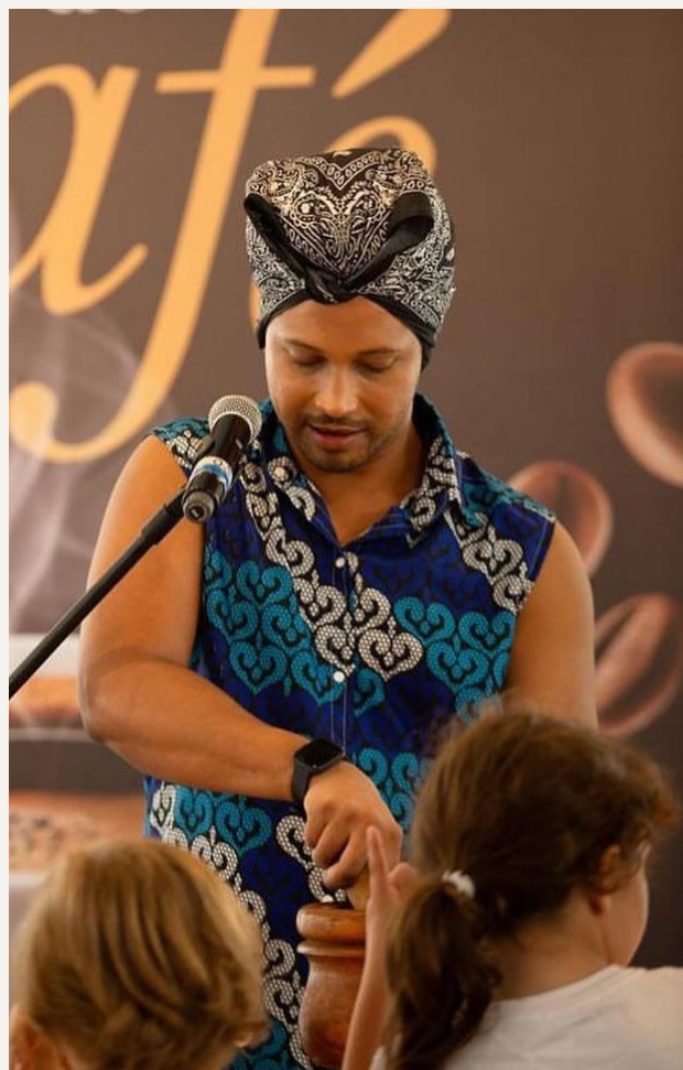
FOTO: APRESENTAÇÃO FESTIVAL DO CAFÉ

Parcerias com organizações como a Shell Brasil fortaleceram uma agenda que conecta pesquisa, território e impacto. Mais do que desenvolver produtos, passamos a ampliar oportunidades, reconhecimento e transformação racial.