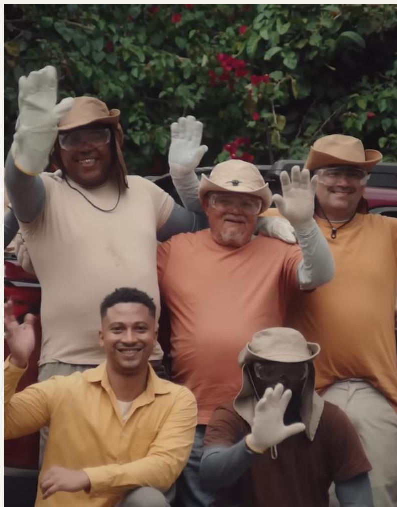
FOTO: CAMPANHA NACIONAL DA SHELL BRASIL. ATUAÇÃO JUNTO PRODUTORES

A campanha apresentou histórias reais de pessoas e organizações que transformam seus territórios por meio da colaboração, tendo a trajetória da Black Cacau como uma de suas narrativas centrais.