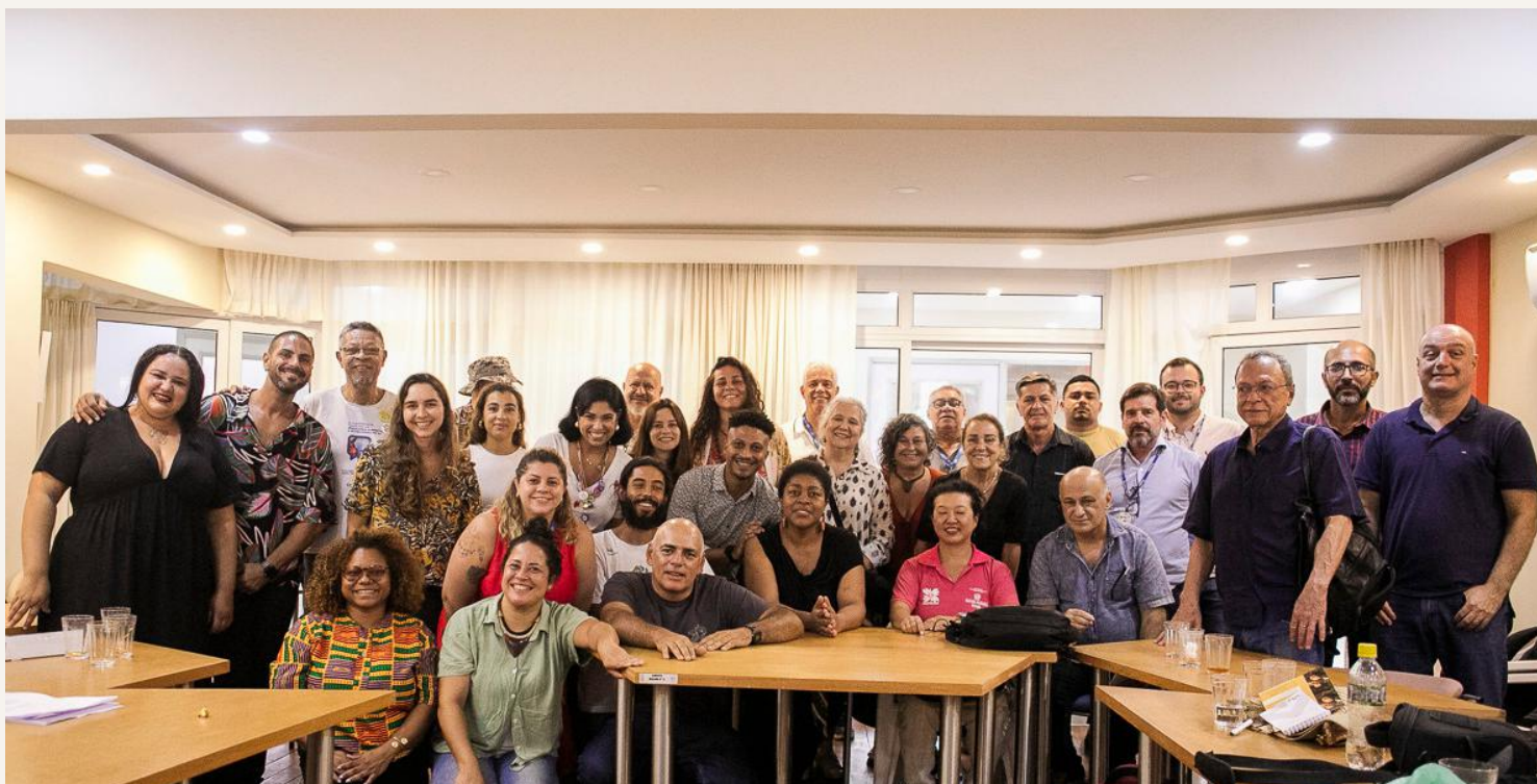
FOTO: PRIMEIRA REUNIÃO AMPLIADA, REALIZADA EM 2025. REPRESENTANTES DA CADEIA PRODUTIVA DO CACAU FLUMINENSE.

O FORTALECIMENTO DO CACAU TAMBÉM ACONTECE EM ESPAÇOS DE ARTICULAÇÃO.