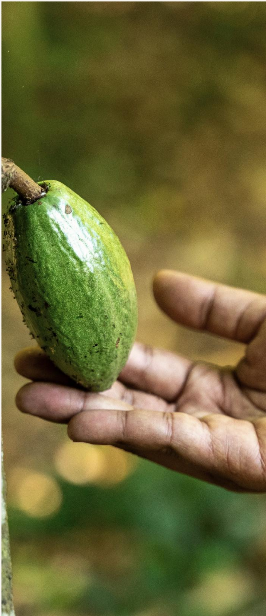
FOTO: SISTEMA AGROFLORESTAL CABRUCO - SÍTIO BAOBÁ

O CACAU É NEGRO. O RECONHECIMENTO AINDA NÃO.