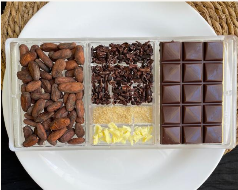
FOTO: BARRA DE CHOCOLATE BLACK CACAU.