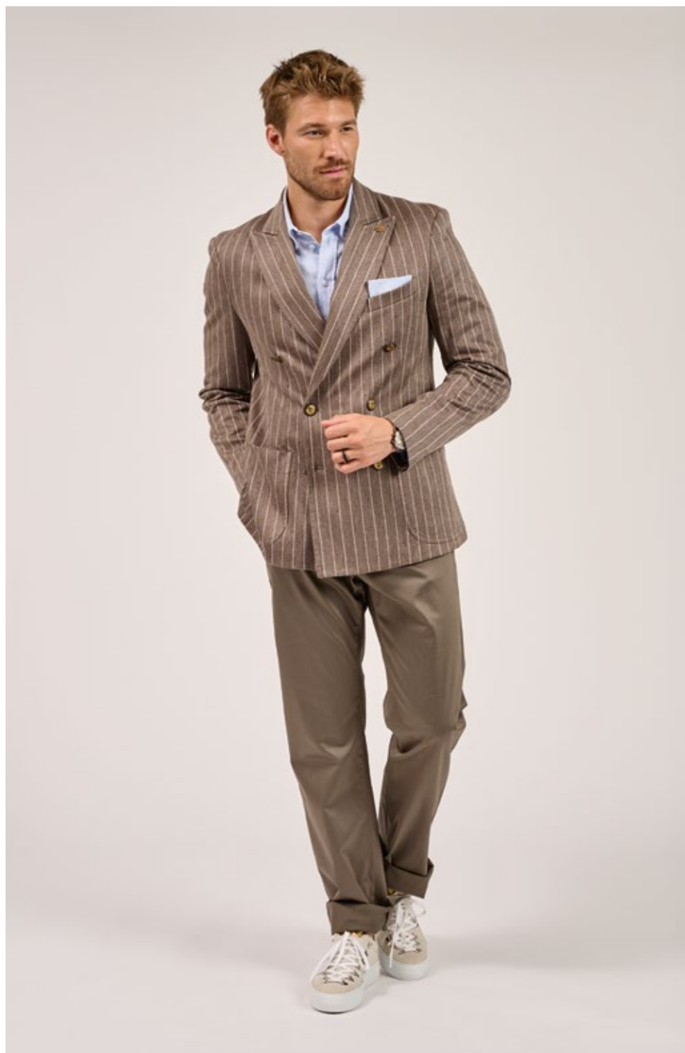
Blazer Lusimone K46080 | Hemd Lubenzio H46020 Hose Lupedro K46330 | Sneaker Luleon A46515