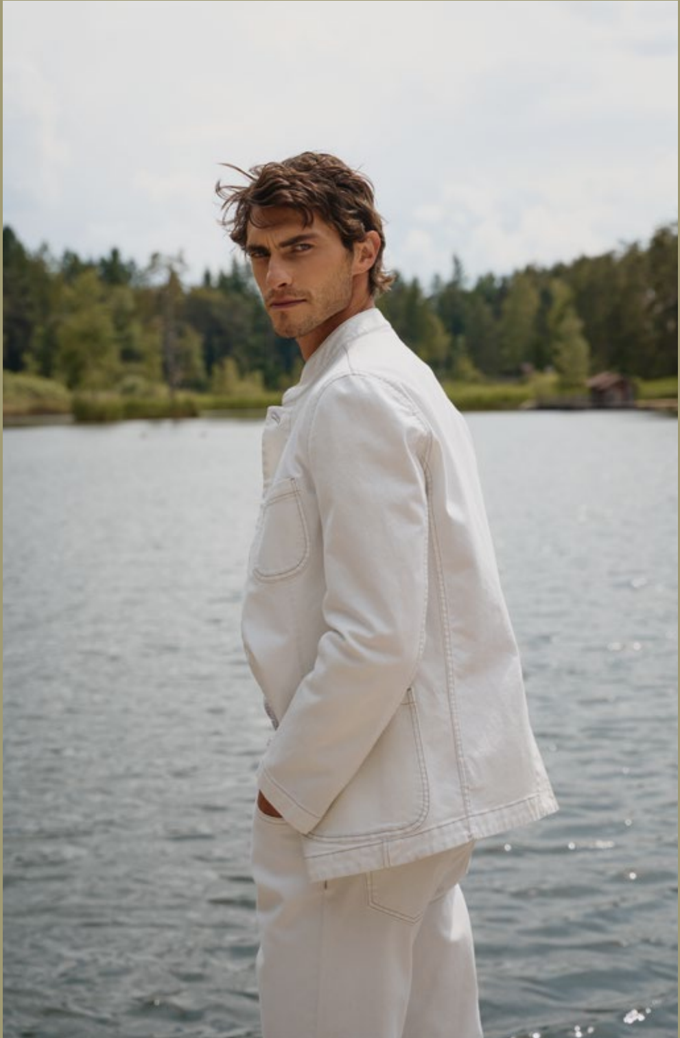
Blazer Lusandro K46008 | Hose Lupedro K46333