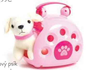
Plyšový psík s prepravkou, PEPCO 7,00€