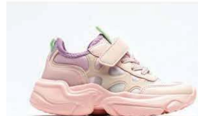
Tenisky, CCC 24,95€

Modré, neónové, ružové, svietiace... Hlavne nech to žije farbami! Každý krok sa stane cestou k novému veselému dobrodružstvu.