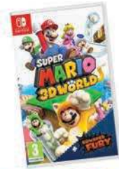
Super Mario 3D World + Bowser's Fury Nintendo SWITCH, PROGAMINGSHOP 54,99€