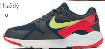
Tenisky NIKE, A3 SPORT 43,60€