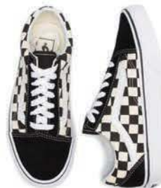
Tenisky, VANS OLD SKOOL, BOARD PARADISE 64,00€