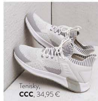
Tenisky, CCC , 34,95 €