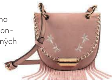
Kabelka, C&A 19,99€