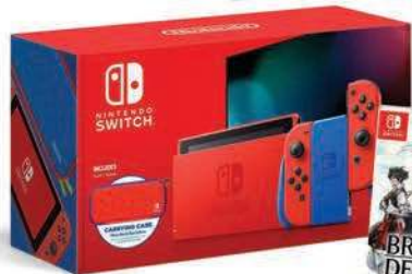
Nintendo Switch Mario Red & Blue Edition, PROGAMINGSHOP 319,99€