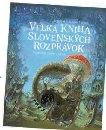
Veľká kniha slovenských rozprávok, MARTINUS 22,48€