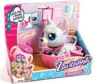
Psík s možnosťou kŕmenia, PEPCO 10,00€

Asi každé dieťa túži po svojom vlastnom domácom miláčikovi. Ale ako je to potom s ich starostlivosťou? Žadovajte im zvieratko - hračku "na skúšku". S ním si to budú môcť vyskúšať bez toho, aby ste neskôr nemuseli ľutovať, že máte doma to živé.