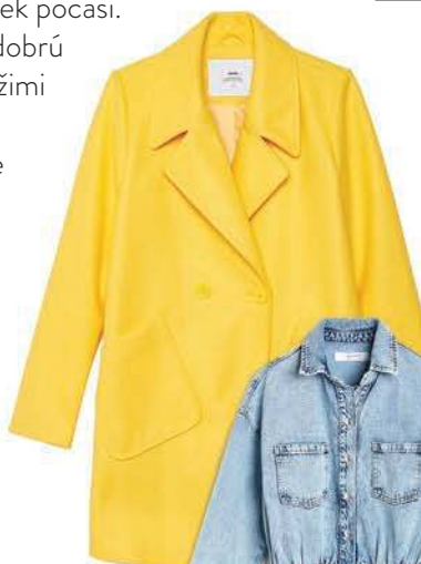
Kabát, CROPP 39,99€

Spravte si dobrú náladu sviežimi odtieňmi a zadoväzte si ho ešte dnes!