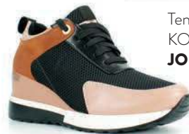
Tenisky, HOLMANN KOMFORT, JOHN GARFIELD 35,00€