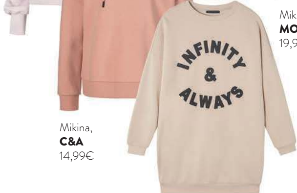
Mikina, C&A 14,99€

Čo sa farieb týka tak voľte jednoznačne farby z pastelových odtieňov sivej, béžovej a ružovej. Ak si zvolíte predsa len väčší motív loga, stavte na kvalitnú značku, ktorá vám bude za to stáť.