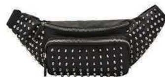
Ľadvinka s vybijancami, CROPP 19,99€