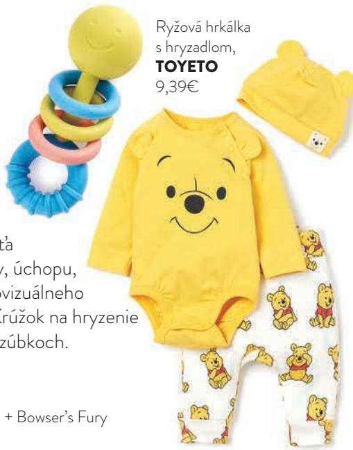
Ryžová hrkálka s hryzadlom, TOYETO 9,39€

Príjemné pastelové farby, usmievavá tvárička, hrkajúce časti a hryzadlo. Čo viac by ste potrebovali od hračky určenej najmenším deťom? Možno ešte bezpečný a ekologický materiál, ktorým je v tomto prípade japonská ryža bez toxických prísad. Hra s hrkálkou u dieťaťa podporuje rozvoj jemnej detskej motoriky, úchopu, koordinácie oko-ruka, hmatového i audiovizuálneho vnímania, neskôr aj logického myslenia. Krúžok na hryzenie zas pomôže uľaviť pri boľavých rastúcich zúbkoch.