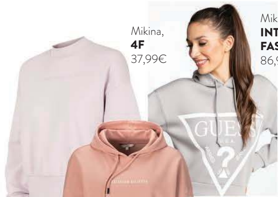
Mikina, 4F 37,99€