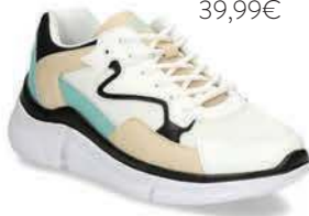
Tenisky, BAŤA 39,99€