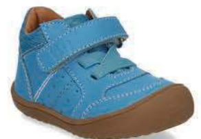
Členkové topánky z pravej kože značky BUBBLEGUMMERS, BAŤA 35,99€