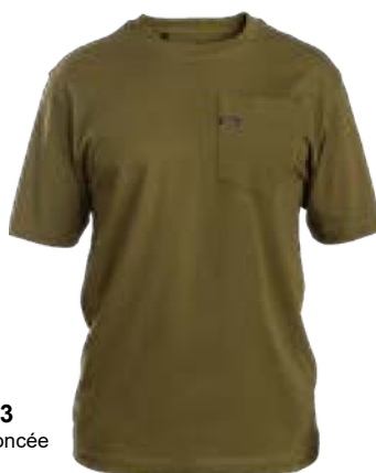
D23 Olive foncée