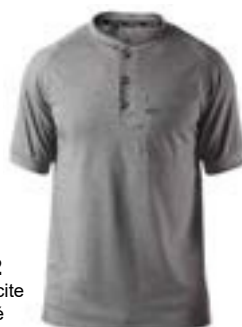
D22 Anthracite chiné