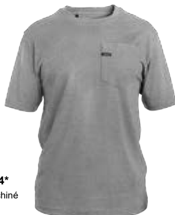
554* Gris chiné