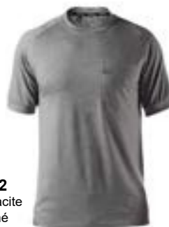
D22 Anthracite chiné