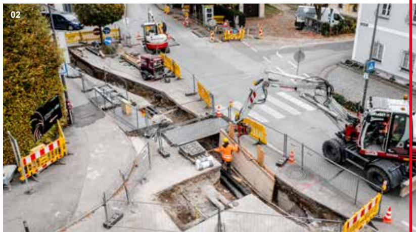
01 Fernwärme Geothermie, Braunau Simbach | Umlegung der Hauptleitung aufgrund der Errichtung eines Hochwasserschutzes