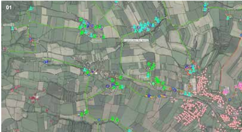
01 Schemaplan | FTTH Projekt

GPS-VERMESSUNG | TACHYMETRISCHE VERMESSUNG | NATURBESTANDSAUFNAHMEN | LEITUNGSKATASTER | PROJEKTIERUNGEN