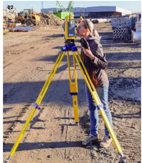
02 Tachymetrische Vermessung | Auf- und Einmessung von Punkten