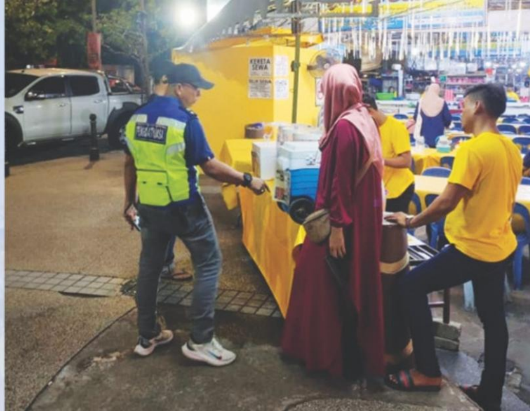
▲ Ops Street pada 4 Jun 2024.