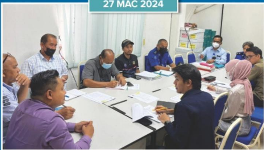
Pelaksanaan Audit MS ISO di Jabatan Penguatkuasaan