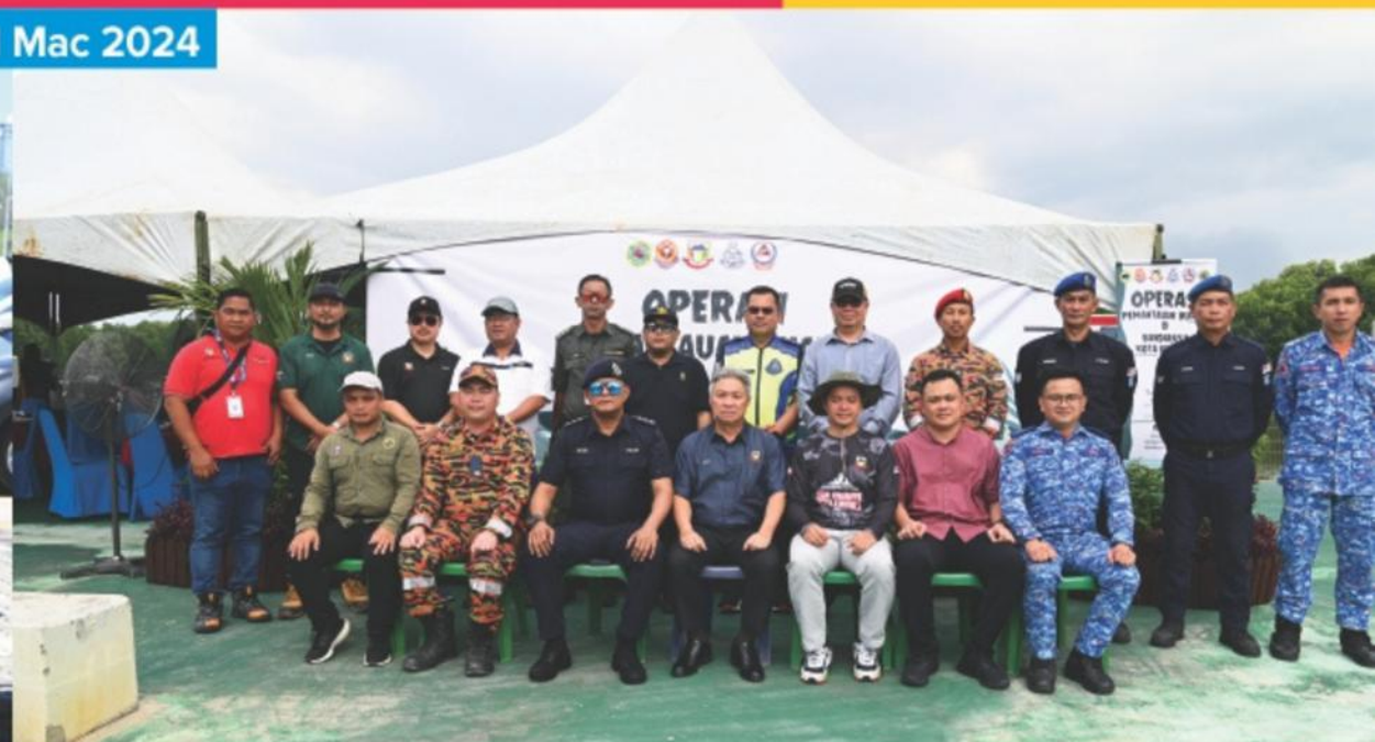
OPERASI PEMANTAUAN BUAYA DI BANDARAYA KOTA KINABALU SESI 1/2024