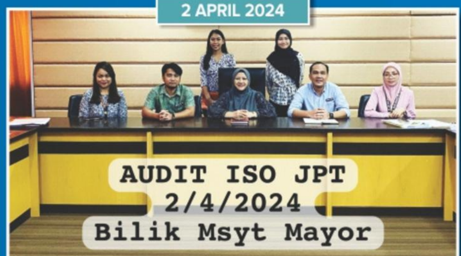
Pelaksanaan Audit MS ISO di Jabatan Pengangkutan dan Trafik