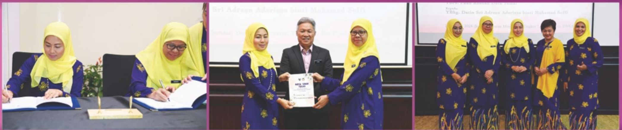
Dewan Mesyuarat, DBKK

MAJLIS PENYAMPAIAN NOTA SERAH TUGAS PENERUSI PUSPANITA CBKK