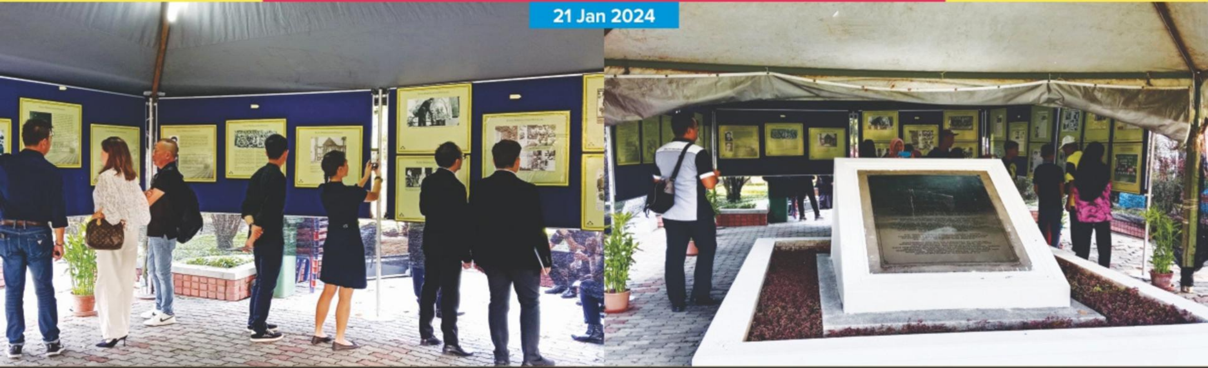
PAMERAN SEMPERNA UPACARA MEMPERINGATI MANGSA-MANGSA PERANG PETAGAS DI TUGU PERINGATAN PETAGAS