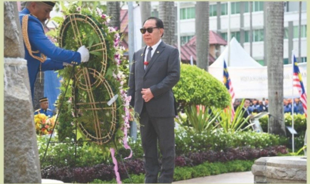
▲ Yang Berhormat Datuk Seri Panglima Dr. Jeffrey G. Kitingan, Timbalan Ketua Menteri I mendahului istiadat meletakkan karangan bunga.