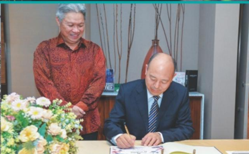
LAWATAN DELEGASI DARIPADA KERAJAAN CHINA CHANGSHA CITY