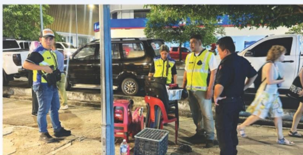
▲ Ops Street pada 9 Jun 2024.