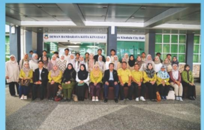
▲ 26 Jun 2024: Lawatan Akademik Program Pengurusan Hartanah, Jabatan Pengajian Alam Bina dan Teknologi Kolej Pengajian Alam Bina, Universiti Teknologi MARA (UiTM) Cawangan Perak, Kampus Seri Iskandar.