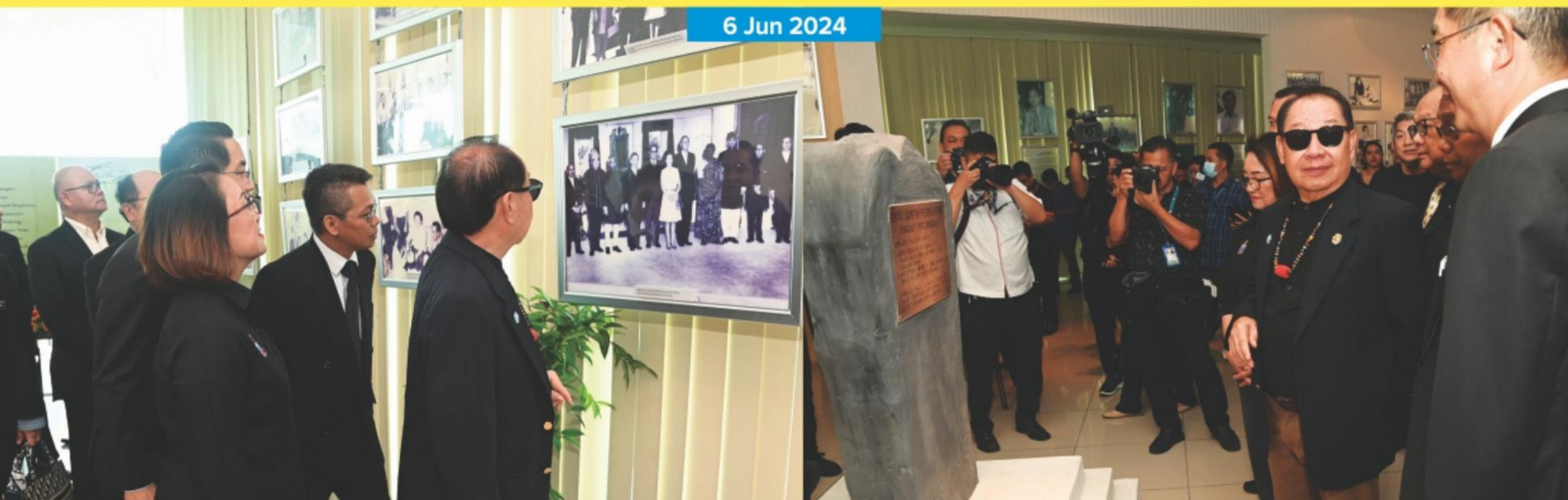
PAMERAN SEMPERA MAJLIS TILAWAH DAN HAFAZAN AL-QURAN PERINGKAT NEGERI SABAH DI PERKARANGAN DEWAN SRI PUTATAN