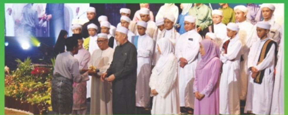
▲ Penyampaian sumbangan sejadiah kepada lima masjid dan lima surau sekitar Bandaraya Kota Kinabalu oleh Tuan Yang Terutama Tun Datuk Seri Panglima (Dr.) Haji Juhar bin Datuk Haji Mahiruddin.