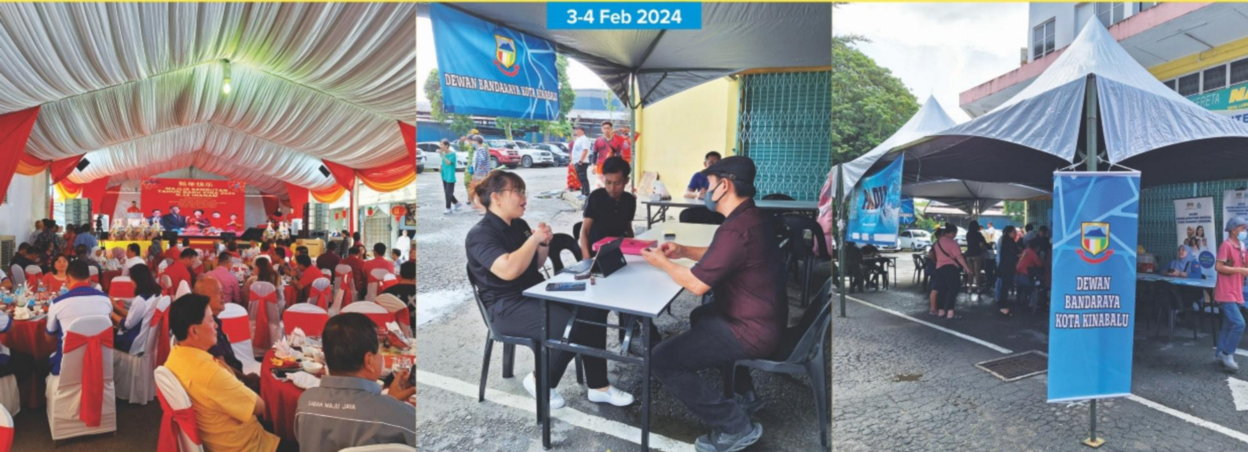
PROGRAM KHAS SAMBUTAN TAHUN BAHARU CINA BAGI KAWASAN DEWAN UNDANGAN NEGERI (DUN) N.18 INANAM BERTEMPAT DI KOLOMBONG INDUSTRIAL ESTATE.