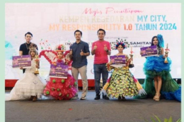
▲ Tahnikah diucapkan kepada para pemenang Pertandingan Kids Fashion Show.