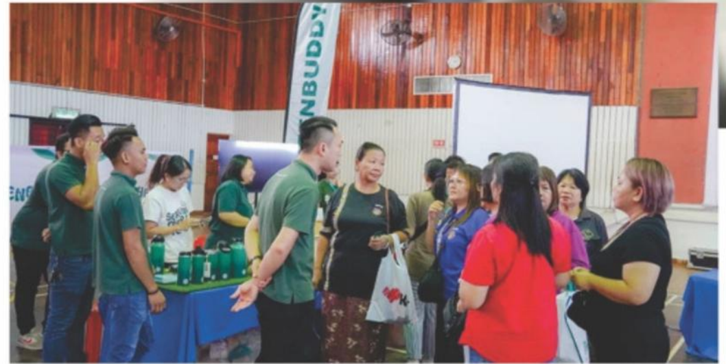
▲ Green Buddy memperkenalkan barangan kitar semula ( biodegradable ) kepada peniaga-peniaga pasar.