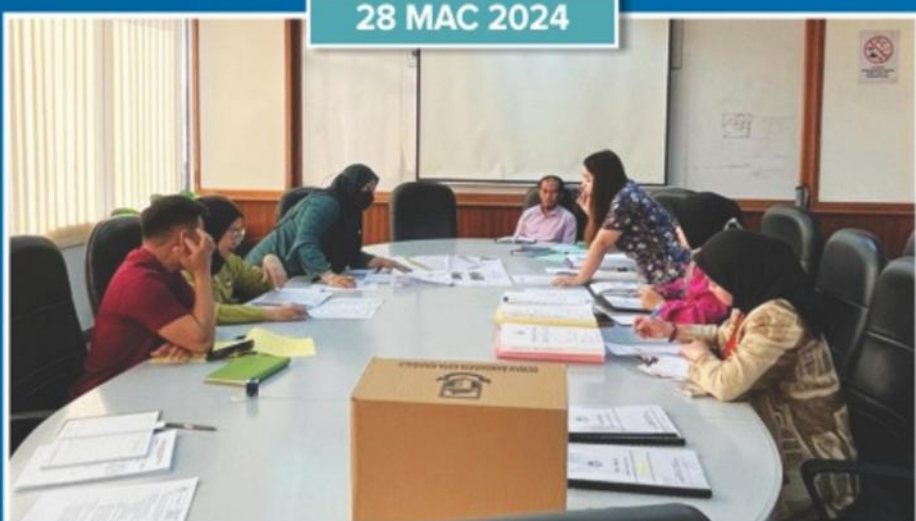
Pelaksanaan Audit MS ISO di Jabatan Kawalan Bangunan