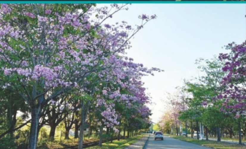
KK HIJAU DAN INDAH