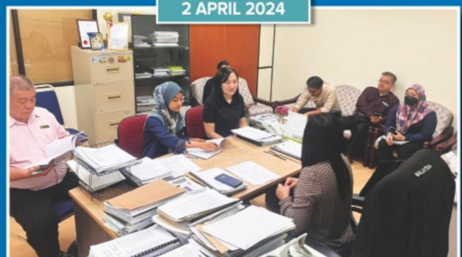
Pelaksanaan Audit MS ISO di Jabatan Kesihatan Persekitaran Bandaraya