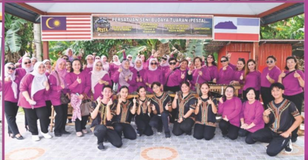
Rumah Bakti Harapan, Inanam, Pusat Penyelidikan Bioteknologi Koko, Lembaga Koko Sabah, FAMA