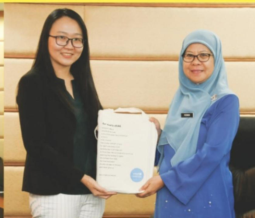
PERBINCANGAN BERHUBUNG PELAKSANAAN INISIATIF BANDAR MESRA KANAK-KANAK (CFCI) BERSAMA UNITED NATIONS CHILDREN'S FUND (UNICEF)