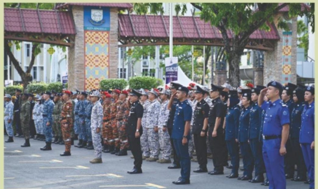
▲ Kontinjen beruniform perbarisan statik.