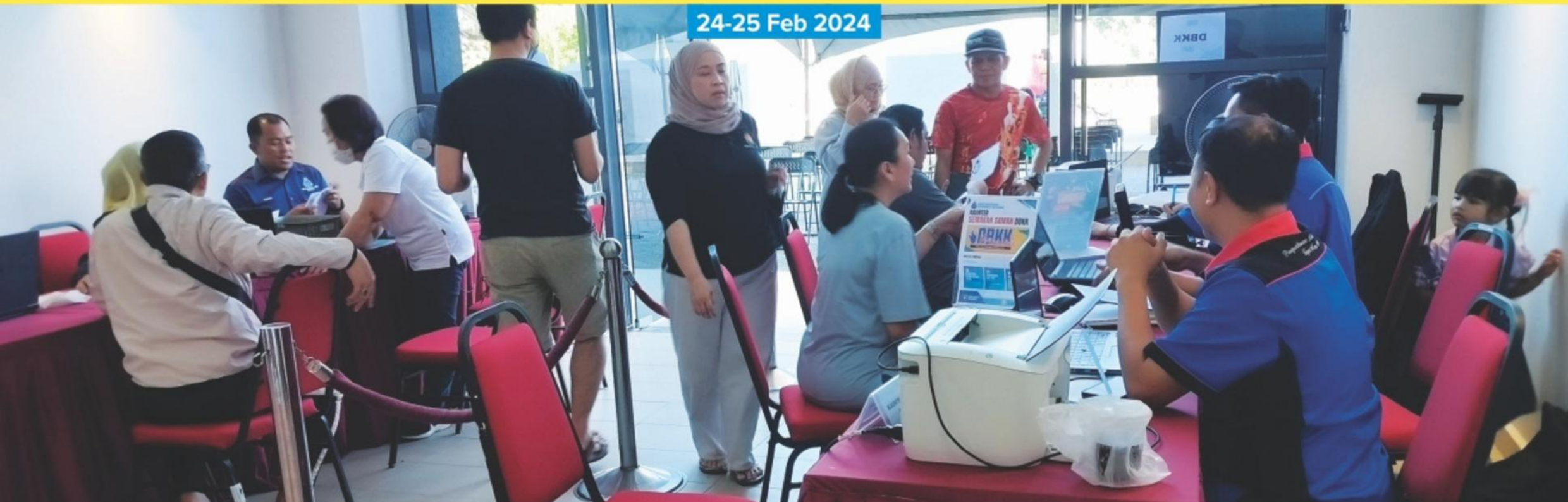
PROGRAM JUMBLE SALE DI PEKARANGAN KOMPLEKS MAHKAMAH KOTA KINABALU