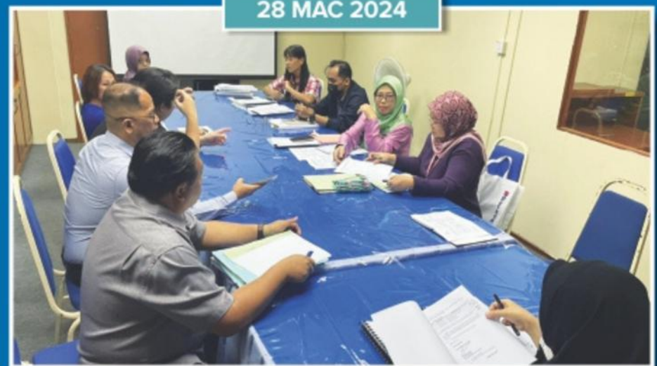
Pelaksanaan Audit MS ISO di Jabatan Perundangan