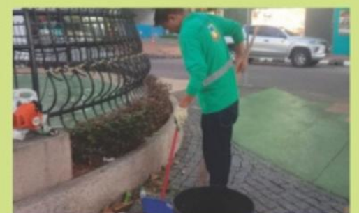
Kerja-kerja pembersihan Lintasan Deasoka oleh Unit Taman Awam, Jabatan Landskap DBKK pada 05 Mei 2024.