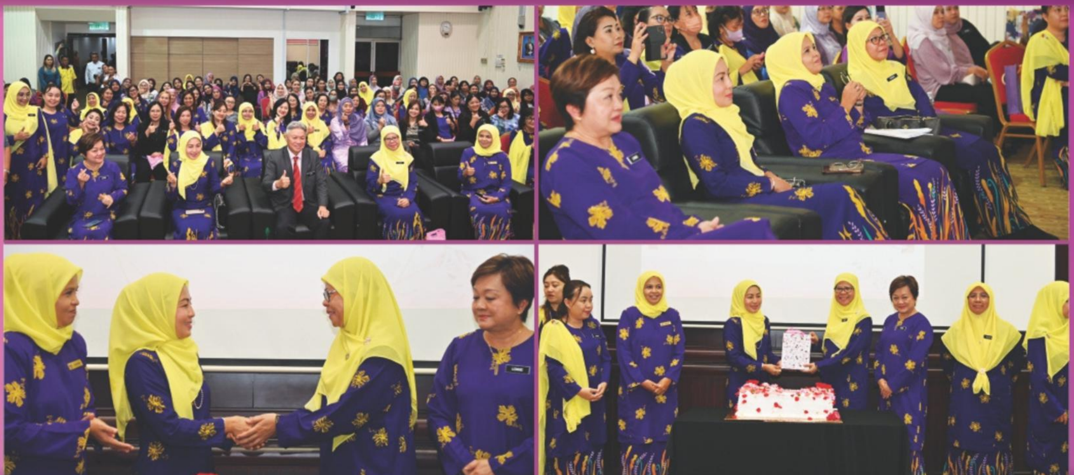
Dewan Mesyuarat, DBKK

MESYUARAT AGUNG TAHUNAN (AGM) PUSPANITA CBKK