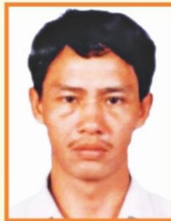
YANTIS @ ANTIS GITOM