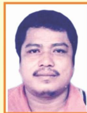
POIT BIN KANAM