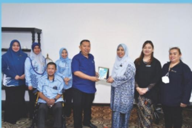
▲ 17 Mei 2024: Lawatan Kerja Perbadanan Labuan.