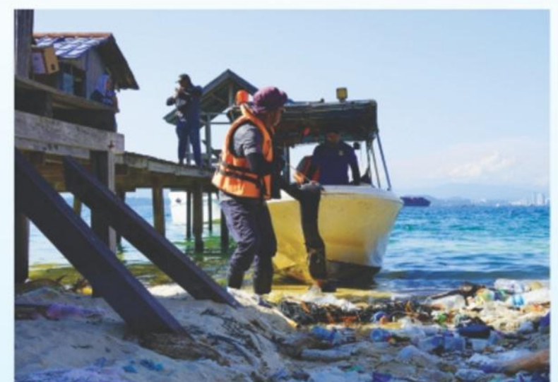
▲ Anggota-anggota Jabatan Pengurusan Sisa Pepejal juga bekerjasama dalam menjayakan program ini.