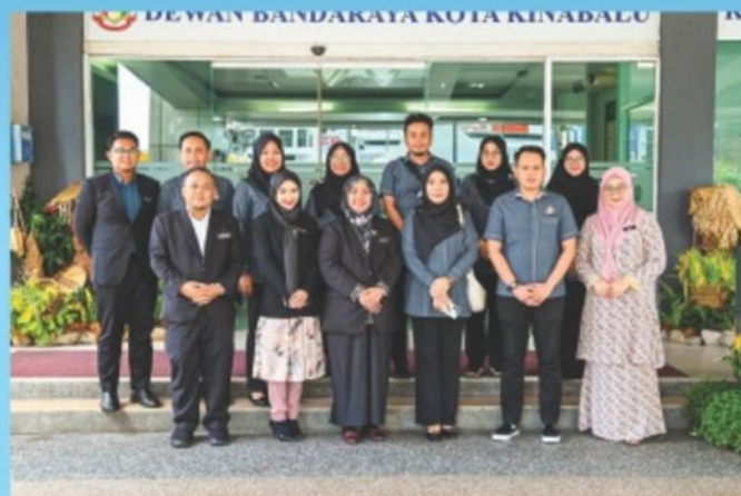
▲ 27 Mei 2024: Lawatan Kerja Majlis Bandaraya Johor Bahru (MBJB).