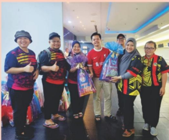
Gambar kenangan sekitar Kejohanan 4 Penjurus Dalaman DBKK (Antara Sektor) anjuran Kelab Bowling DBKK.