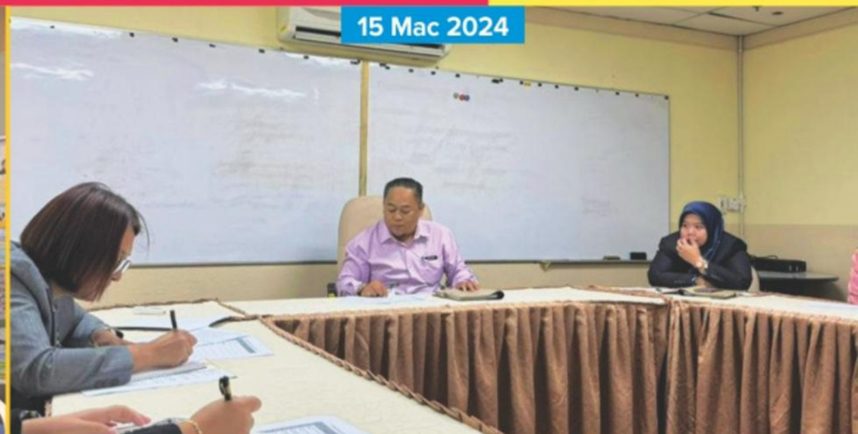
Perbincangan berhubung Cadangan Elemen Inovasi Dimasukkan Di Dalam Sasaran Kerja Tahunan (SKT) Bersama Jabatan Pembangunan Sumber Manusia (JPSM) DBKK.