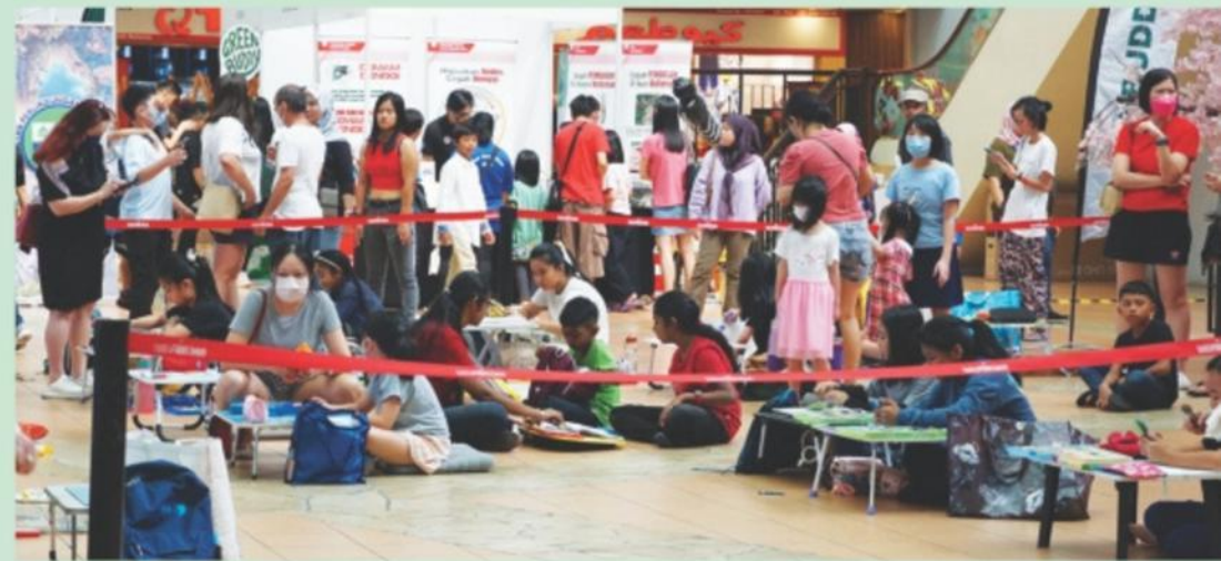
▲ Para peserta Pertandingan Mewarna dan Melukis Poster.