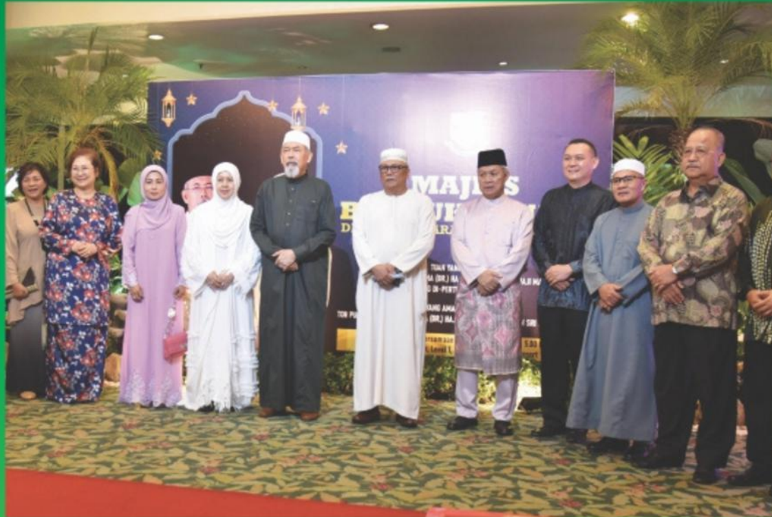
▲ Tuan Yang Terutama Tun Datuk Seri Panglima (Dr.) Haji Juhar bin Datuk Haji Mahiruddin dan Yang Amat Berbahagia Toh Puan Datuk Seri Panglima (Dr.) Hajah Norlidah binti Tan Sri Datuk R.M Jasni bersama dif-dif kenamaan.

Majlis Berbuka Puasa Bersama Tuan Yang Terutama Tun Datuk Seri Panglima (Dr.) Haji Juhar bin Datuk Haji Mahiruddin, Yang di-Pertua Negeri Sabah dan Yang Amat Berbahagia Toh Puan Datuk Seri Panglima (Dr.) Hajah Norlidah binti Tan Sri Datuk R.M. Jasni diadakan pada 27 Mac 2024 bersamaan dengan 16 Ramadan 1445H.