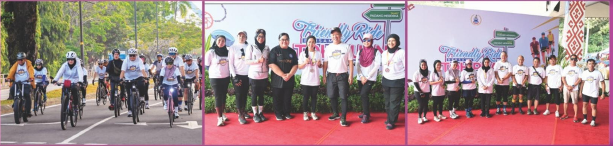
Padang Merdeka Kota Kinabalu