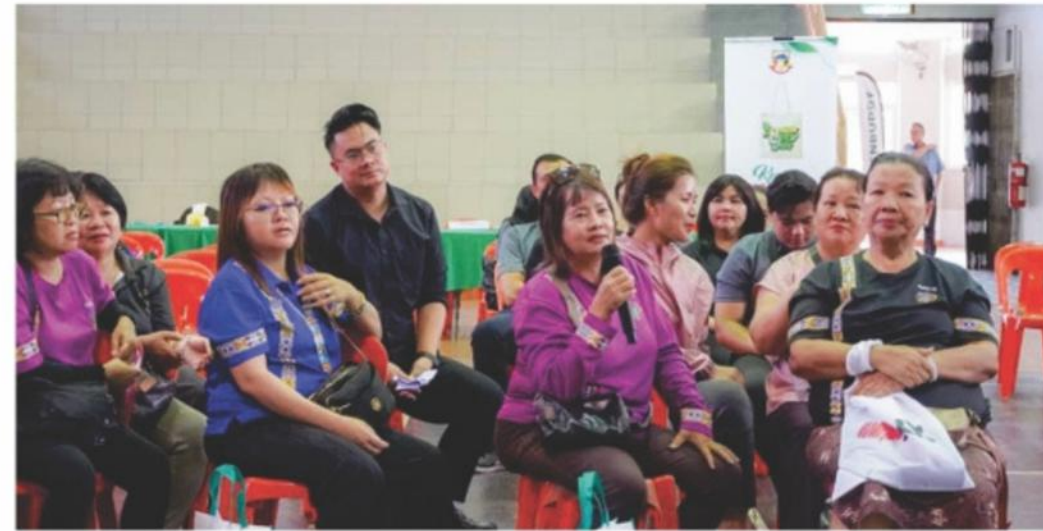
▲ Sesi soal jawab bersama Pengarah, Jabatan Pengurusan Sisa Pepejal.