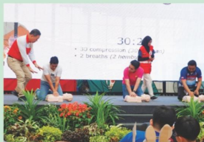
▲ Persatuan Bulan Sabit Merah mengadakan demonstrasi cara-cara bantuan awal semasa kecemasan.