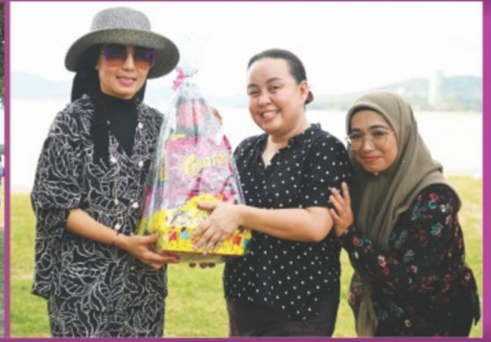
Taman Awam Teluk Likas