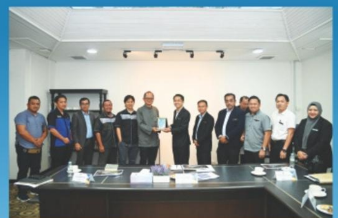
▲ 29 April 2024: Lawatan Kerja Pusat Pengurusan NR dan Fasiliti Perumahan Pelajar Universiti Malaysia Sabah (UMS) ke DBKK.