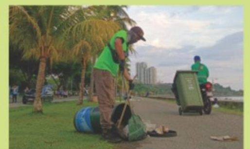
Anggota-anggota Unit Taman Awam, Jabatan Landskap DBKK sedang melakukan kerja-kerja pembersihan di Taman Awam Teluk Likas dan di sepanjang trek 'jogging' serta laluan berbasikal, Teluk Likas.