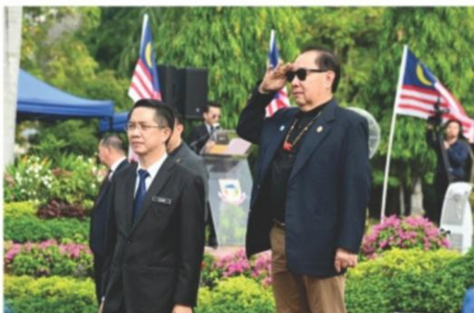
▲ Yang Berhormat Datuk Seri Panglima Dr. Jeffrey G. Kitingan, Timbalan Ketua Menteri I menerima tabik hormat daripada pasukan kawalan kehormatan Dewan Bandaraya Kota Kinabalu (DBKK).

Acara kemudian diteruskan dengan sesi lawatan ke Galeri "Double Six" dan tayangan dokumentari sejarah tragedi "Double Six".