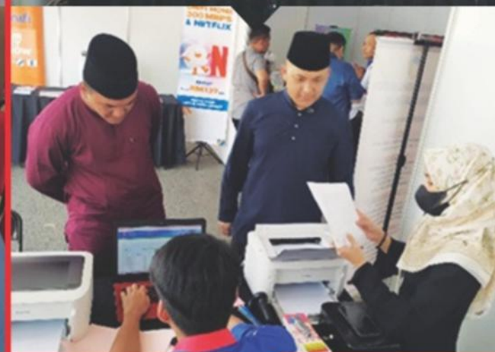
Pembukaan Kaunter Bayaran Sempena Program Race Expo & Race Pack Collection Borneo Half Marathon 2024