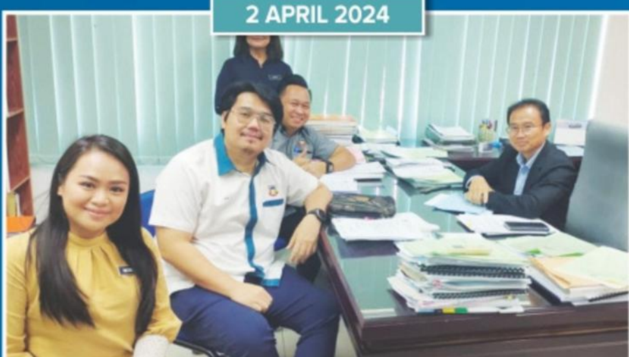
Pelaksanaan Audit MS ISO di Jabatan Kawalan Bangunan