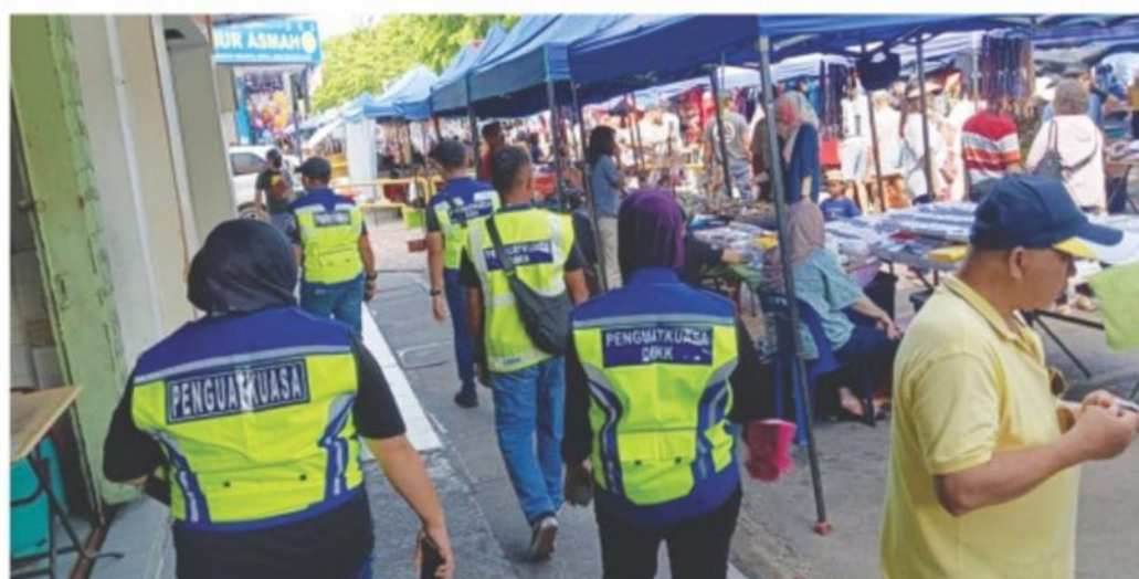
▲ Ops Street pada 16 Jun 2024.