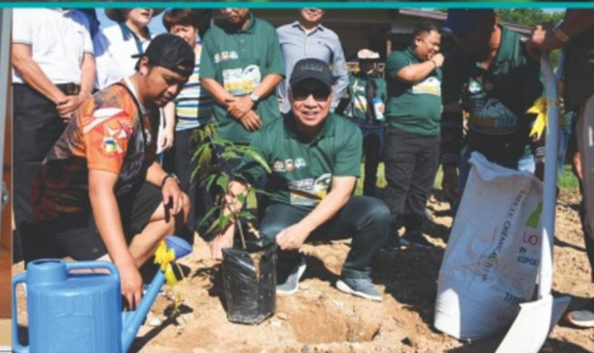
DBKK DAN KOMUNITI, WE TEAM UP!