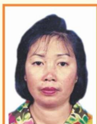
POININ BTE LUUK