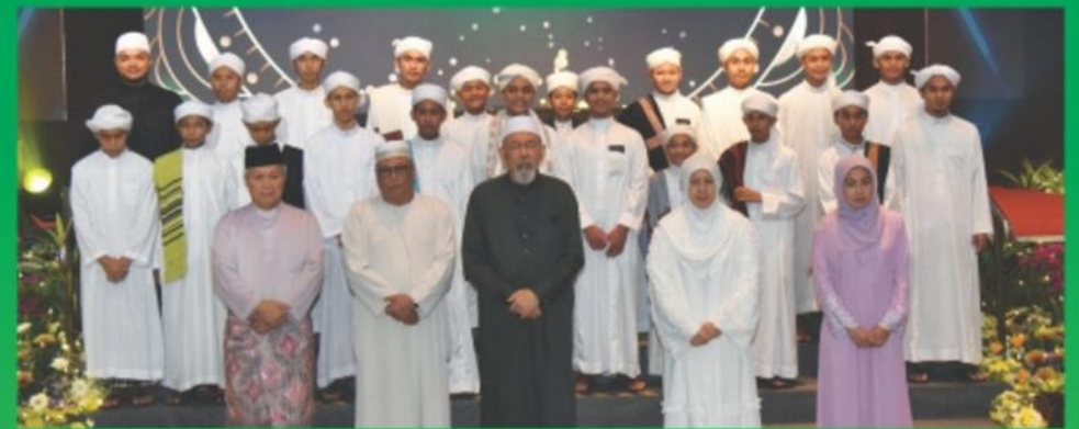
▲ Tuan Yang Terutama Tun Datuk Seri Panglima (Dr.) Haji Juhar bin Datuk Haji Mahiruddin menyampaikan sumbangan kepada 20 pelajar dari Madrasah Al Tahfiz Al Quran Nahdatul Ilmiah.