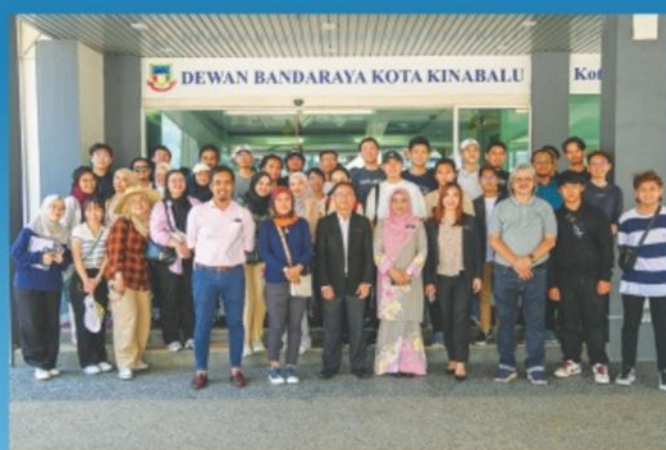
▲ 18 April 2024: Lawatan Sambil Belajar Pusat Pengajian Perumahan, Bangunan dan Perancangan, Universiti Sains Malaysia (USM).