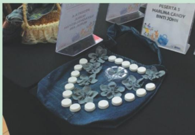
▲ Beg kain ini adalah hasil Upcycling Pakaian Terpakai.