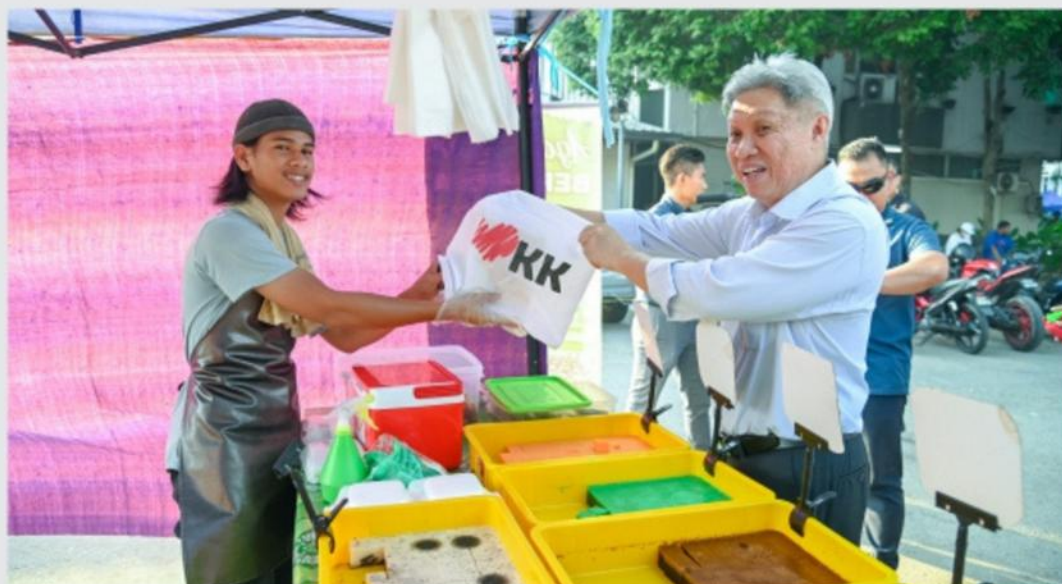
▲ Kunjungan Mesra Mayor Ke Bazar Ramadan Lintasan Deasoka Pada 18 Mac 2024.

Yang Berbahagia Dato' Sri Dr. Haji Sabin bin Samitah, JP , Mayor Bandaraya Kota Kinabalu telah meluangkan masa berkunjung mesra ke Bazar Ramadan Lintasan Deasoka pada 18 Mac 2024 dan Bazar Ramadan Pasar Tani Asia City pada 04 April 2024. Beliau yang turut diiringi kumpulan Pengurusan Tinggi DBKK telah meluangkan masa beramah mesra dengan para peniaga dan pengunjung, sambil menyampaikan beg eko yang mengandungi risalah kesihatan seperti 5 Panduan Makanan Selamat dan Hapuskan Lipas, Lalat, Tikus kepada 173 penjaja di Bazar Ramadan Lintasan Deasoka dan 93 penjaja di Bazar Ramadan Pasar Tani Asia City. Dalam masa sama, beliau turut meninjau keteraturan bazar sambil melihat kerancangan aktiviti jual beli yang menawarkan pelbagai juadah berbuka puasa.