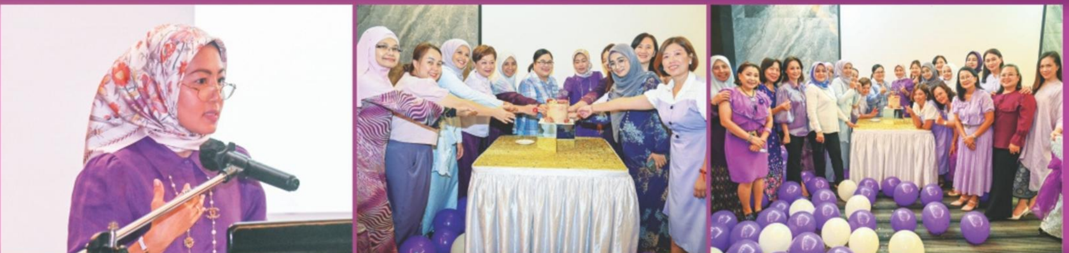
Hotel Horizon, Kota Kinabalu