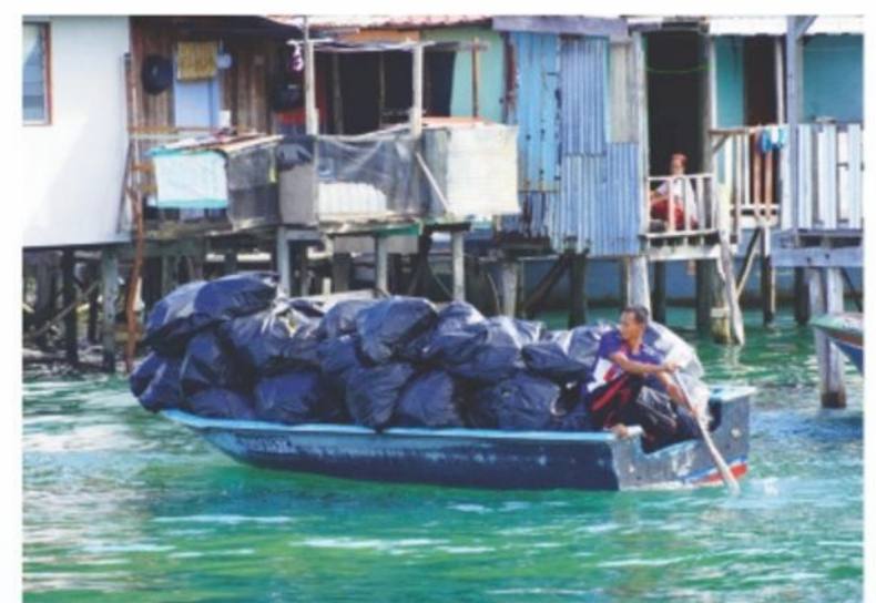
▲ Salah seorang penduduk kampung sedang memunggah sampah sarap dari Pulau Gaya ke jeti.

Antara kampung yang terlibat semasa program “KK Cleanup Day 2.0: Pulau Gaya dan Pulau Sepanggar” ini ialah Kampung Lok Urai, Kampung Kasuapan, Kampung Lobong, Kampung Pulau Gaya Asli dan Kampung Torong Logong di Pulau Gaya serta Kampung Pulau Sepanggar di Pulau Sepanggar.