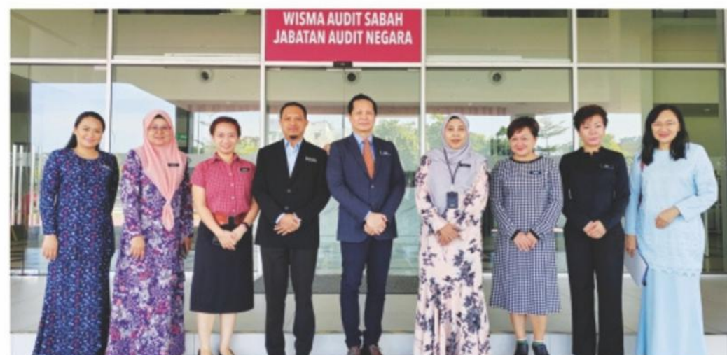
▲ Gambar bersama delegasi DBKK dan Pengarah Audit, Timbalan Pengarah Audit dan Pegawai-pegawai Jabatan Audit Negara Negeri Sabah.

Bahagian Audit Dalam berterima kasih atas kesempatan yang diberikan semasa berkunjung ke Jabatan Audit Negara Negeri Sabah dengan sambutan yang baik dan positif. Semoga kerjasama ini dapat kekal diteruskan untuk jalinan padu di bawah rumpun Malaysia Madani dan dalam sektor Kerajaan.