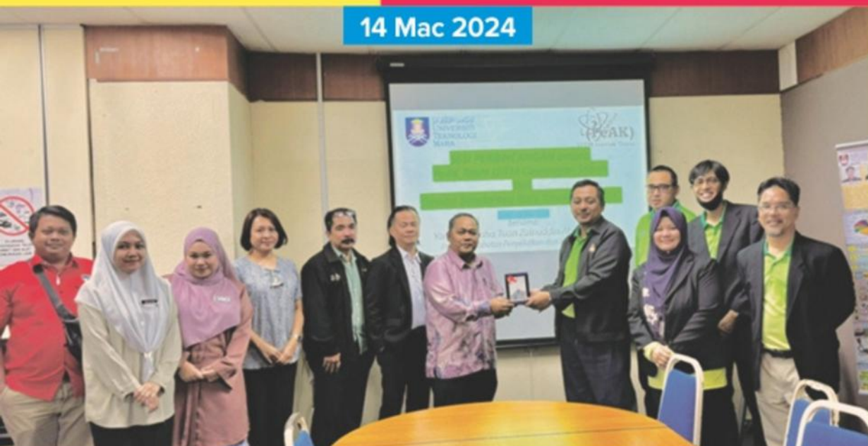
Perbincangan berhubung Projek Inovasi Kumpulan PEAK UiTM: Projek Penjana Elektrik Air Kumbahan.