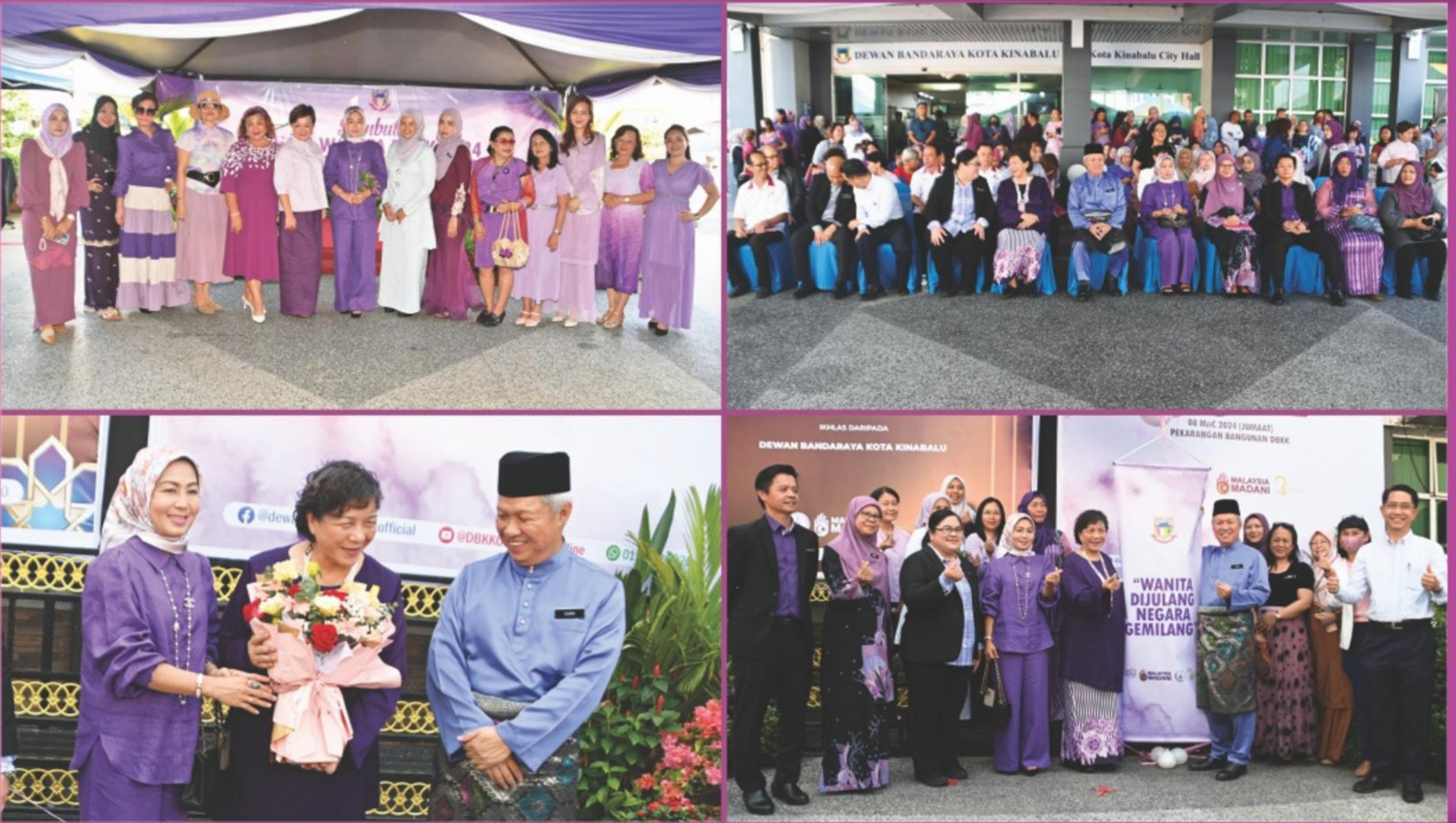
Pekarangan Bangunan DBKK