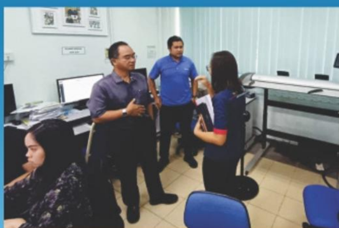
▲ 26 Mac 2024: Lawatan Kerja Jabatan Penilaian, Majlis Daerah Penampang.

Terima kasih Majlis Bandaraya Miri! "Iboh lupak mbak balit kuih penjaram. Panjang umo kita jumpa gik".