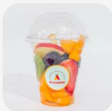
MIX DE FRUTAS VARIADAS