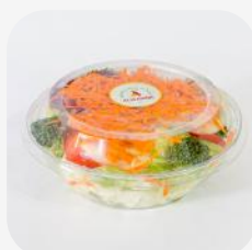
MIX DE ENSALADA DE VERDURAS