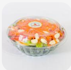
MIX DE ENSALADA DE VERDURAS II