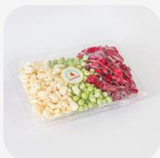
MIX DE ENSALADA RUSA