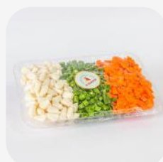
MIX DE ENSALADA RUSA II