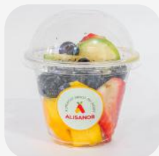
MIX DE FRUTOS ROJOS