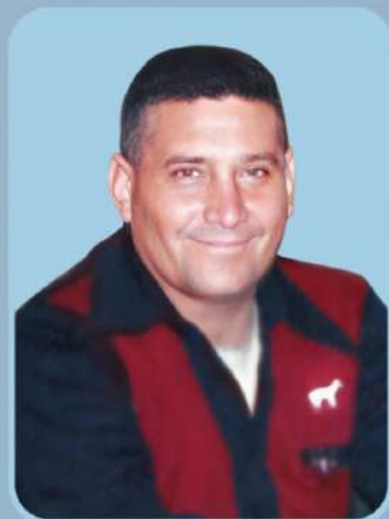
ALFA Y OMEGA, ENVIADO DEL DIVINO PADRE ETERNO, AUTOR DE LA CIENCIA CELESTE

Glorificad, a este hijo; que siendo humilde es grande ante vuestro divino Padre; tan grande, como para darle la divina telepatía; con cuyo divino Conocimiento, unificará al mundo; creando el sueño más inmenso; que han soñado millones de mis hijos humildes: El Gobierno Universal y Patriarcal; gobernando el de más sabiduría; el más perfecto modelo, a que haya llegado criatura alguna, en la interpretación de mi divina Palabra.-