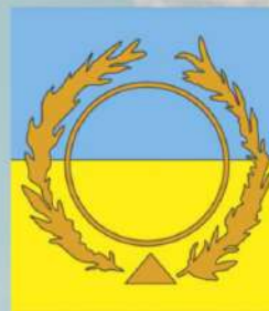
Divina bandera del milenio de paz