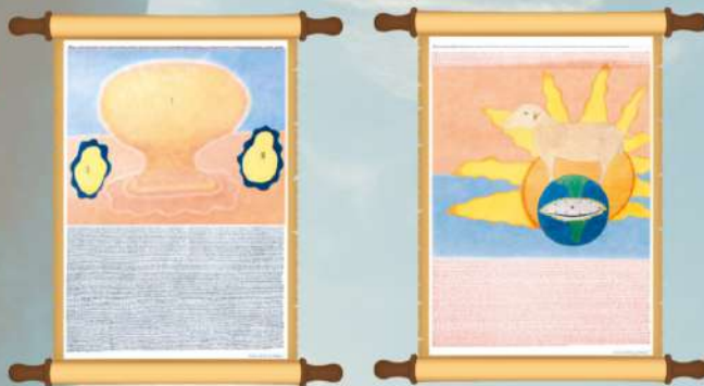
LOS ROLLOS DEL CORDERO DE DIOS ( apocalipsis 5)