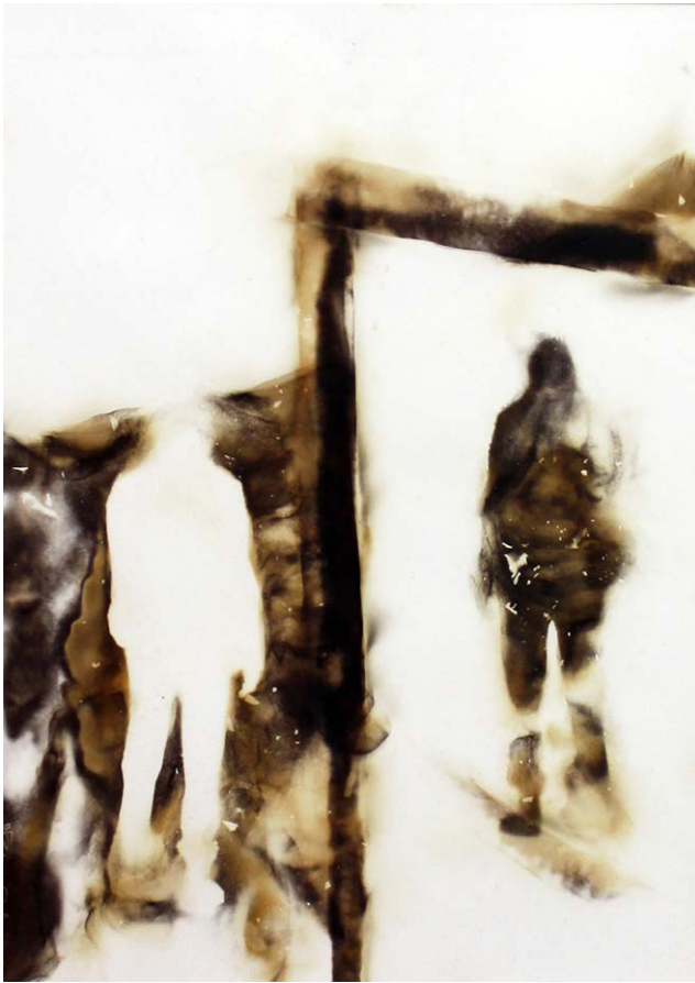
ΚΑΘΡΕΦΤΗΣ IIIII Φωτιά σε χαρτί MIRROR IIIII Fire on paper 37x30 cm - 2021