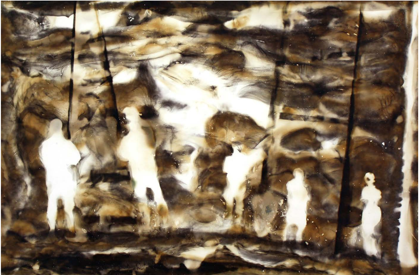
ΔΙΑΔΡΟΜΗ Φωτιά σε χαρτί ROUTE Fire on paper 38x48 cm - 2021