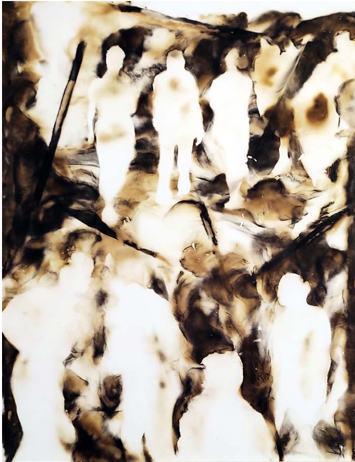
ΑΠΟΧΑΙΡΕΤΙΣΜΟΣ Φωτιά σε χαρτί FAREWELL Fire on paper 45,5x38 cm - 2021