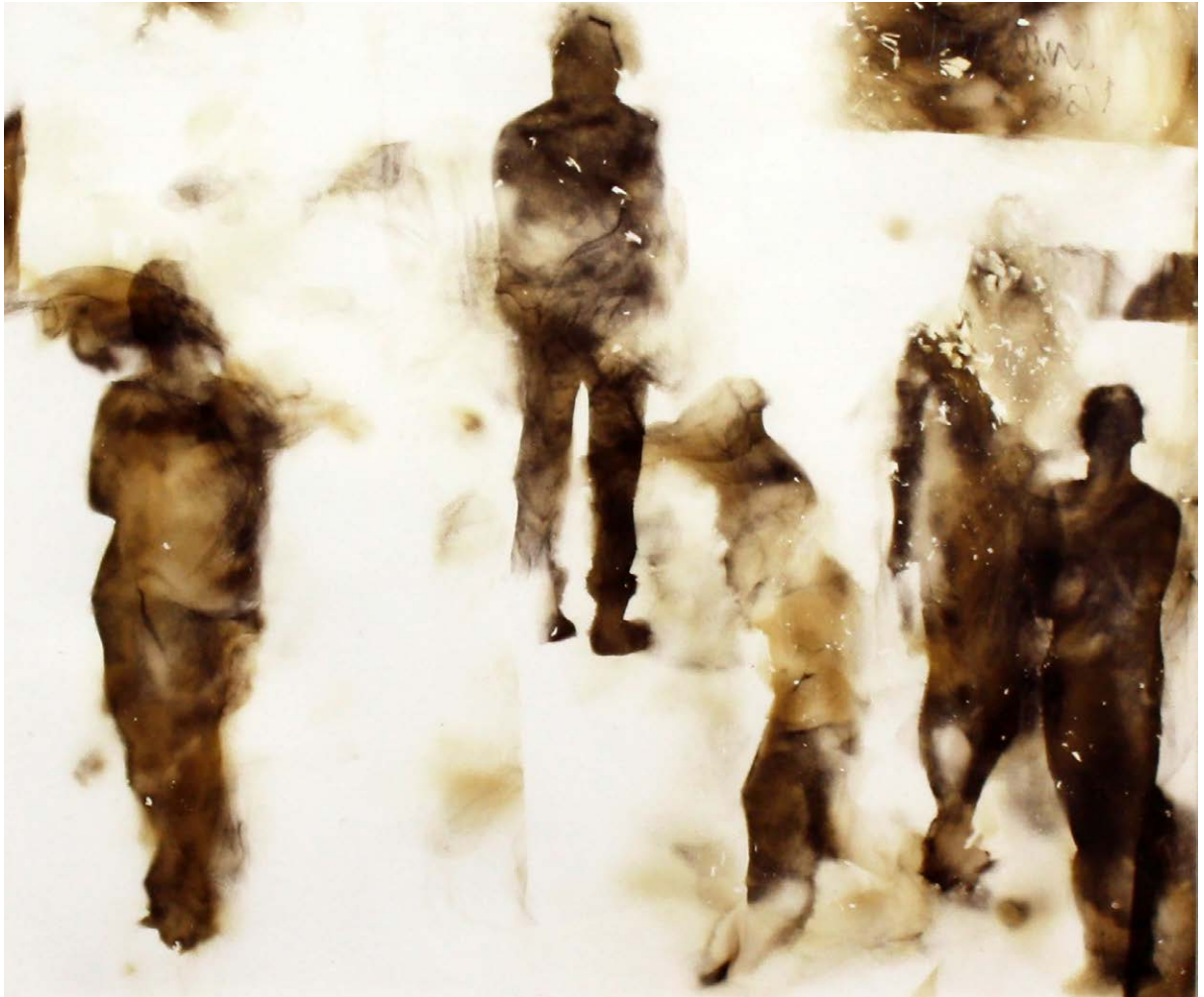
ΜΝΗΜΕΣ 7 Φωτιά σε χαρτί MEMORIES 7 Fire on paper 34x35 cm - 2021