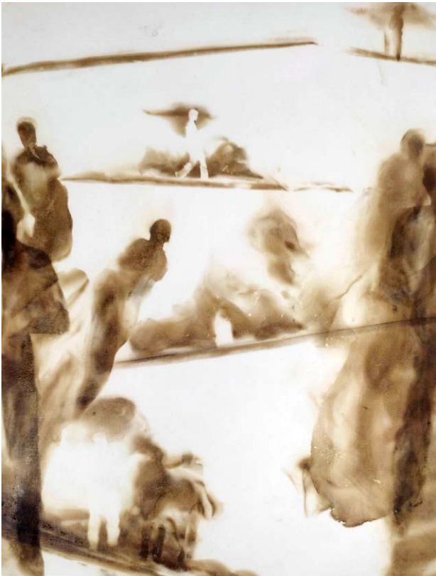
ΔΙΑΔΡΟΜΕΣ II Φωτιά σε χαρτί ROUTES II Fire on paper 43x33 cm - 2023