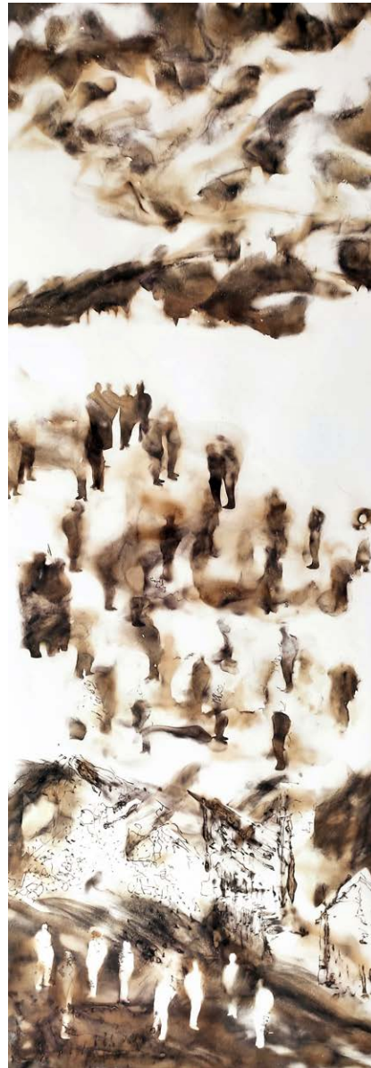
ΑΓΝΩΣΤΟ ΑΥΡΙΟ I Φωτιά σε χαρτί UNCERTAIN FUTURE I Fire on paper 70x28 cm - 2023