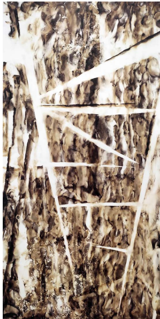
ΣΚΑΛΑ I Φωτιά σε χαρτί STAIRCASE I Fire on paper 70x36 cm - 2021