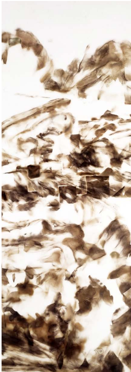
ΑΓΝΩΣΤΟ ΑΥΡΙΟ III Φωτιά σε χαρτί UNCERTAIN FUTURE III Fire on paper 79x31 cm - 2022