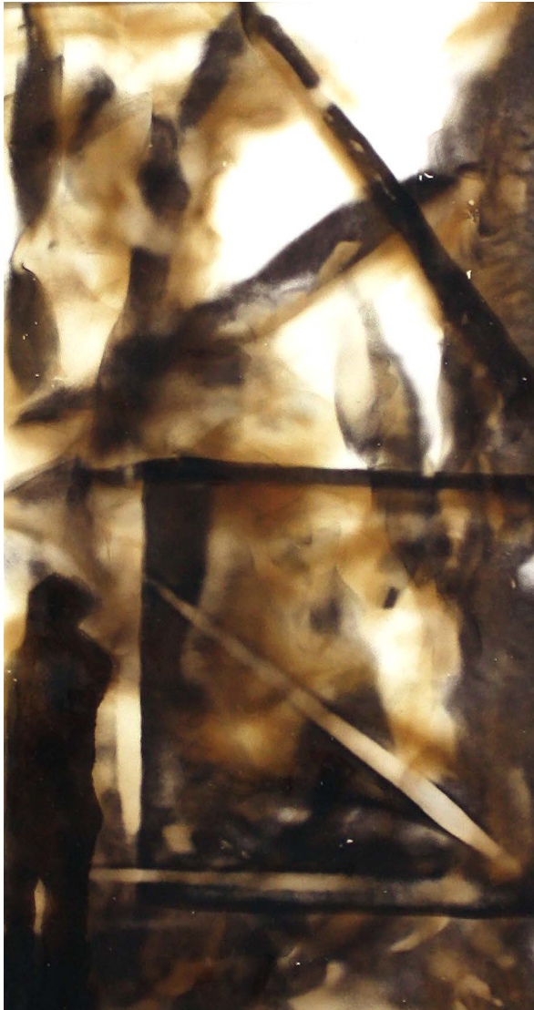
ΜΝΗΜΕΣ 2 Φωτιά σε χαρτί MEMORIES 2 Fire on paper 33x24 cm - 2021