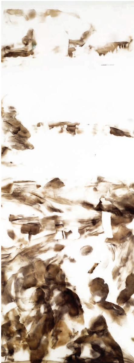
ΑΓΝΩΣΤΟ ΑΥΡΙΟ IIIII Φωτιά σε χαρτί UNCERTAIN FUTURE IIIII Fire on paper 79x31 cm - 2022