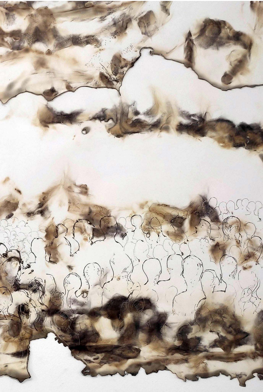
ΟΛΑ ΑΛΛΑΖΟΥΝ Φωτιά σε χαρτί EVERYTHING CHANGES Fire on paper 71x132 cm - 2023