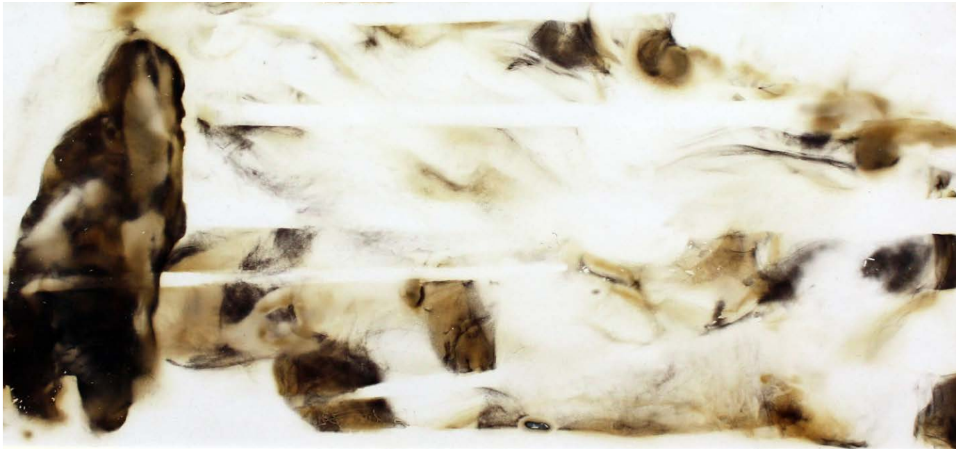
ΔΙΑΔΡΟΜΗ III Φωτιά σε χαρτί ROUTE III Fire on paper 29x42 cm - 2021