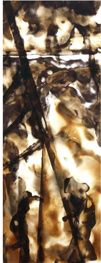
ΔΙΑΔΡΟΜΗ II Φωτιά σε χαρτί ROUTE II Fire on paper 52x30 cm - 2021