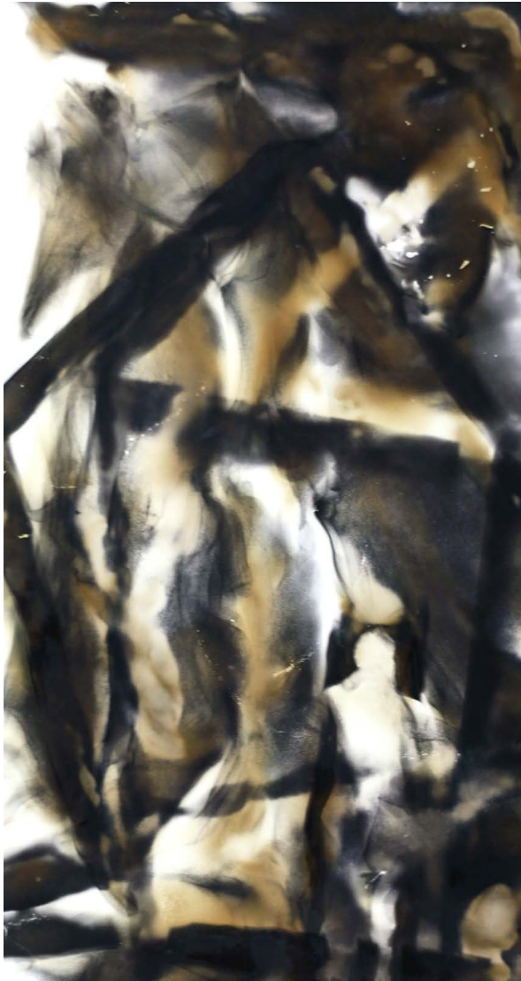
ΜΝΗΜΕΣ 4 Φωτιά σε χαρτί MEMORIES 4 Fire on paper 37x26 cm - 2021