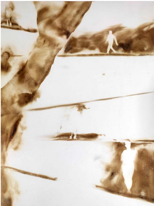
ΔΙΑΔΡΟΜΕΣ I Φωτιά σε χαρτί ROUTES I Fire on paper 43x33 cm - 2023