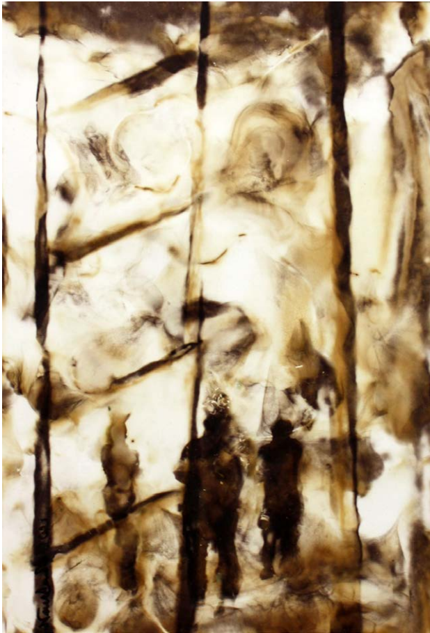
ΑΠΟΧΑΙΡΕΤΙΣΜΟΣ II Φωτιά σε χαρτί FAREWELL II Fire on paper 42x34 cm - 2021