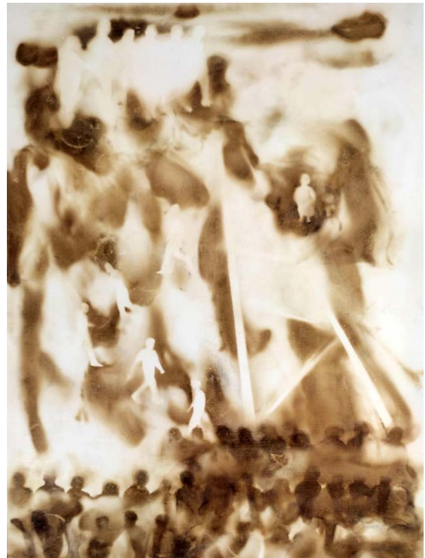
ΚΟΜΜΑΤΙ ΤΟΥ ΧΘΕΣ II Φωτιά σε χαρτί FRAGMENT OF THE PAST II Fire on paper 43x33 cm - 2023