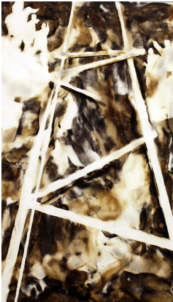
ΣΚΑΛΑ III Φωτιά σε χαρτί STAIRCASE III Fire on paper 51x37 cm - 2021