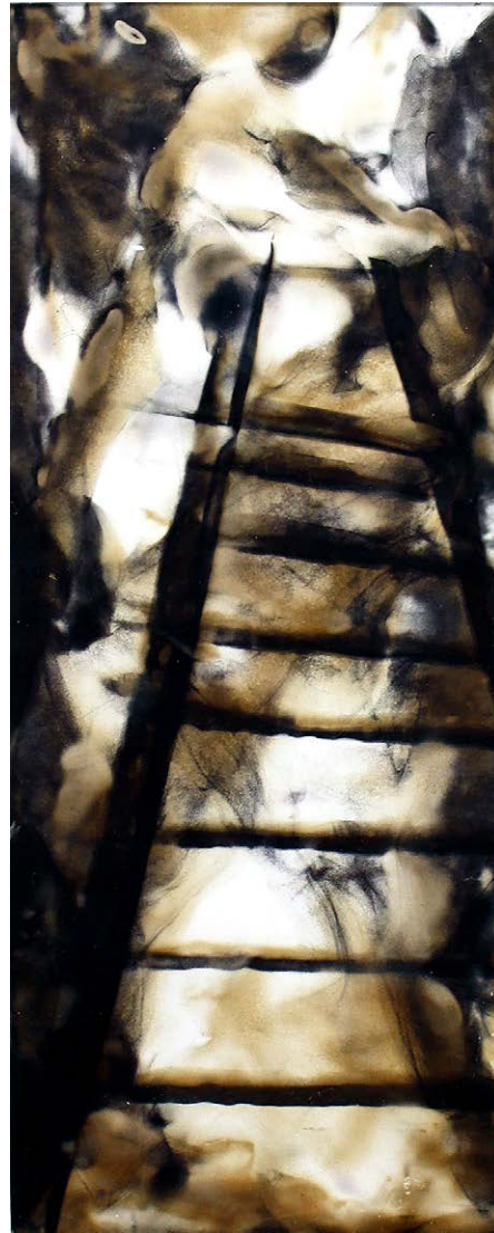
ΣΚΑΛΑ Φωτιά σε χαρτί STAIRCASE Fire on paper 42x26 cm - 2021