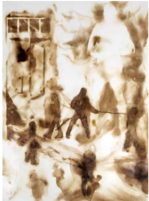
ΚΟΜΜΑΤΙ ΤΟΥ ΧΘΕΣ I Φωτιά σε χαρτί FRAGMENT OF THE PAST I Fire on paper 43x33 cm - 2023