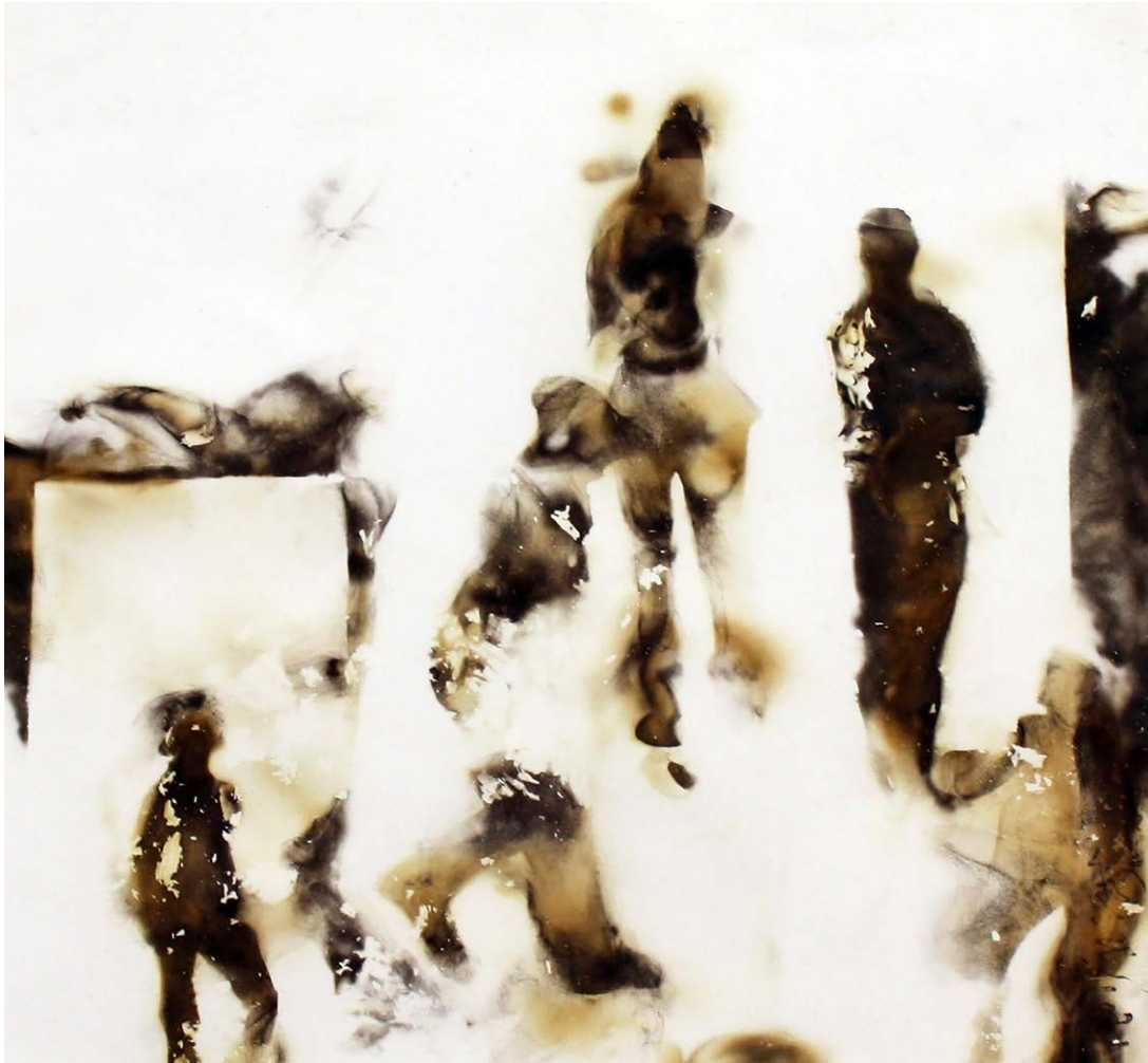
ΜΝΗΜΕΣ 5 Φωτιά σε χαρτί MEMORIES 5 Fire on paper 34x35 cm - 2021