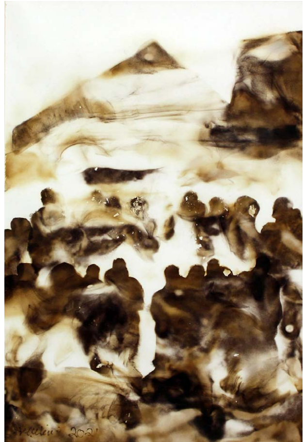
ΜΝΗΜΕΙΟ Φωτιά σε χαρτί MONUMENT Fire on paper 39x31 cm - 2021