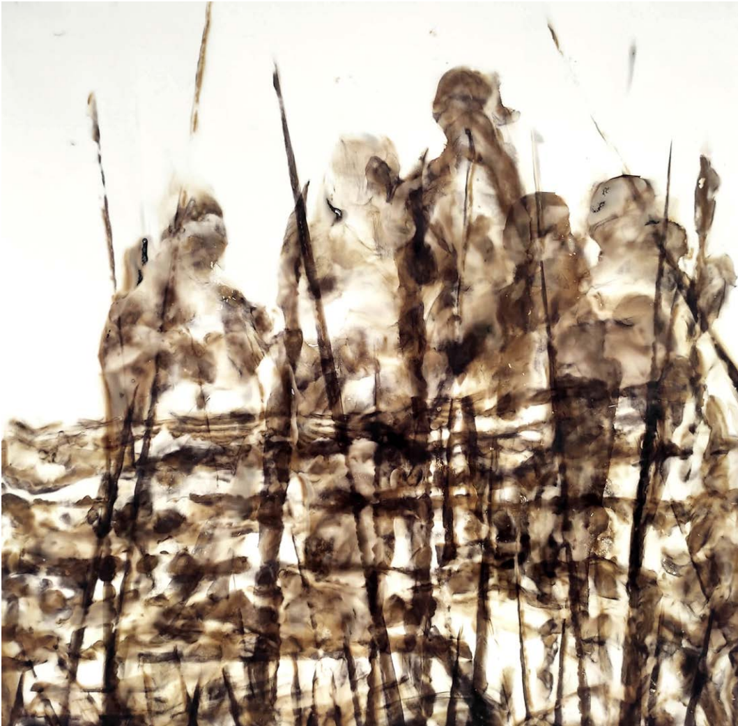
ΠΕΡΑ ΑΠΟ ΤΟΝ ΦΡΑΧΤΗ Φωτιά σε χαρτί BEYOND THE FENCE Fire on paper 63x65 cm - 2021