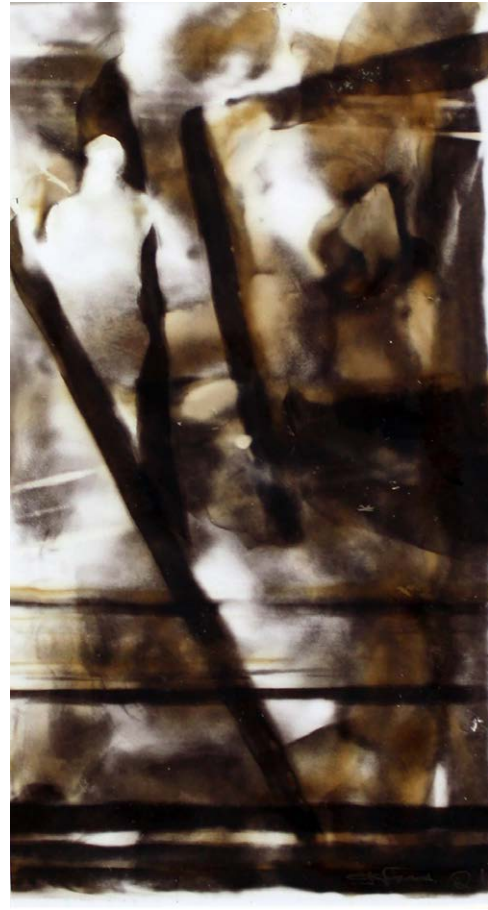
ΜΝΗΜΕΣ 1 Φωτιά σε χαρτί MEMORIES 1 Fire on paper 33x24.5 cm - 2021