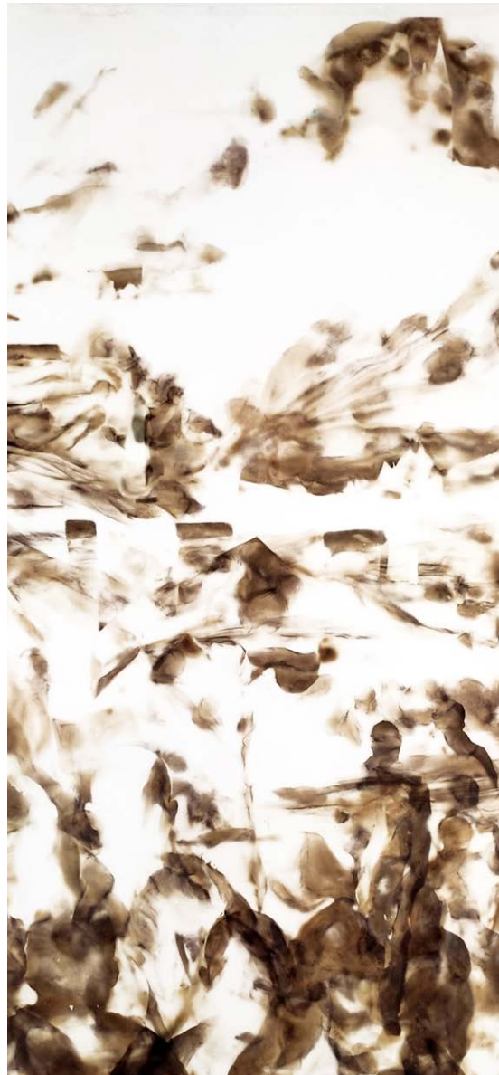
ΑΓΝΩΣΤΟ ΑΥΡΙΟ II Φωτιά σε χαρτί UNCERTAIN FUTURE II Fire on paper 80x39 cm - 2022