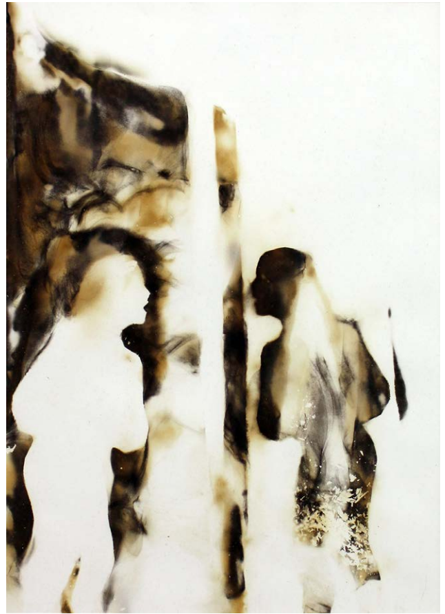
ΚΑΘΡΕΦΤΗΣ ΙΙΙΙΙΙ Φωτιά σε χαρτί MIRROR ΙΙΙΙΙΙ Fire on paper 42x33 cm - 2021