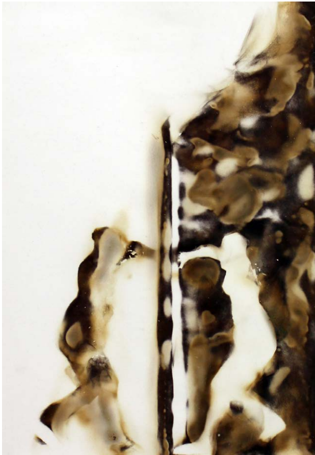
ΚΑΘΡΕΦΤΗΣ ΙΙΙΙ Φωτιά σε χαρτί MIRROR ΙΙΙΙ Fire on paper 30x28 cm - 2021