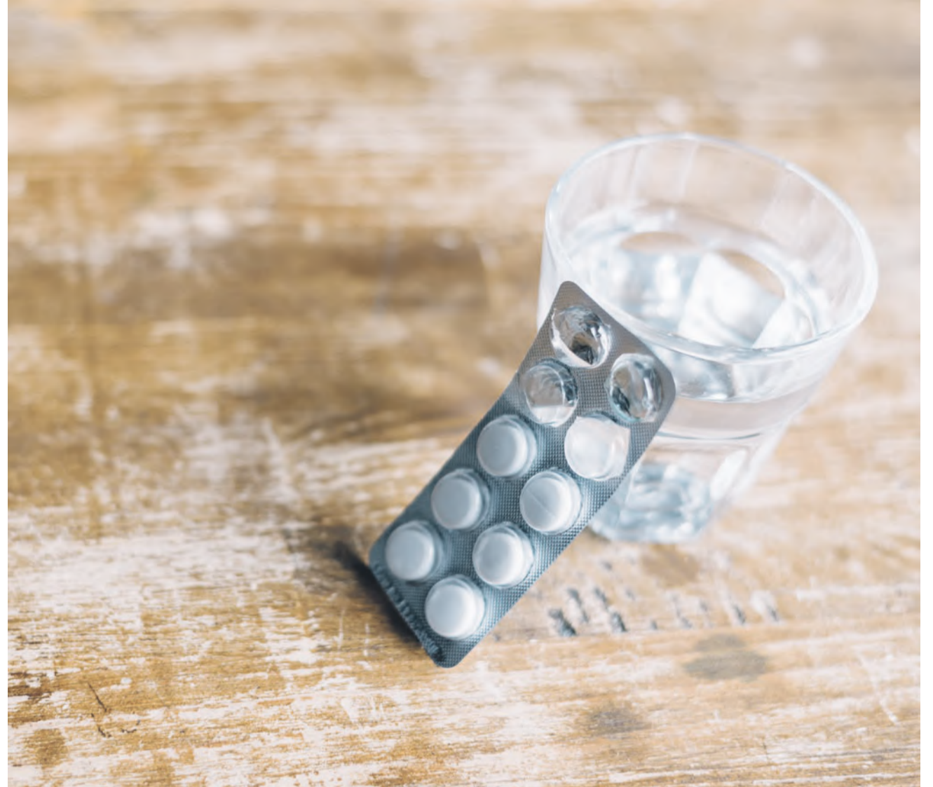
Zweimal 400 mg sind nicht gleich 800 mg. Eine doppelte Dosis lindert Schmerzen nicht besser.

Hier liegt das grösste Missverständnis. Ärztinnen und Ärzte verschreiben die hohen 800er-Dosen nicht primär gegen den akuten Schmerz, sondern wegen der entzündungshemmenden Komponente. Während die Schmerzstillung früh stagniert, nimmt die Wirkung gegen Entzündungen bei höherer Dosierung weiter zu.