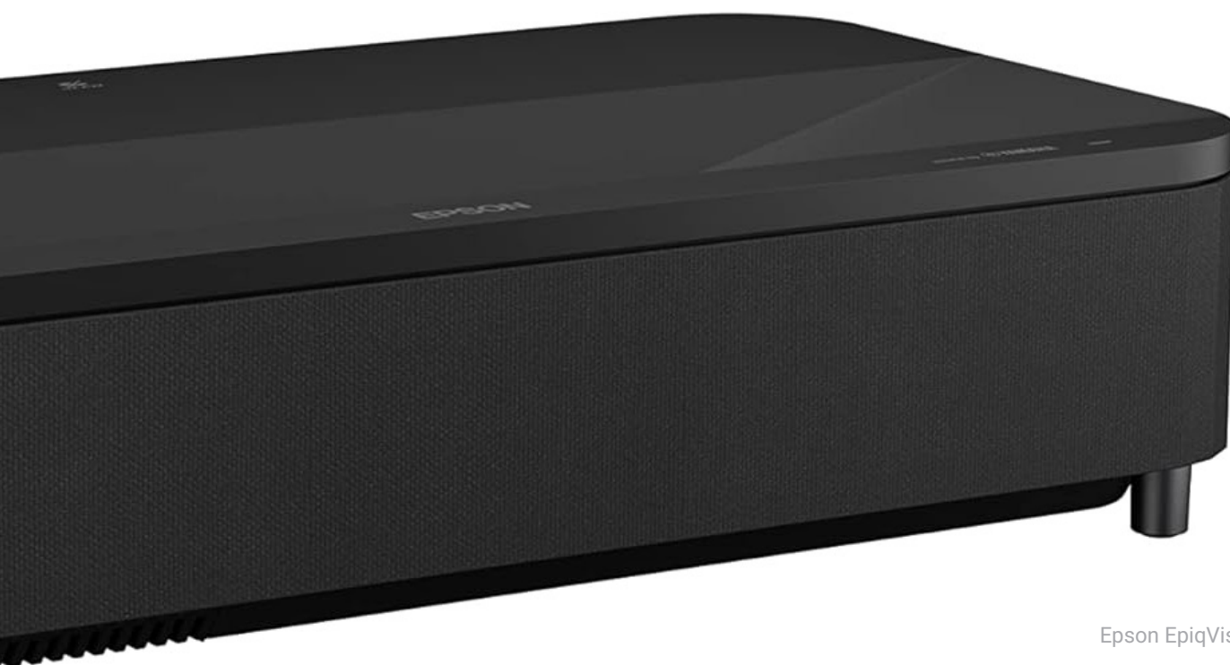
Epson EpiqVision LS800.

En Air te esperamos para proyectar tus negocios Epson.