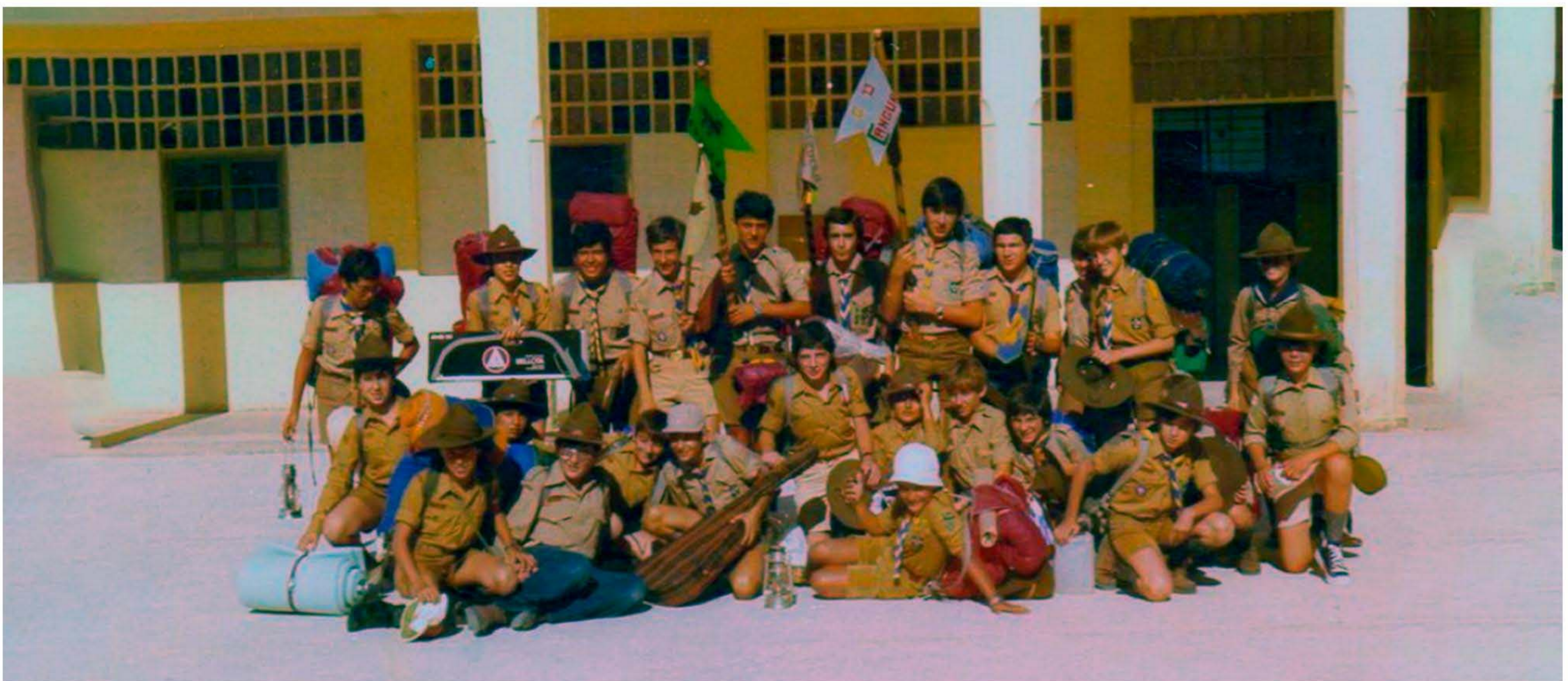
Campamento de verano de tropa. Julio del 75'