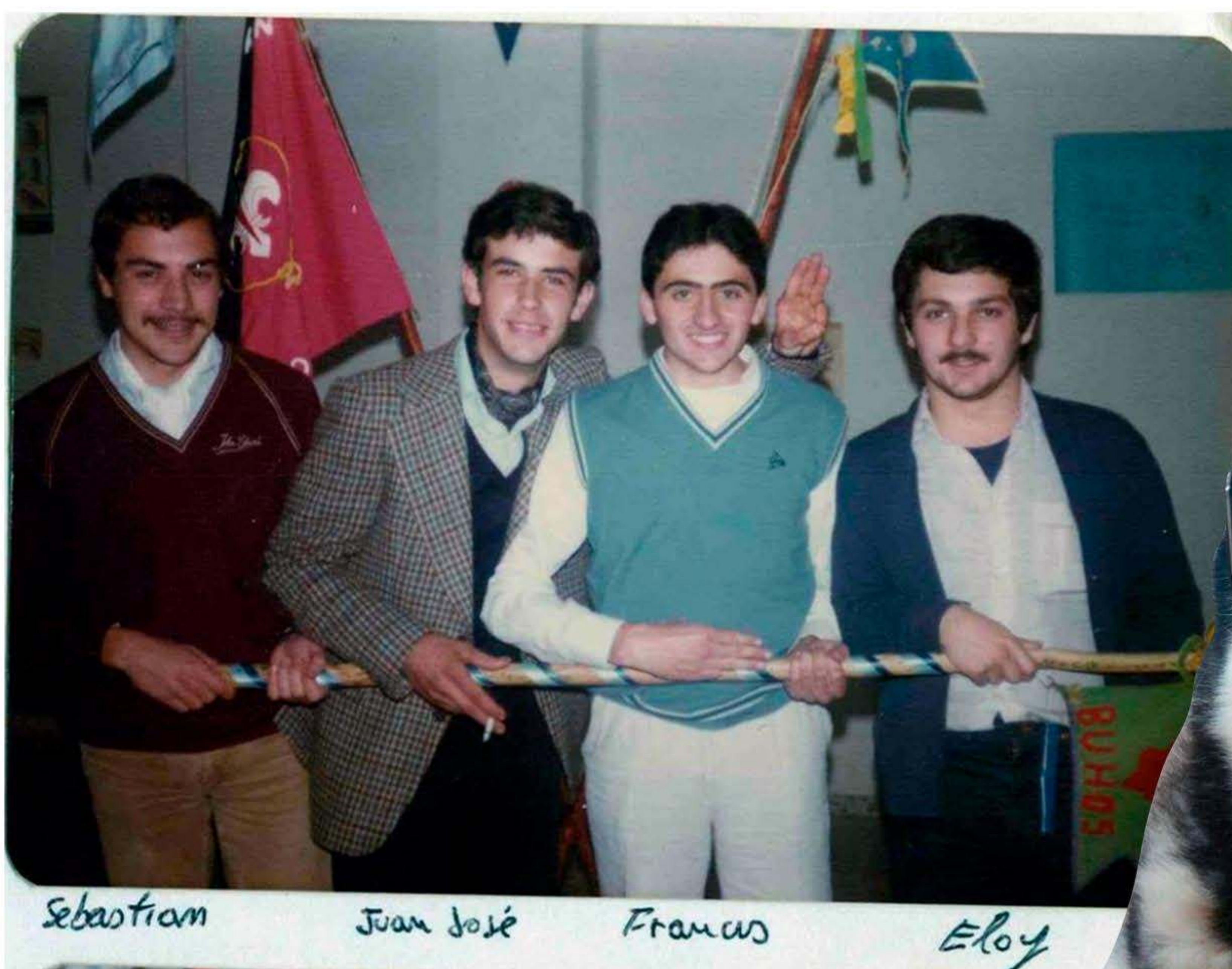
La patrulla Búho en uno de sus reencuentros en 1982 y los actuales perros asilvestrados.

Durante todo ese campamento y algunos más cuando escuchábamos ladrar un perro se nos erizaban los pelos de todo el cuerpo. Y esa historia de los perros asilvestrados nos acompañó durante muchos años en los fuegos de campamento y en las conversaciones de madrugada en las tiendas de campaña por las noches, aunque sin fuegos artificiales, claro.