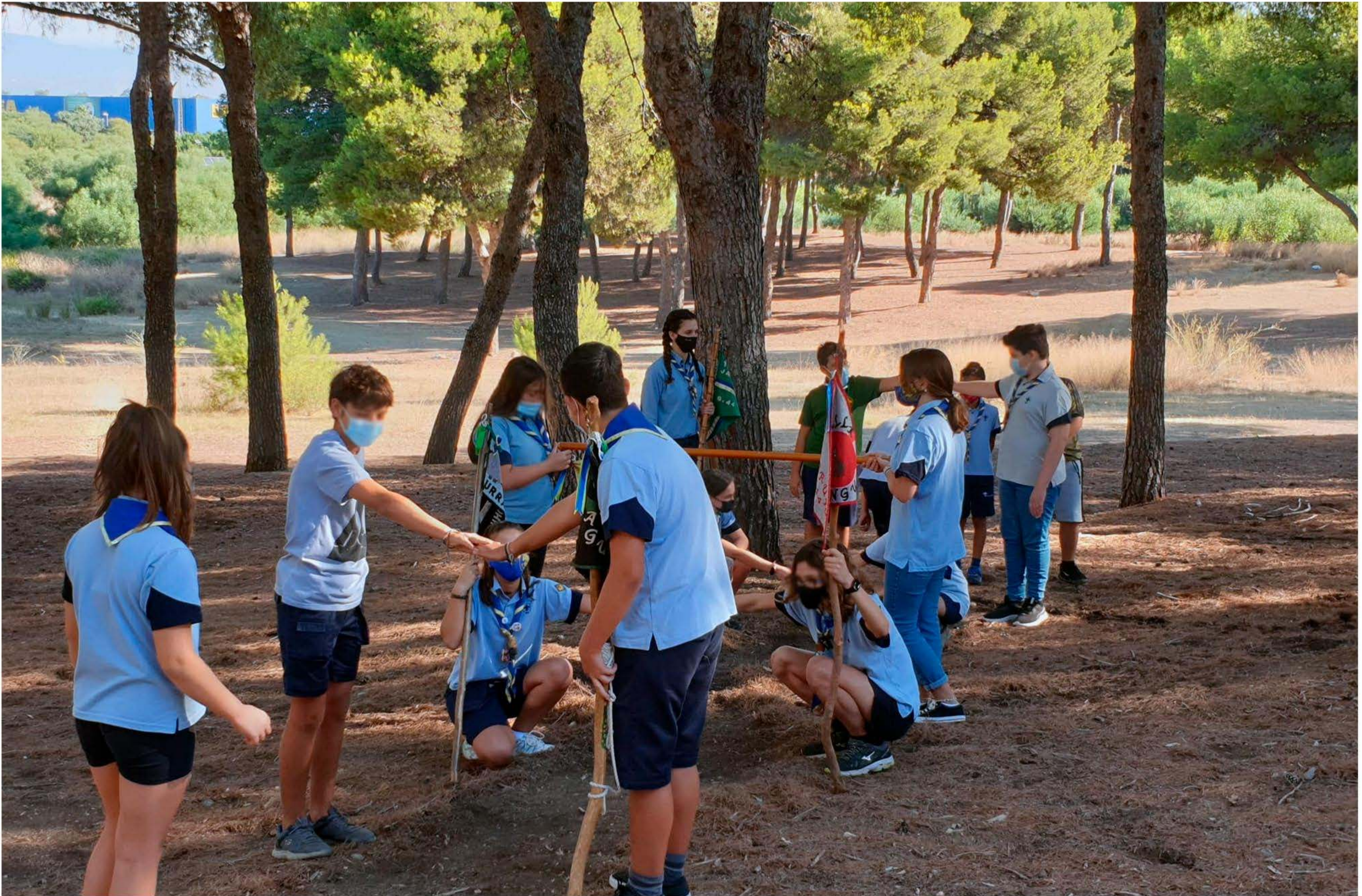
Pase de secciones 2021-22

Este año la tropa Jábega comienza dando la bienvenida a los lobatos que finalizaron su etapa de manada. La salida de la jungla hacia el poblado de los hombres no fue tarea fácil, ¡tuvieron que superar un sinuoso camino lleno de obstáculos!