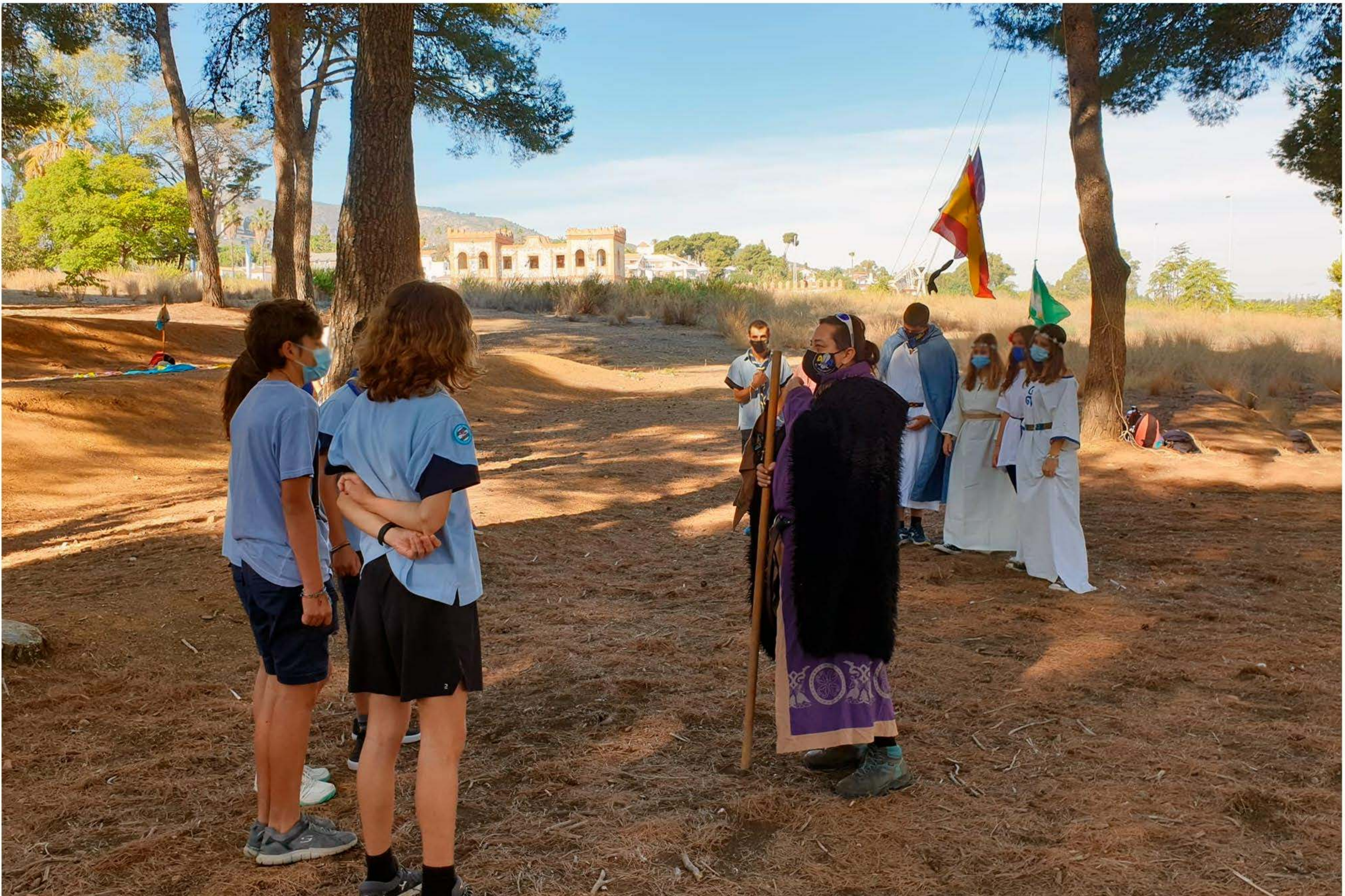
Pase de secciones 2021-22

Un año más la Unidad abre sus brazos para dejar entrar a un@s experimentad@s guías de patrulla que continúan su andadura scout ya fuera de la Tropa.