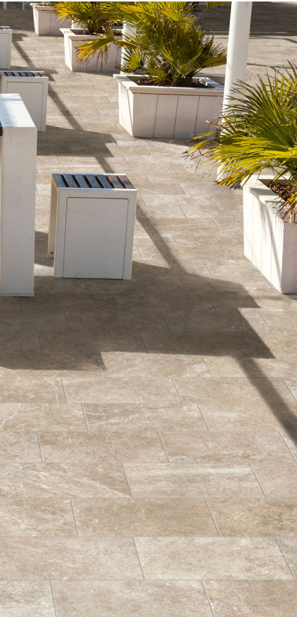
Sabbia Nat. 20x40 - 77/8" x 15 3 / 4 "