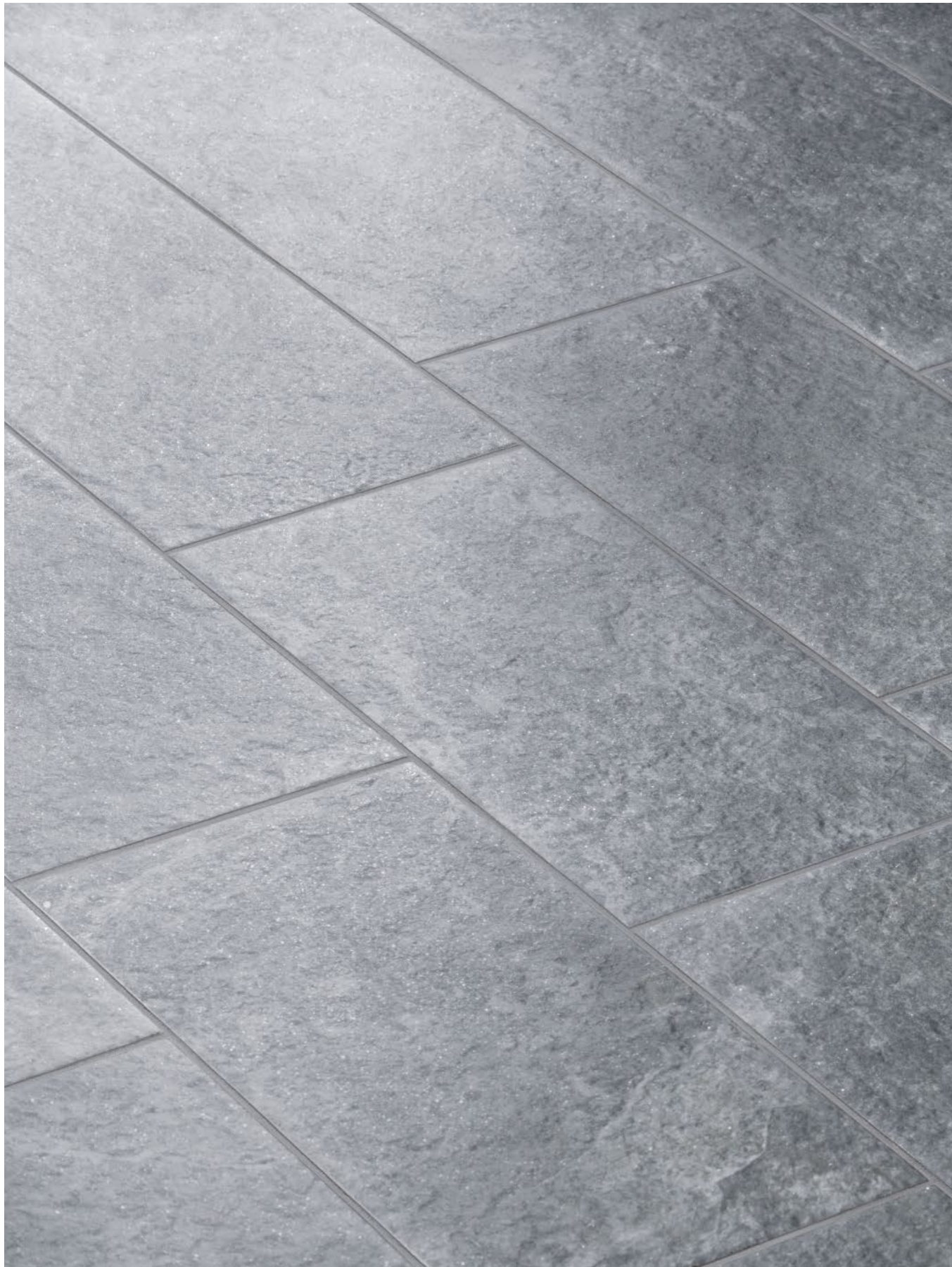
Grigio Nat. 20x40 - 7 7 / 8 " x 15 3 / 4 "