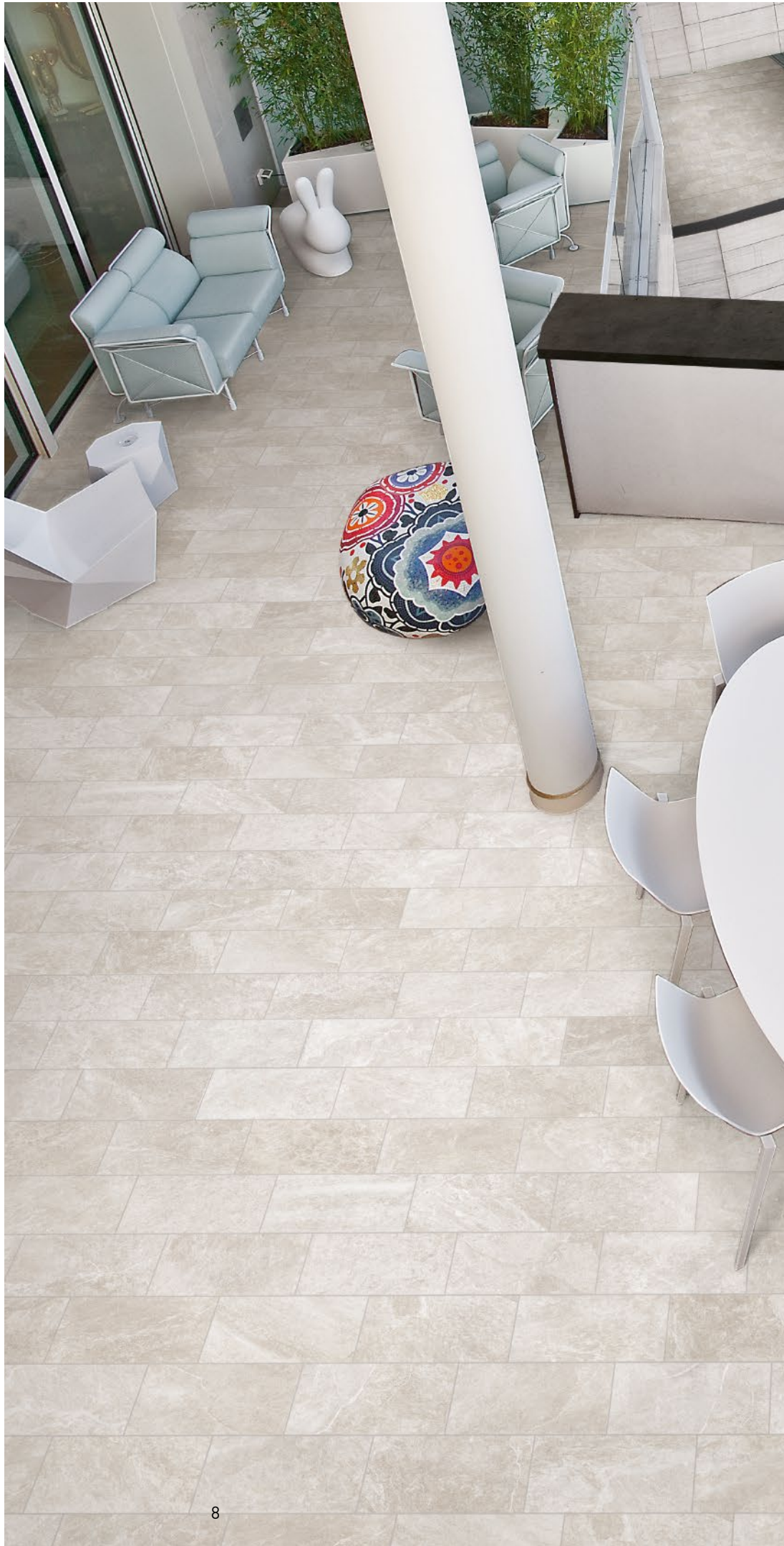
Avorio Nat. 20x40 - 77/8" x 15 3 / 4 "