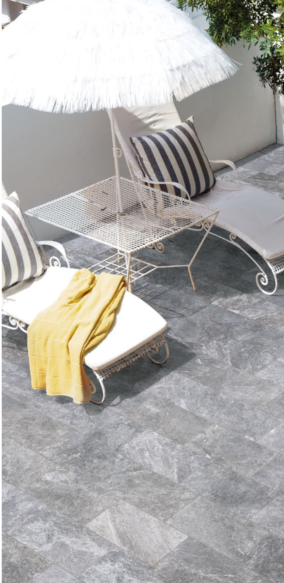
Grigio Nat. 20x40 - 7 7/8 " x 15 3/4 "