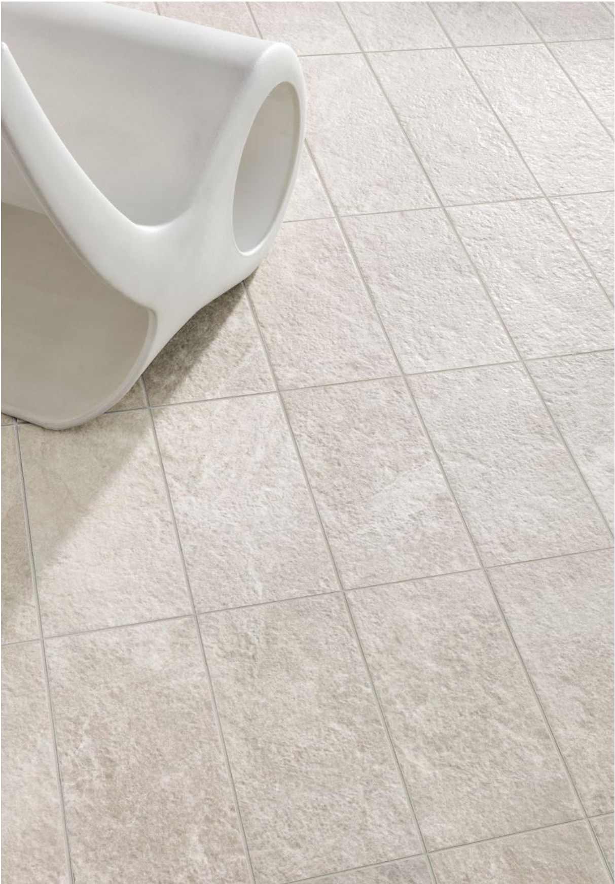
Avorio Nat. 20x40 - 7 7/8 "x15 3/4 "