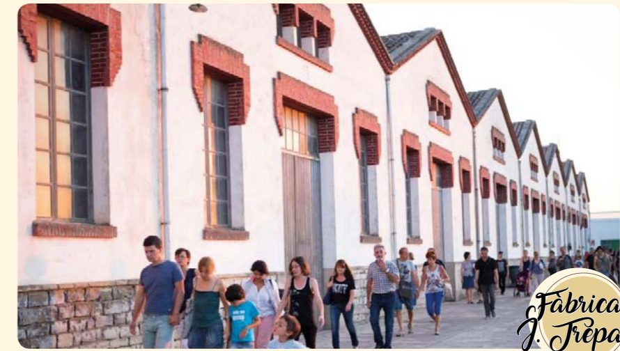
Fàbrica J. Trepal

THE MAIN STREET welcomes THE URGELL REGIONAL MUSEUM, which is located in Cal Perelló. This building preserves the Noble Rooms of the XVIII and XIX centuries. You can visit the archaeo-