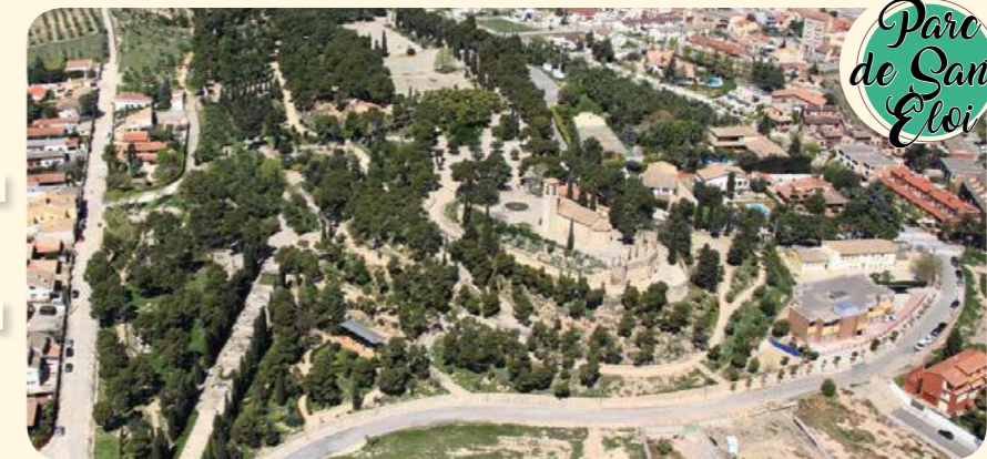
Parc de Sant Eloi

THE SANT ELOI MOUNTAIN RANGE, with the hermitage dedicated to the saint and surrounded by a magnificent park, stands in a privileged place where you can see a magnificent view of the city.