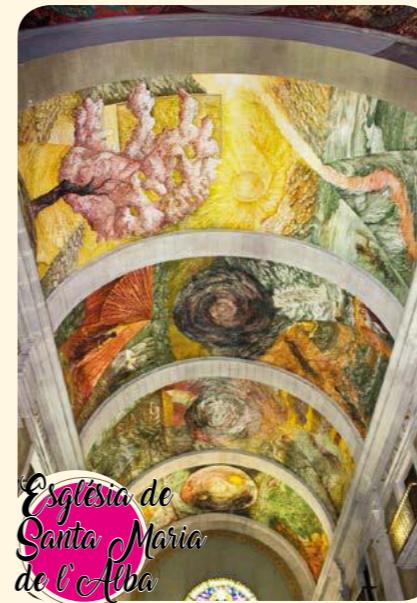
Església de Santa Maria de l'Alba

THE MAIN SQUARE hosts the City Hall, the Commerce Chamber modernist building and Santa Maria del Alba church with classicist baroque lines gives beauty to the square. The floor has a main nave with side chapels, cupola and dome base, and has the beauty of the