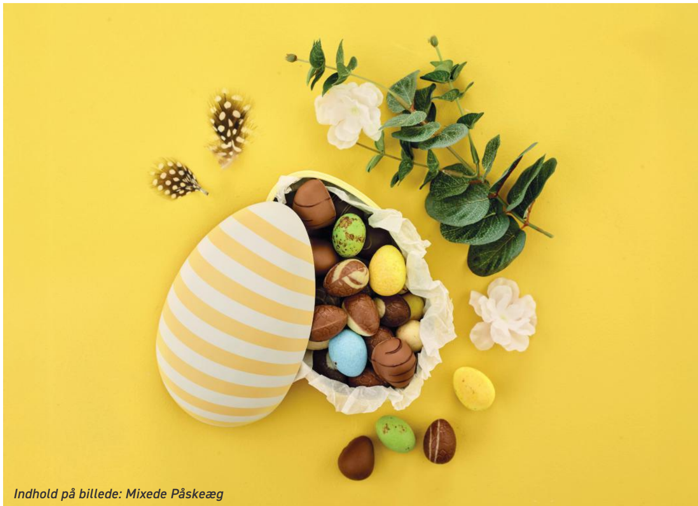
Indhold på billede: Mixede Påskeæg

Produktmål: L: 15,5 cm x B: 10,5 cm x H: 9,8 cm