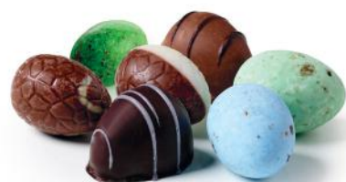
Mixede Påskeæg (Marcipanæg, Belgiske fugleæg, Luksusæg og Gourmetæg)