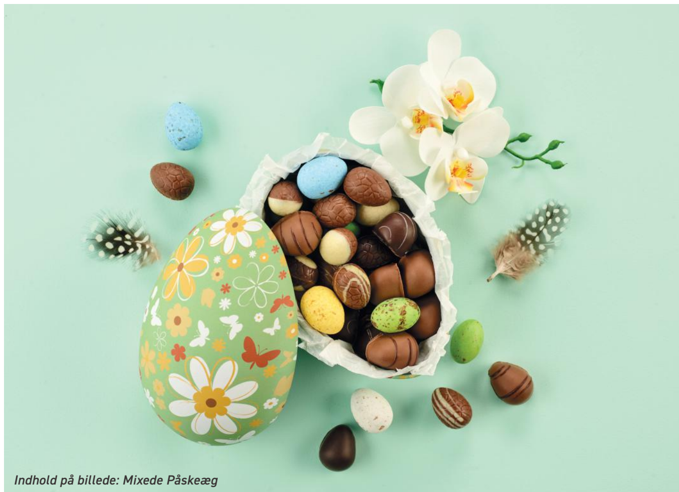
Indhold på billede: Mixede Påskeæg

Produktmål: L: 15,5 cm x B: 10,5 cm x H: 9,8 cm