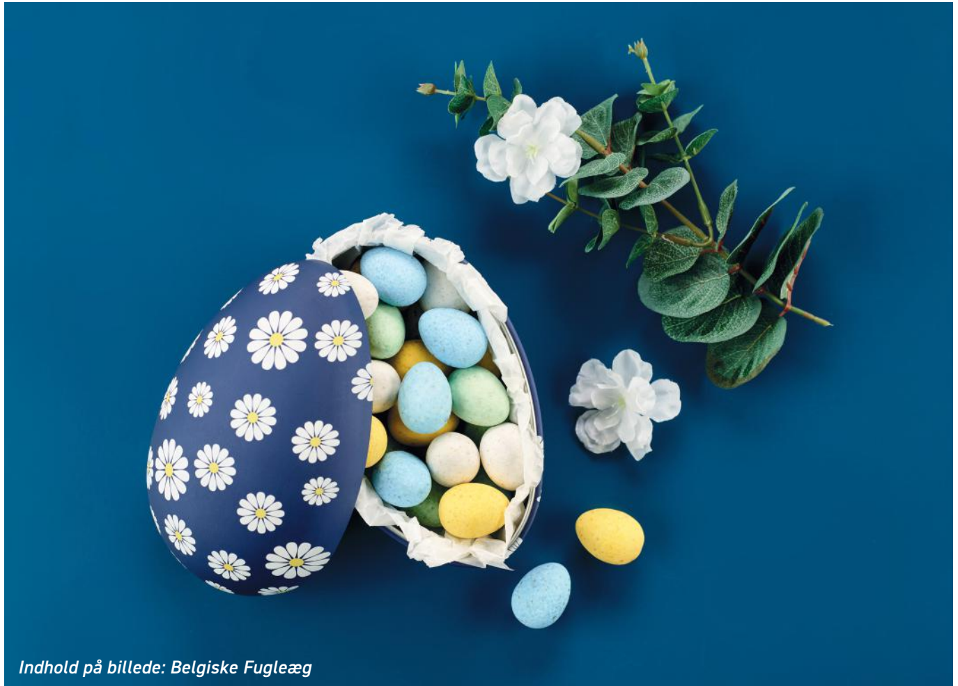
Indhold på billede: Belgiske Fugleæg

Produktmål: L: 15,5 cm x B: 10,5 cm x H: 9,8 cm