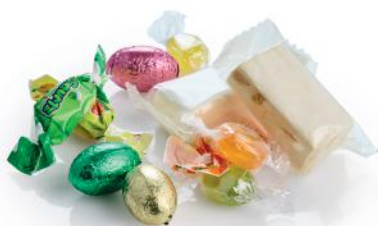
Påskeblanding (Chokolade, karameller, fransk nougat og bolcher)