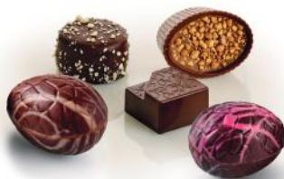
Luksus Chokolade & Luksusæg