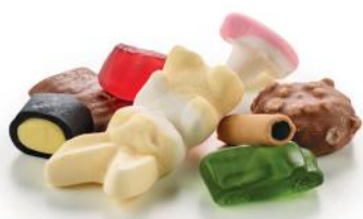
Familieblanding (Chokolade, påskeskum, lakrids, vingummi og dragée)