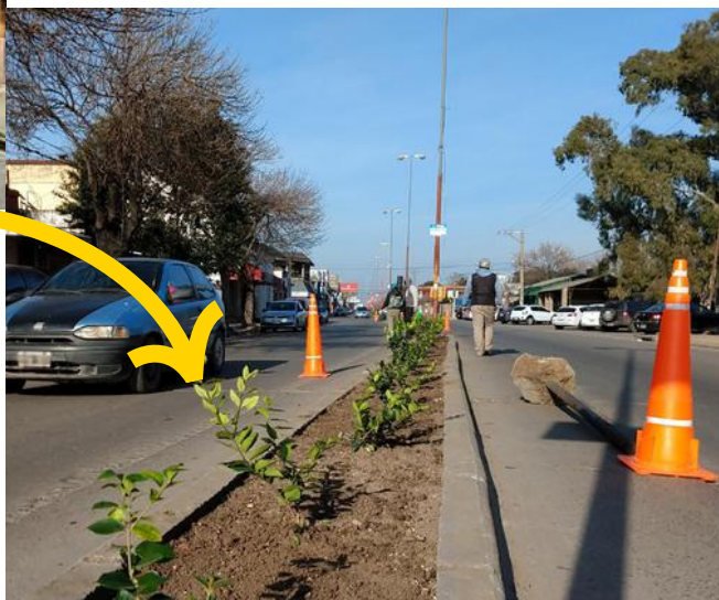
Plantas divisorias Av. Juan D. Peron

En una primer etapa se inicio con la compra y colocación de guirnaldas de luces led por Av. Mitre, continuando por Av. Filippini y Av. Juan Domingo Peron.