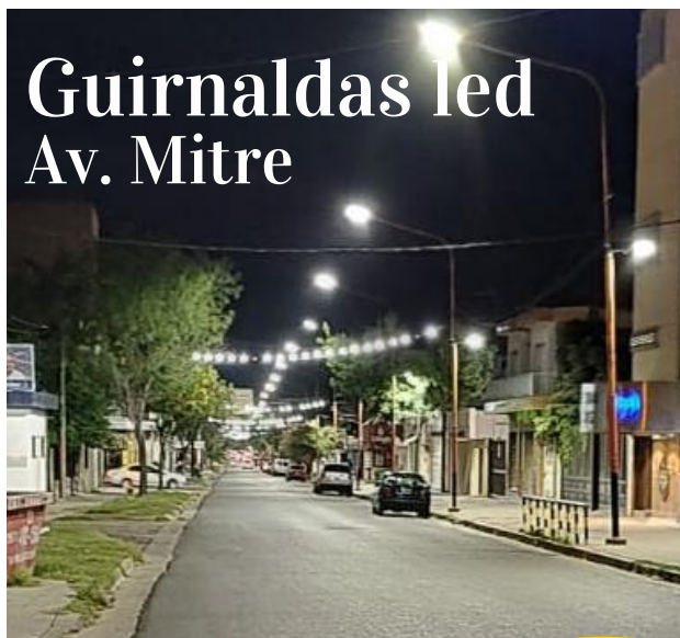
Guirnaldas led Av. Mitre

La Asociación de Comercio e Industria de Villa Gobernador Gálvez, continua trabajando para embellecer los distintos Centros Comerciales Abiertos de la ciudad.