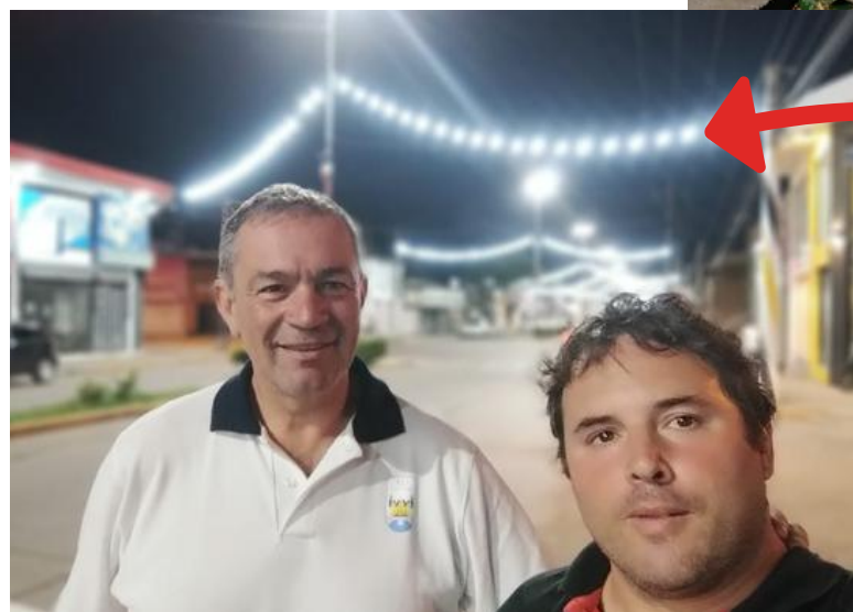
Guirnaldas led Av. Juan D. Peron