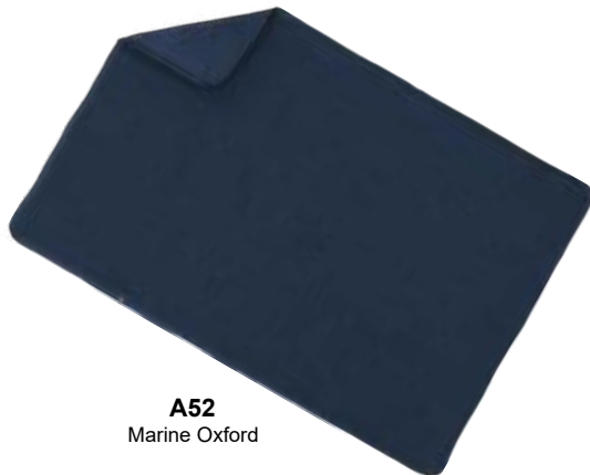
A52 Marine Oxford