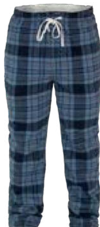
D42 Marineà carreaux