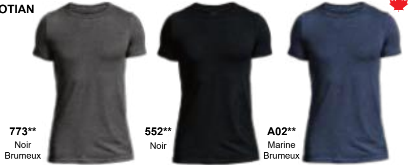
773** Noir Brumeux

FIN DE LIGNE : 31 MARS 2026 : 552, 773, A02 FIN DE LIGNE : 31 AOÛT 2026 : 427, 551