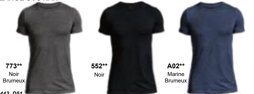
773** Noir Brumeux

DISPONIBLE LE 1ER AVRIL 2026 : 552, 773, A02 DISPONIBLE LE 1ER SEPTEMBRE 2026 : 427, 551, D50, D52, 442, D51