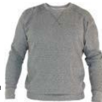
034 Oxford Noir