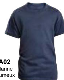
A02 Marine brumeux