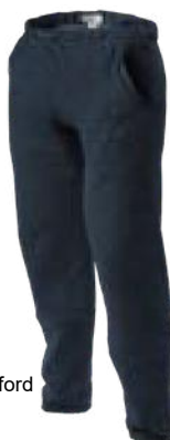
A52 Marine Oxford