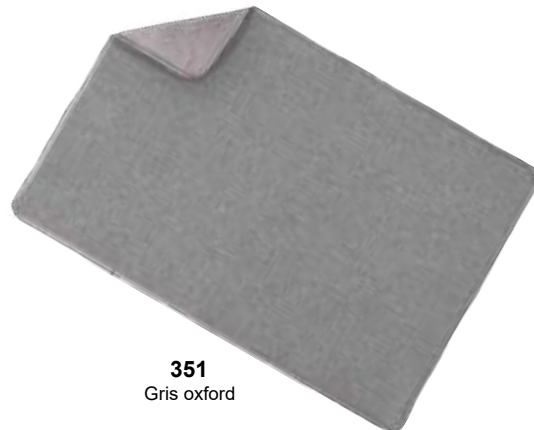
351 Gris oxford