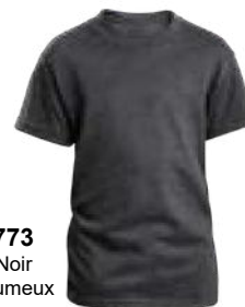
773 Noir Brumeux