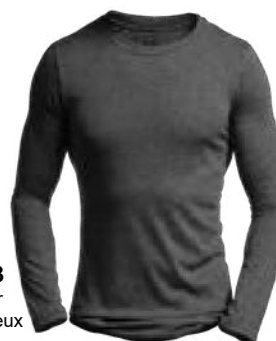
773 Noir Brumeux