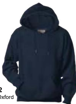
A52 Marine Oxford