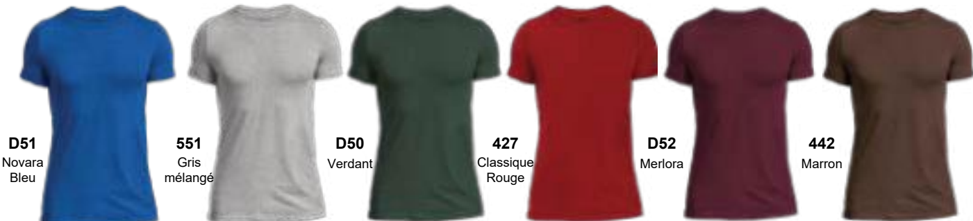
D51 Novara Bleu