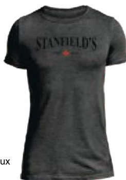
773 Noir Brumeux