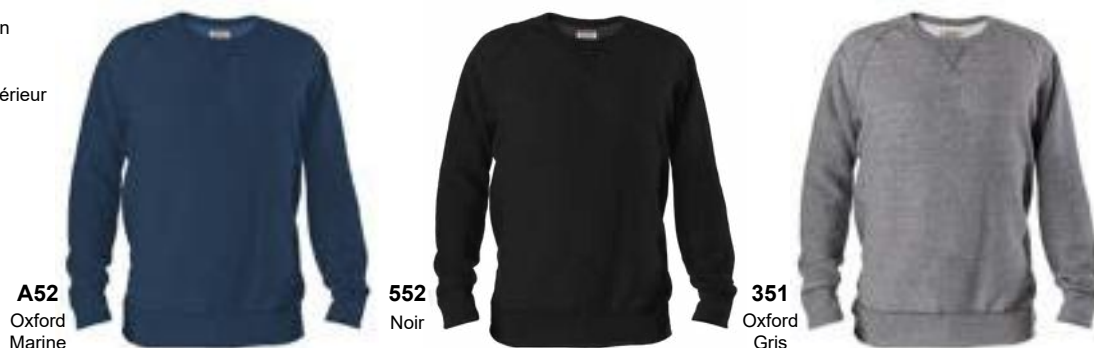
A52 Oxford Marine