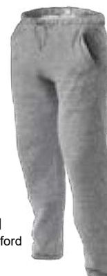
351 Gris oxford