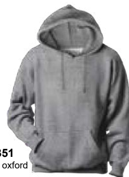
351 Gris oxford