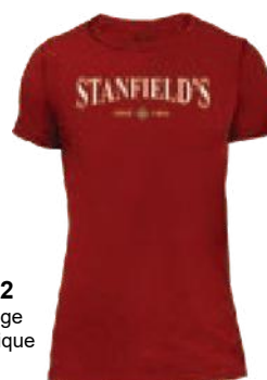
472 Rouge classique