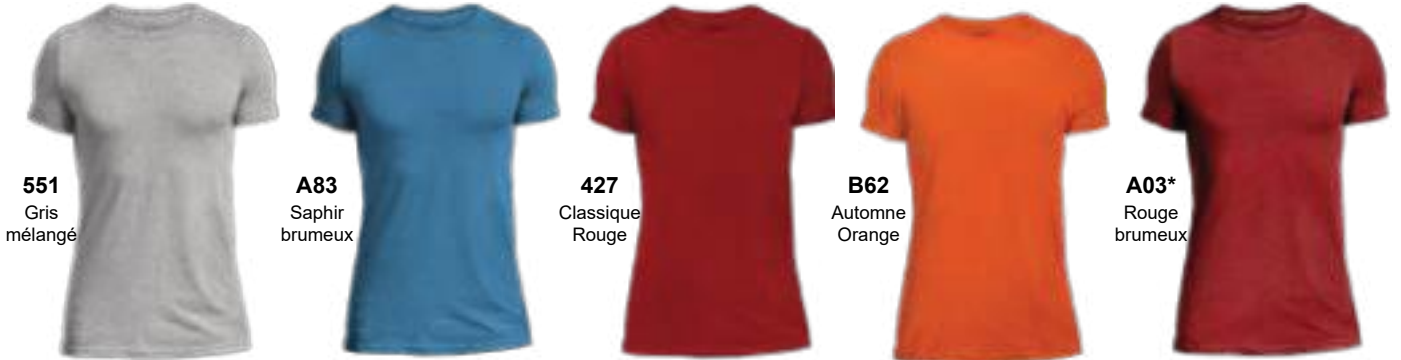
551 Gris mélangé