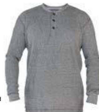
034 Oxford Noir