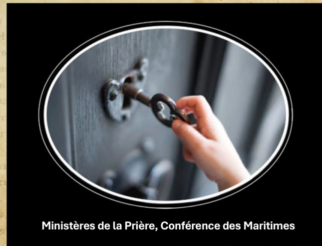
Ministères de la Prière, Conférence des Maritimes