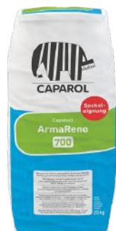
CAPAROL ARMARENO 700 FIBERPUSS HVIT 25 KG ART. NR: CA823133

I våre fasadepuss-system bruker vi fiberpuss med hvitsement og selvrensende slutt puss.