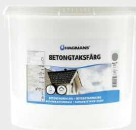
HAGMANS BETONGTAKMALING SORT 10L