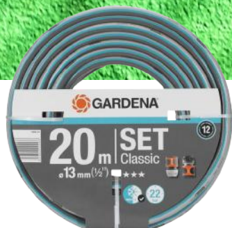
GARDENA SLANGE CLASSIC 1 1/2" 20M M/KOBLINGER ART. NR: OM47258237