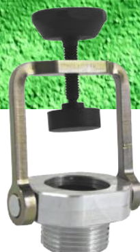
AQUAFIX ADAPTER FOR KRAN 3/4" ART. NR: I86214111