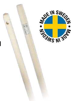
BJÄRNUMS KOSTESKAFT I TREVERK 1500x28MM ART. NR: B3221215