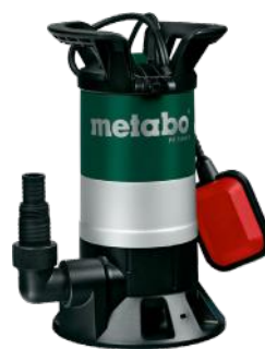
METABO PS 15000 S NEDSENKBAR SKITTENVANNSPUMPE ART. NR: M0251500000