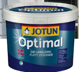
JOTUN OPTIMAL MALING 9L