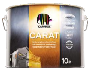
CAPAROL CARAT OLJEMALING 10L SPANN

DRYGOLIN fra Jotun har eksistert i godt og vel 60 år. 2 av 3 malte hus i Norge blir hvert år behandlet med DRYGOLIN. Når du velger en maling fra Jotun, kan du være trygg på at huset får den aller beste beskyttelsen.