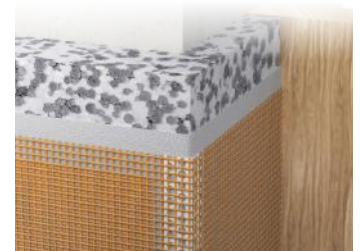
HJØRNEVINKEL 656/02 2,5M ORANGE NETTING PLAST ART. NR: CA69719

Vi har de ulike profilene og avslutningene som trengs for å få en pent resultat til fasadepuss jobbene.