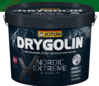
JOTUN DRYGOLIN NORDIC EXTREME 50 9L