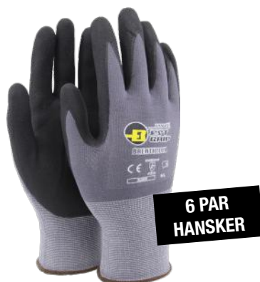
HANVO RIBBHANSKE BREATHTECH NYLON/NITRIL 10 ART. NR: STHV-NJ506-10

Myk genserjakke med glidelås laget for generelt byggearbeid på arbeidsplasser med krav om høy synlighet.