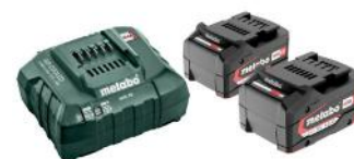
METABO BATTERIPAKKE 2X4,0 AH + LADER ART. NR: M68505000