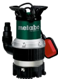
METABO TPS 14000 S COMBI KOMBI-SENKEPUMPE ART. NR: M0251400000