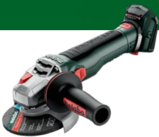
METABO VINKELSLIPER WB 18 LT BL 11-125 QUICK SOLO MB ART. NR: M613054840

MALING - RENGJØRING - ARBEIDSTØY - REDSKAP OG VERKTØY