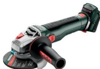
METABO VINKELSLIPER WB 18 LT BL 11-125 QUICK SOLO MB ART. NR: M613054840