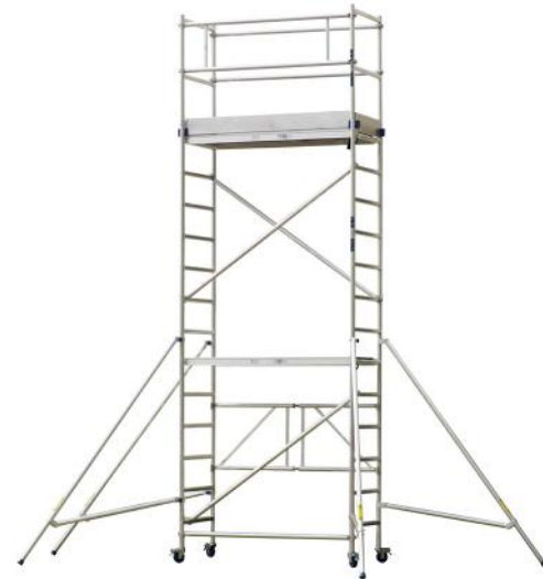
SKEPPSHULTSTEGEN RULLESTILLAS MODUL A+B+C ART. NR: SK282-A + SK282-B + SK282-C

KAMPANJEPRIS: 10 490,- GRUNNPRIS: 20 551,-