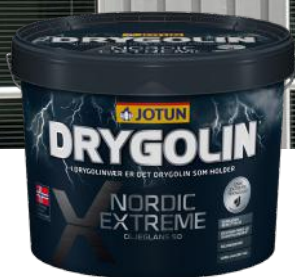
JOTUN DRYGOLIN NORDIC EXTREME 50 9L