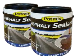
POTMIX ASPHALT SEALANT 2,5L/20L ART. NR: PX13002/ PX13025