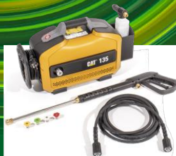
CAT HØYTRYKKSPLYLER 1800PSI/135 BAR ART. NR: CAT30721