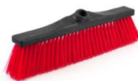
BJÄRNUMS FEIEKOST PLAST PROPËN 50CM ART. NR: B1031020