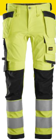
SNICKERS WORKWEAR BUKSE 6243 GUL/SORT HL 050 ART. NR: S62436604050

KAMPANJEPRIS! 3 999,- pr. pakke eks. mva.