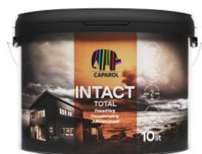
CAPAROL INTACT TOTAL AKRYLMALING 10L SPANN