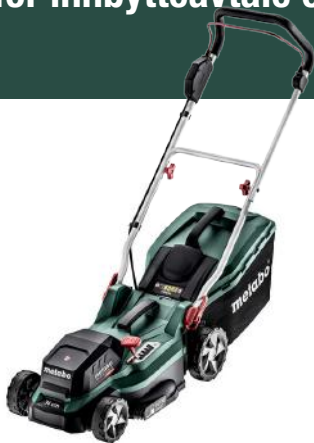
METABO RM 36-18 LTX BL 36 GRESSKLIPPER SOLO ART. NR: M601716850

metabo ® PROFESSIONAL POWER TOOL SOLUTIONS