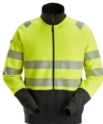
SNICKERS WORKWEAR JAKKE 2835 HIGH-VIS KL2 GUL/SORT ART. NR: S28356604006

En komfortabel vernesko med en mellomsåle i ETPU som gir enestående demping og som reduserer trykket på bena ved gåing og ståing