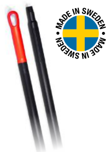
BJÄRNUMS LANGSKAFT GLASSFIBER 150 CM ART. NR: B8231440