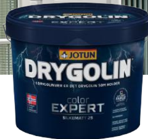
JOTUN DRYGOLIN COLOR EXPERT 9L