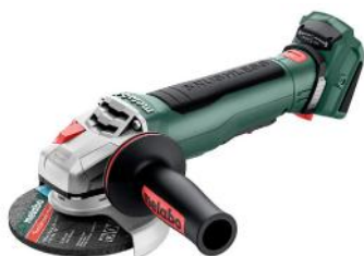
METABO VINKELSLIPER WPB 18 LT BL 11-125 QUICK SOLO ART. NR: M6130598400