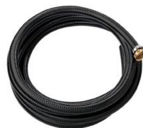
METABO AVLØPSSLANGE 7M SENKEPUMPE ART. NR: M628821000