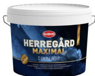
GJØCO MAXIMAL 9L