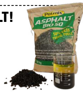
POTMIX ASPHALT BIO 50 20 KG (SEKK) ART. NR: PX11055