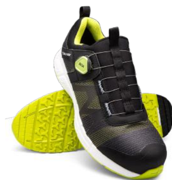
SOLID GEAR VERNESKO VENT 2 ART. NR: SG7601142

Dobbeltvevd high-vis t-skjorte med segmentert refleksbånd som gir god sikkerhet under arbeid som krever ekstra synlighet.