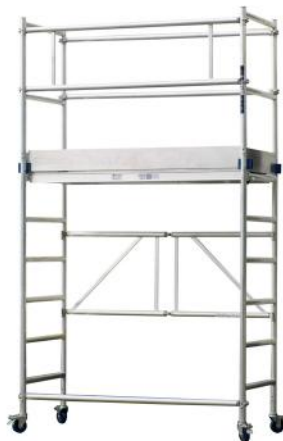
SKEPPSHULTSTEGEN RULLESTILLAS MODUL A+B ART. NR: SK282-A + SK282-B

KAMPANJEPRIS: 10 490,- GRUNNPRIS: 20 551,-