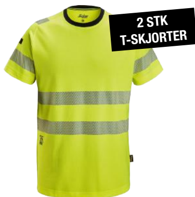
SNICKERS WORKWEAR 2539HIGH-VIS T-SKJORTE, KLASSE 2 ART. NR: S2539660

Behagelig arbeidsbukse med høy synlighet i henhold til klasse 2 med smal passform for daglig bruk.