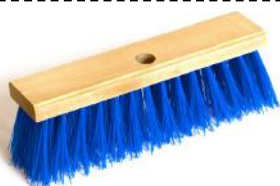
BJÄRNUMS FEIEKOST 300MM BLÅ UTEN SKAFT ART. NR: B1117840