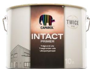
CAPAROL INTACT PRIMER 10L SPANN