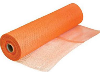
ARMERINGSVEV ORANGE 650/110 50M ART. NR: CA747706

E-post: per@duri.no Tlf.: +47 412 63 969