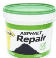
POTMIX ASPHALT REPAIR 20KG (SPANN) ART. NR: PX11020