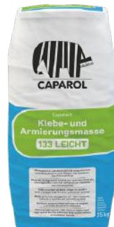
CAPAROL PUSS & KLISTERBRUK 133 LETT 25 KG ART. NR: CA786045

Fiberpuss som brukes i Capatect isolerte fasadesystem.