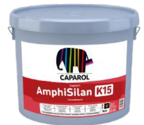
CAPAROL AMPHISILAN FASADEPUSS K15 HVIT 25KG ART. NR: CA988784

Fiberpuss som kan brukes i tykkelser opptil 20mm og for luftede fasadepuss-system, Capatect Vento E sammen med vår Capaboard lettvekts-plate.