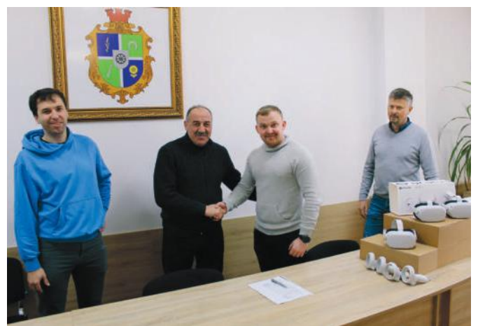
Презентація додатку віртуальної реальності

Крім цього, кілька років поспіль до повномасштабного вторгнення реалізовувалася чудова ініці-