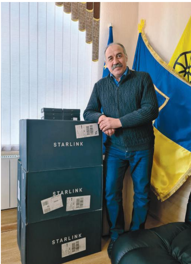
Передача засобів супутникового зв'язку Starlink

атива — конкурс грантів «Громада своїми руками». Метою конкурсу була активізація місцевих жителів для поліпшення соціальної інфраструктури. Кожен із наших мешканців мав можливість створити ініціативну групу й подати заявку на реалізацію проекту для