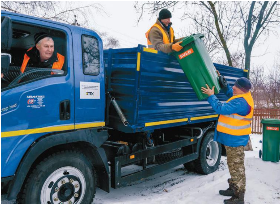
Для Мачухівської громади придбали самоскид та індивідуальні сміттєві баки

атива — конкурс грантів «Громада своїми руками». Метою конкурсу була активізація місцевих жителів для поліпшення соціальної інфраструктури. Кожен із наших мешканців мав можливість створити ініціативну групу й подати заявку на реалізацію проекту для