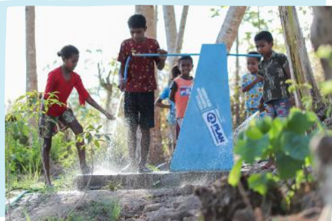
Anak-anak di Kabupaten Timor Tengah Selatan, NTT kini dapat menikmati akses air bersih yang selesai dibangun pada Juli 2024.