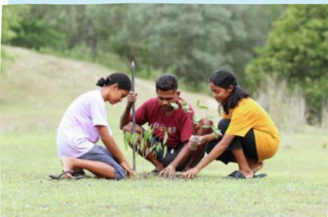
Memperingati Hari Hutan Sedunia, kaum muda Soe, NTT menanam 950 bibit pohon di pada lahan 300m 2 sebagai upaya pencegahan dampak perubahan iklim.