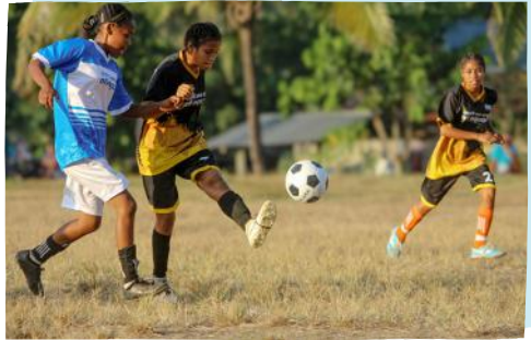
Turnamen sepak bola perempuan pada Youth Camp Cluster III, salah satu aktivitas program MAPAN (Meraih Masa Depan) di Nagekeo, Flores.