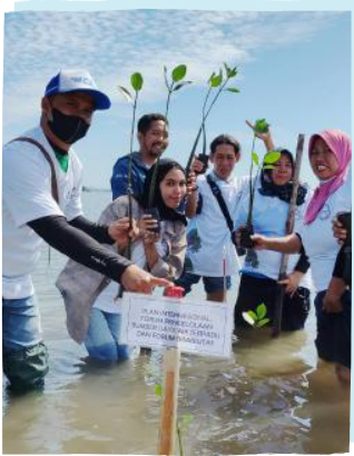
Penanaman 120.000 bibit mangrove di Sumbawa untuk mengurangi intrusi air laut dan erosi pantai.