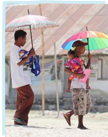
Kelas Ayah, program dimana para Ayah yang membawa balita ke Posyandu sebagai peran aktif dalam tumbuh kembang anak.