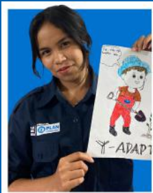
Timor Tengah Selatan, NTT

Kini, Ia tidak hanya peduli akan kesehatan diri sendiri, tetapi juga aktif menjaga lingkungan dengan aksi memilah dan pengolahan sampah untuk mengurangi dampak bencana yang disebabkan oleh perubahan iklim.