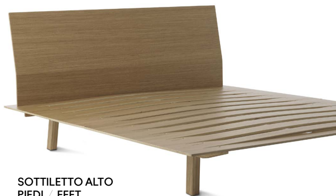
SOTTILETTO ALTO PIEDI / FEET H 30 cm

+++ Indique los pies elegidos en el momento de la compra.