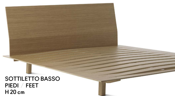
SOTTILETTO BASSO PIEDI / FEET H 20 cm (* )+++