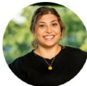
Serife Mert Udlejning