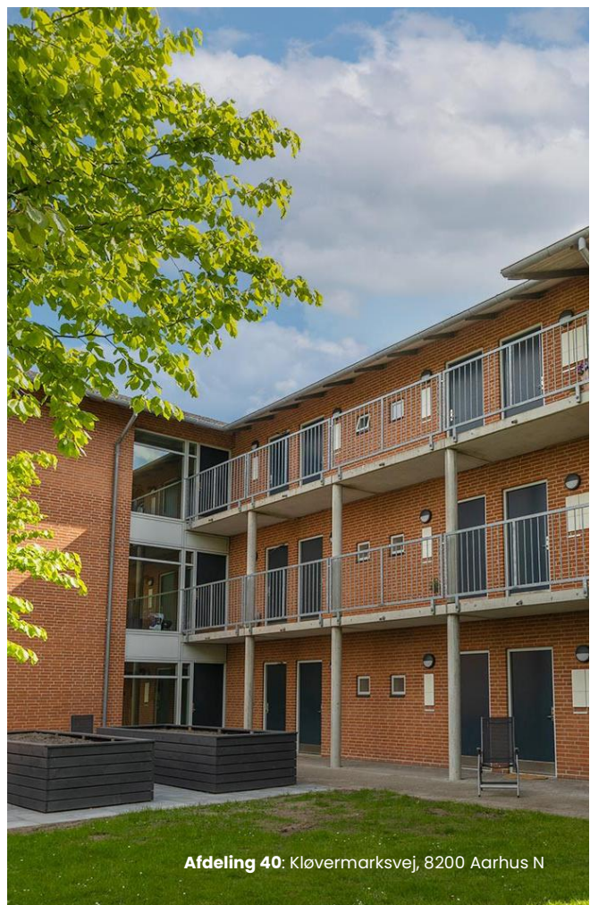
Afdeling 40: Kløvermarksvej, 8200 Aarhus N

Der er ingen særlige forhold, som revisor har påtalt eller særlige økonomiske problemer i organisationen.