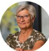
Pia Lund Udlejning