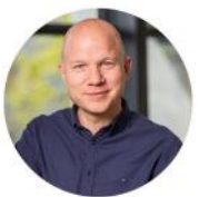
René Braskhøj Drift