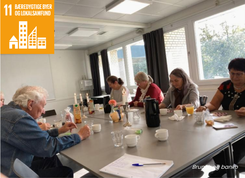
Bruntid og banko