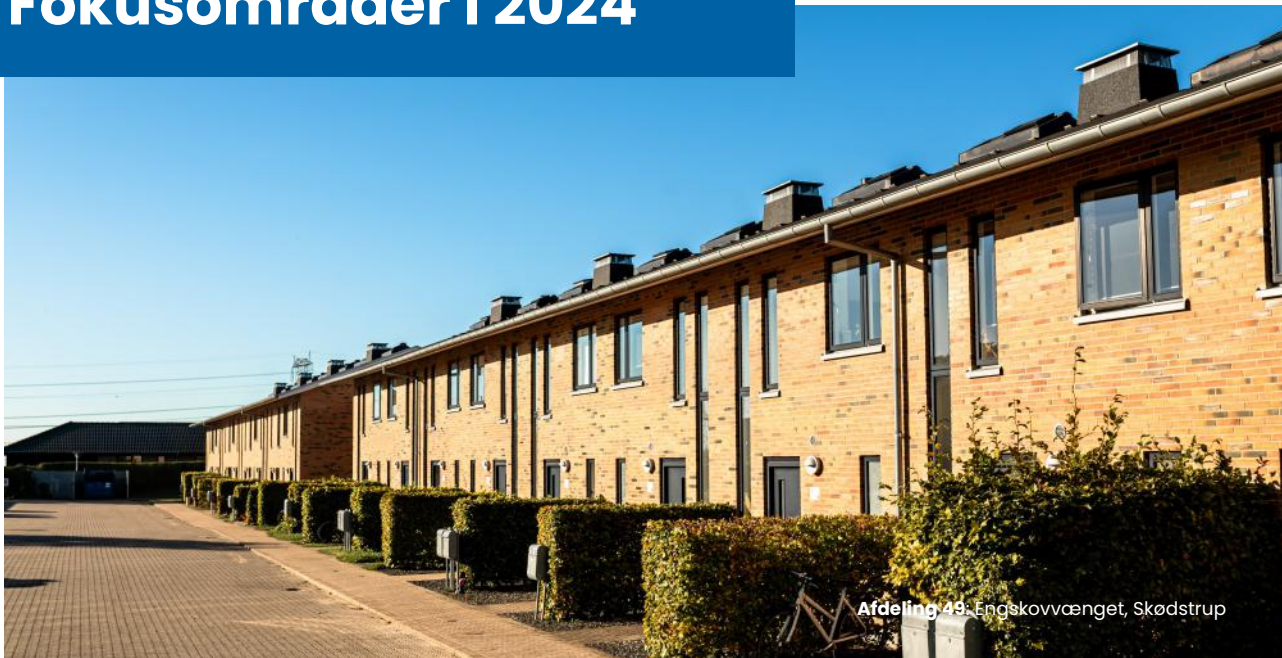
Afdeling 49, Engskovvænget, Skødstrup