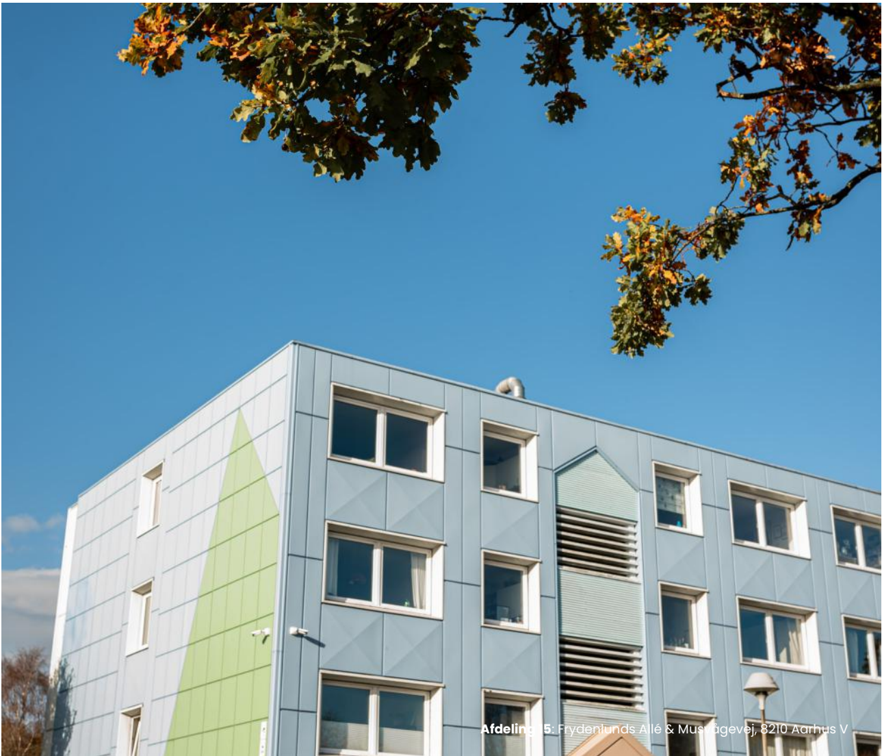
Afdeling 5: Frydenlands Allé &amp; Musgravevej, 8210 Aarhus V