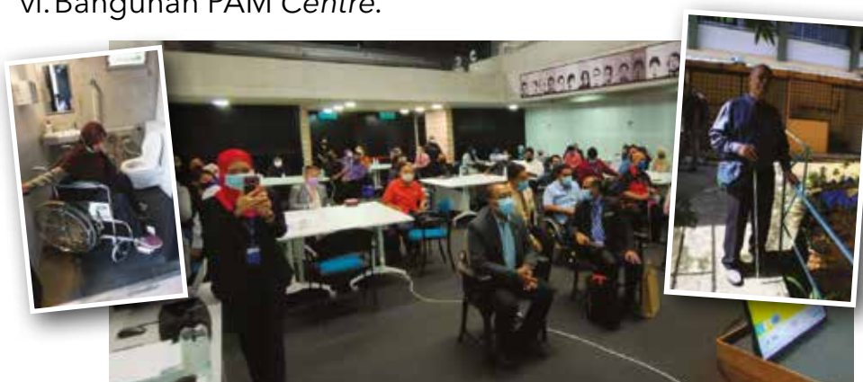
Bengkel Training of Trainers (ToT) dan Audit Akses dalam Persekitaran Alam Bina di Wilayah Persekutuan Kuala Lumpur (WPKL), Wilayah Persekutuan Putrajaya dan Melaka Tahun 2021