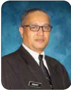
Encik Zuhami bin Omar Pengarah Jabatan Pembangunan Orang Kurang Upaya (JPOKU)