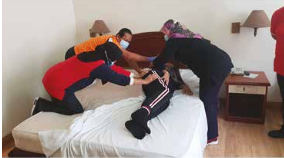
Para peserta menjalankan sesi praktikal pengurusan kebersihan pesakit OKU terlantar