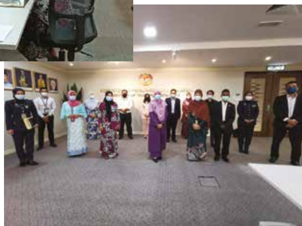
Mesyuarat Pemurnian Kod Amalan Terbaik ( Code of Practice - COP ) Pengendalian Orang Kurang Upaya (OKU) bagi Perkhidmatan Pengangkutan Awam Udara (27 April 2021)