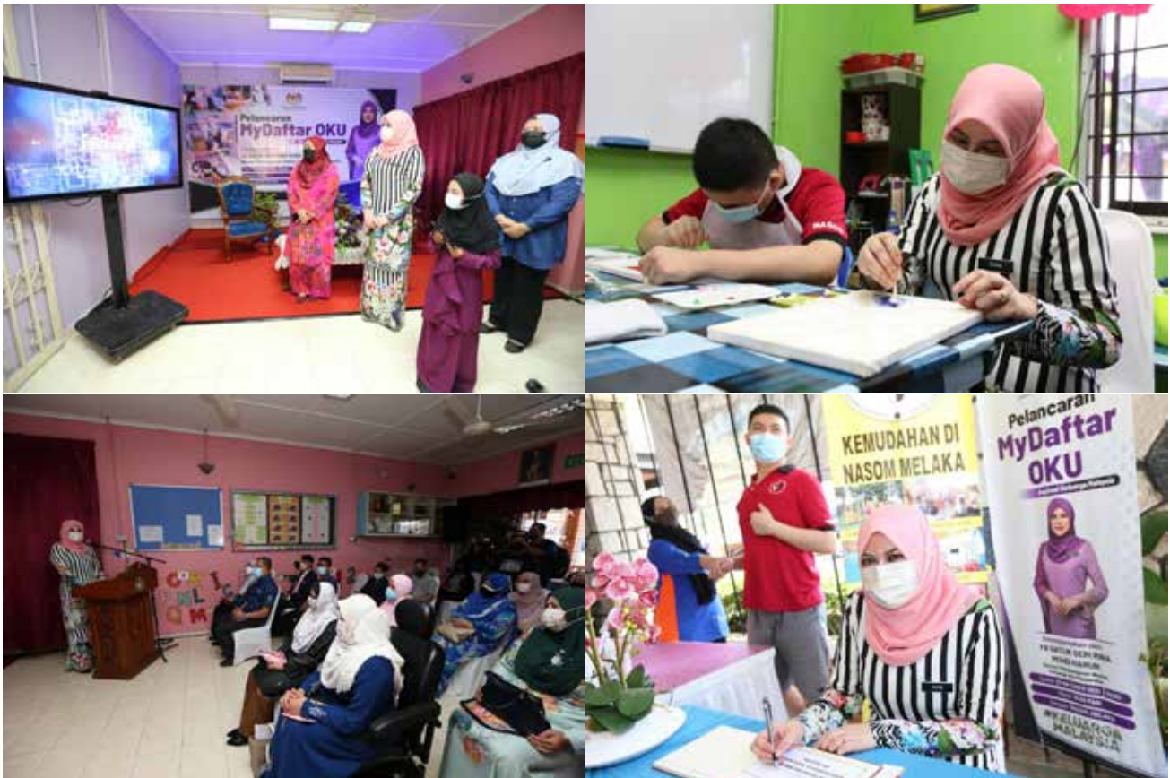
Majlis Pelancaran My Daftar OKU (Pencapaian 100 Hari YB Menteri Pembangunan Wanita, Keluarga dan Masyarakat)