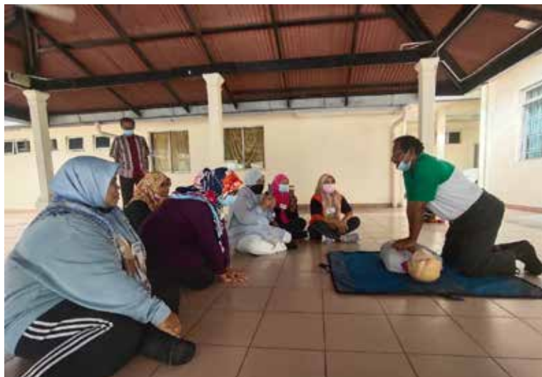
Demonstrasi bantuan pertolongan cemas ditunjukkan oleh Paramedik dari Persatuan Saint John