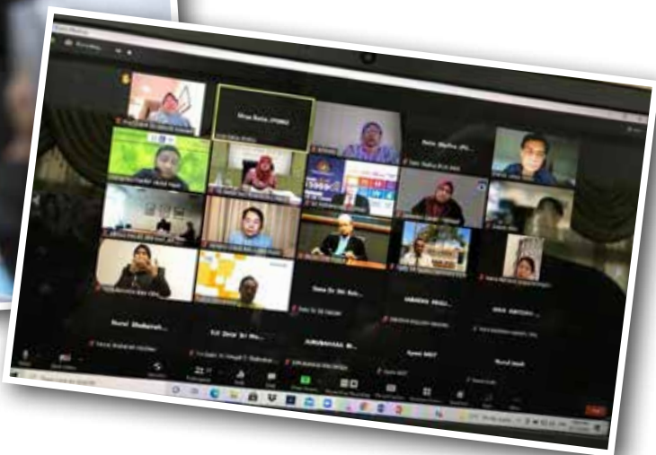
Mesyuarat Majlis Kebangsaan bagi Orang Kurang Upaya Bil. 3/2021 (22 November 2021)