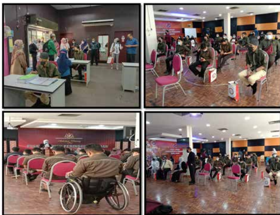
Program Outreach Pekerjaan yang telah dilaksanakan di Pusat Latihan Perindustrian dan Pemulihan Bangi, Selangor

Objektif Program: Program ini dilaksanakan bagi berkongsi maklumat berkenaan inisiatif-inisiatif sedia ada dan sedang dilaksanakan di bawah Kementerian Sumber Manusia (KSM) bagi memperkasakan peluang pekerjaan dalam kalangan OKU di tempat kerja. Program ini telah dilaksanakan di Pusat Latihan Perindustrian dan Pemulihan Bangi (PLPP).