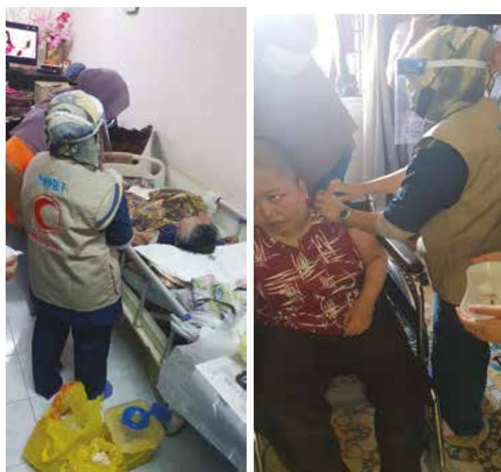
Sukarelawan Kesihatan NGO melaksanakan pemberian vaksinasi kepada OKU dan Pesakit Terlantar di Rumah

Pihak sukarelawan kesihatan NGO yang terlibat adalah dari badan pertubuhan yang diiktiraf kerajaan Malaysia dan mempunyai pengalaman dalam penjagaan kesihatan di komuniti. Pemilihan sukarelawan kesihatan NGO adalah yang telah dipersetujui oleh pihak jawatankuasa COVID-19 Immunization Task Force dan dilatih melaksanakan pemberian vaksin COVID-19 di rumah pesakit. Empat (4) NGO terlibat adalah MERCY Malaysia, Persatuan Bulan Sabit Merah, Persatuan Perubatan Islam Malaysia ( IMAM ) Response & Relief Team (IMARET) dan Persatuan Kanser Kebangsaan Malaysia. Sukarelawan ini bukan sahaja memberi vaksinasi kepada pesakit OKU terlantar di rumah, malahan juga kepada penjaga dan ahli keluarga pesakit yang layak divaksinasi bagi memberi perlindungan yang menyeluruh terhadap kawalan wabak.