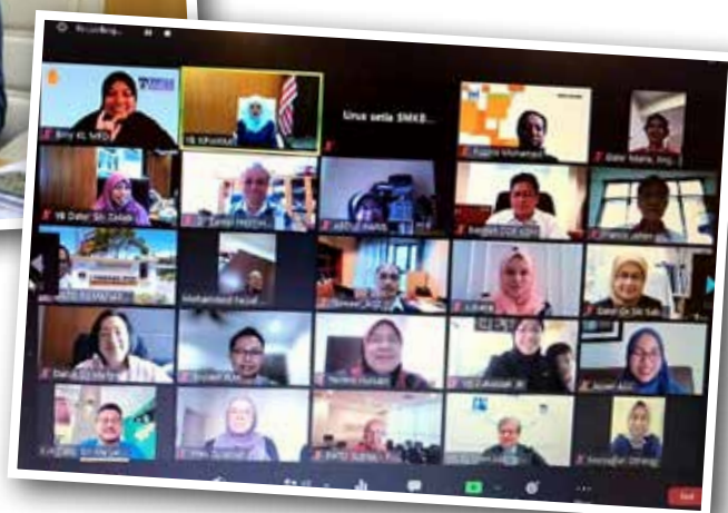
Mesyuarat Majlis Kebangsaan bagi Orang Kurang Upaya Bil. 2/2021 (24 Jun 2021)