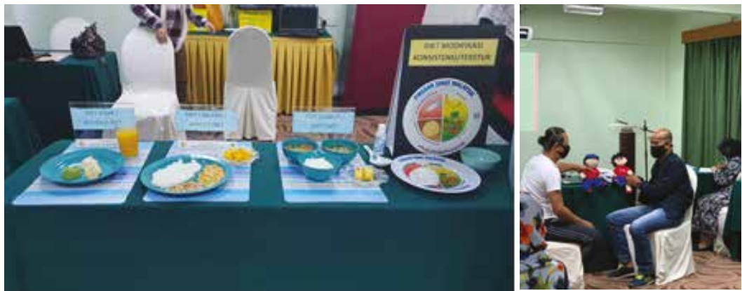
Sesi demonstrasi pemakanan kanak-kanak OKU serta sesi praktikal kesihatan seksual dan keselamatan diri bagi remaja dan kanak-kanak OKU