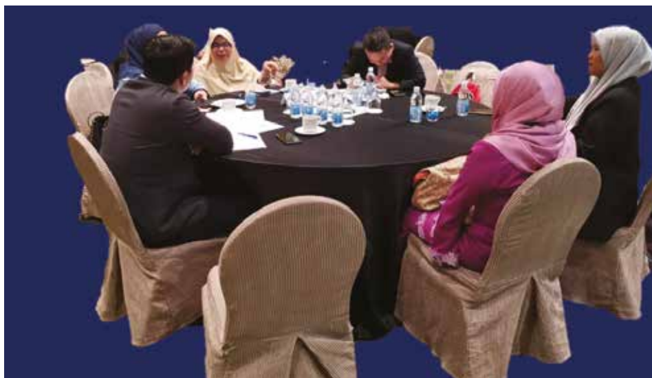
Perbincangan bagi Memperhalusi MJM Plat Kenderaan OKU Bersama JKM, KPWKM dan JPJ