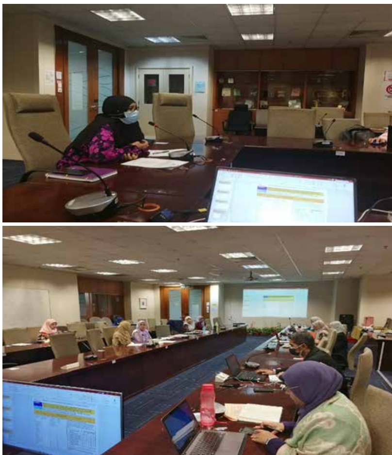
Bengkel Kerja Jawatankuasa Teknikal Pemantapan Pindaan Indikator dan Sasaran serta Penyelarasan Status Pencapaian Teras Strategik 3 Pelan Tindakan Orang Kurang Upaya (PTOKU) 2016-2022