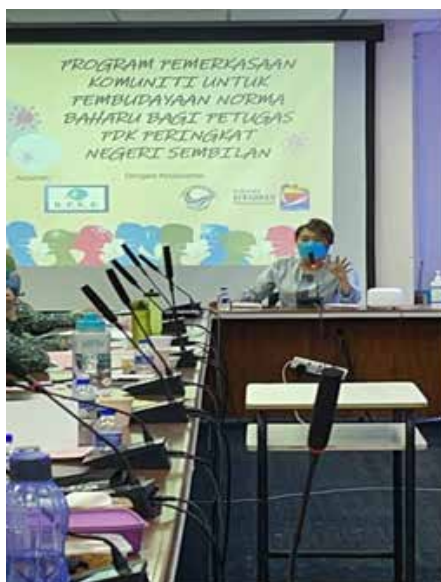
YB Senator Datuk Ras Adiba Binti Mohd. Radzi sebagai salah seorang panel jemputan pada Program Pemerkasaan Komuniti untuk Pembudayaan Norma Baharu bagi Petugas PDK Peringkat Negeri yang telah diadakan pada 21 Oktober 2021

Pelatih, ibu bapa dan seterusnya masyarakat berpengetahuan dalam pengamalan norma baharu dan langkah-pencegahan penyakit pandemik. Program ini telah mendapat sambutan yang menggalakkan dan berjalan lancar seperti yang dirancang. Para peserta memberikan komen positif supaya program seperti ini dapat dijalankan setiap tahun dan perlu diperluaskan kepada petugas-petugas PDK, ibu bapa dan ahli jawatankuasa PDK.