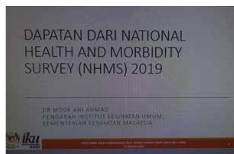
Dapatan dari National Health and Morbidity Survey (NHMS) 2019