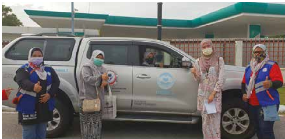
Wakil KKM bersama Pasukan Bergerak NGO IMARET dan sukarelawan JKM

Pihak sukarelawan kesihatan NGO yang terlibat adalah dari badan pertubuhan yang diiktiraf kerajaan Malaysia dan mempunyai pengalaman dalam penjagaan kesihatan di komuniti. Pemilihan sukarelawan kesihatan NGO adalah yang telah dipersetujui oleh pihak jawatankuasa COVID-19 Immunization Task Force dan dilatih melaksanakan pemberian vaksin COVID-19 di rumah pesakit. Empat (4) NGO terlibat adalah MERCY Malaysia, Persatuan Bulan Sabit Merah, Persatuan Perubatan Islam Malaysia ( IMAM ) Response & Relief Team (IMARET) dan Persatuan Kanser Kebangsaan Malaysia. Sukarelawan ini bukan sahaja memberi vaksinasi kepada pesakit OKU terlantar di rumah, malahan juga kepada penjaga dan ahli keluarga pesakit yang layak divaksinasi bagi memberi perlindungan yang menyeluruh terhadap kawalan wabak.