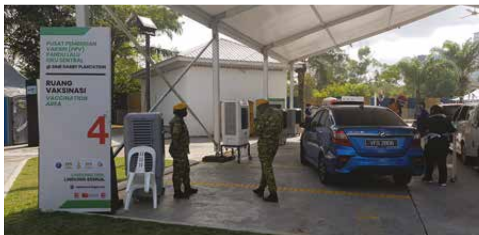
PPV Pandu Lalu bagi OKU, Sime Darby Plantation Ara Damansara , Selangor

Pelaksanaan pemberian vaksin COVID-19 telah dijayakan dengan beberapa inisiatif kerajaan di mana program ini turut dilaksanakan di institusi/pusat jagaan OKU berkediaman, institusi berpusat seperti di bangunan Malaysian Association for The Blind (MAB) yang memberi fokus kepada pemberian vaksinasi OKU Kategori Penglihatan dan di dua (2) pusat pemberian vaksin (PPV) secara pandu lalu di Selangor dan Johor dengan kerjasama Persatuan OKU Sentral.