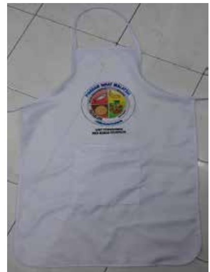
Apron Pemakanan Sihat