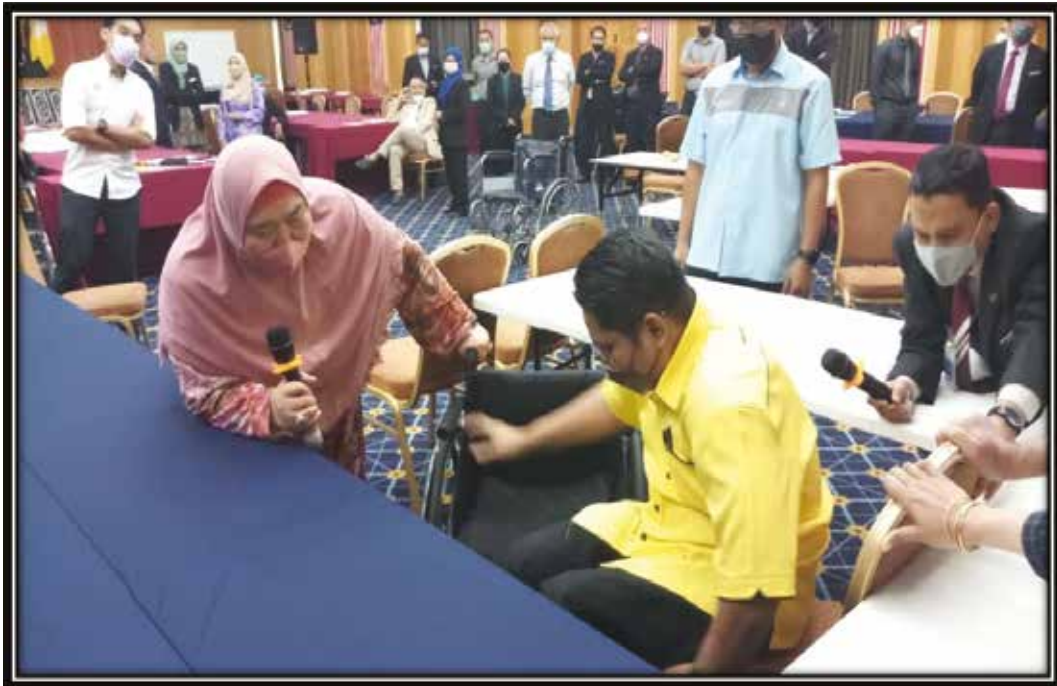
Simulasi Audit Akses di Sekitar Bangunan Dewan Bengkel