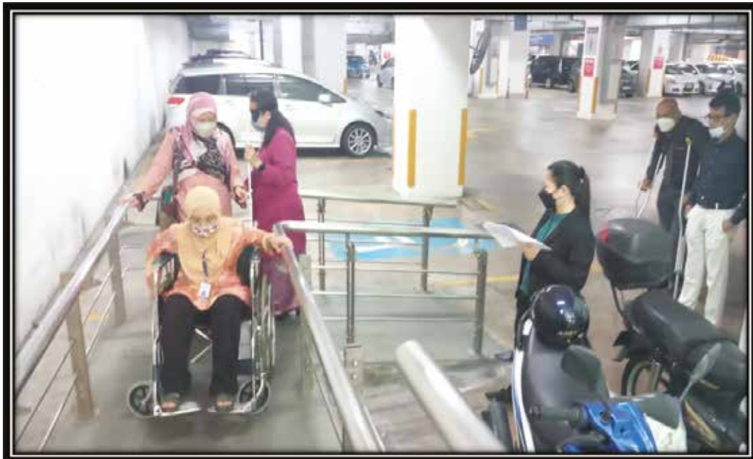
Simulasi Audit Akses di Sekitar Bangunan Dewan Bengkel