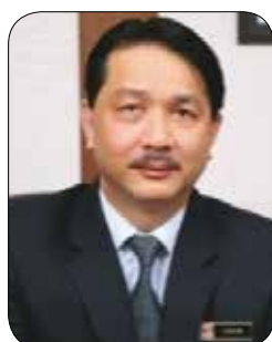
YBhg. Tan Sri Dr. Noor Hisham bin Abdullah Ketua Pengarah Kesihatan