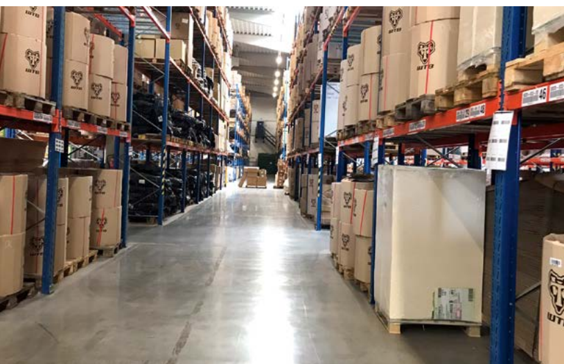
Sklady Geis pro WTB Europe