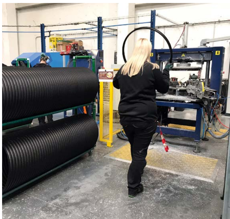
Výroba ráfků WTB v našich prostorech u Plzně

➤ Logistické firmy obvykle nabízejí jen přepravu zboží. U nás mohou klienti využít jak transport zboží po celé Evropě i do vzdálených koutů zeměkoule (po silnici, železnici, moři nebo letecky), tak skladování a celou řadu s ním souvisejících služeb, obalový materiál, řízení e-shopu, celní služby. Spolu s výrobcem komponent na kola WTB jsme dokonce spustili partnerskou výrobu v našich prostorech.