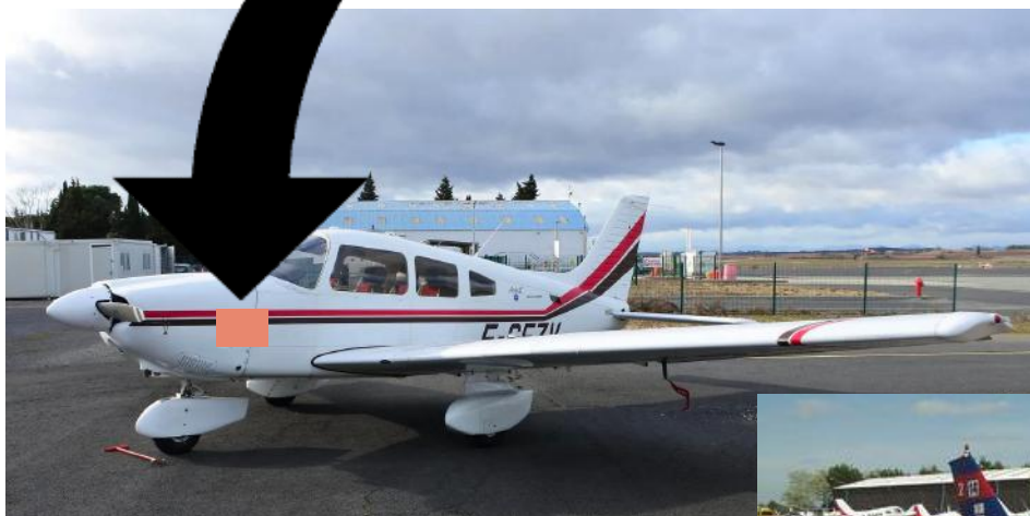
Exemple tour précédent

Les autocollants sont au format A5 et seront limités à 2 exemplaires par sponsor (côté gauche et côté droit de l'avion).