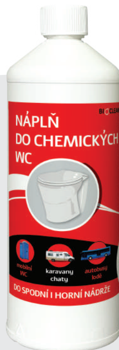
Balení: 1 l, 5 l