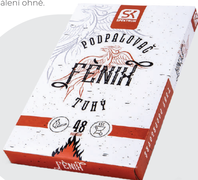
Balení: 28 ks / krt.

Tuhý podpalovač Fénix v kartonové krabičce se 48 podpaly je vhodným pomocníkem pro každodenní rozpalování ohně v kamnech, rodinném krbu nebo při letní grilovačce. Stačí odloupnout 1 kostičku a použít pro zapálení ohně.