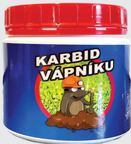
Balení: 400 g

Při styku s vlhkostí (například v půdě) se uvolňuje zapáchající plyn, který má silné odpudiví účinky.