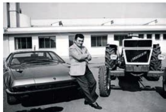
Manden bag – Ferruccio Lamborghini.