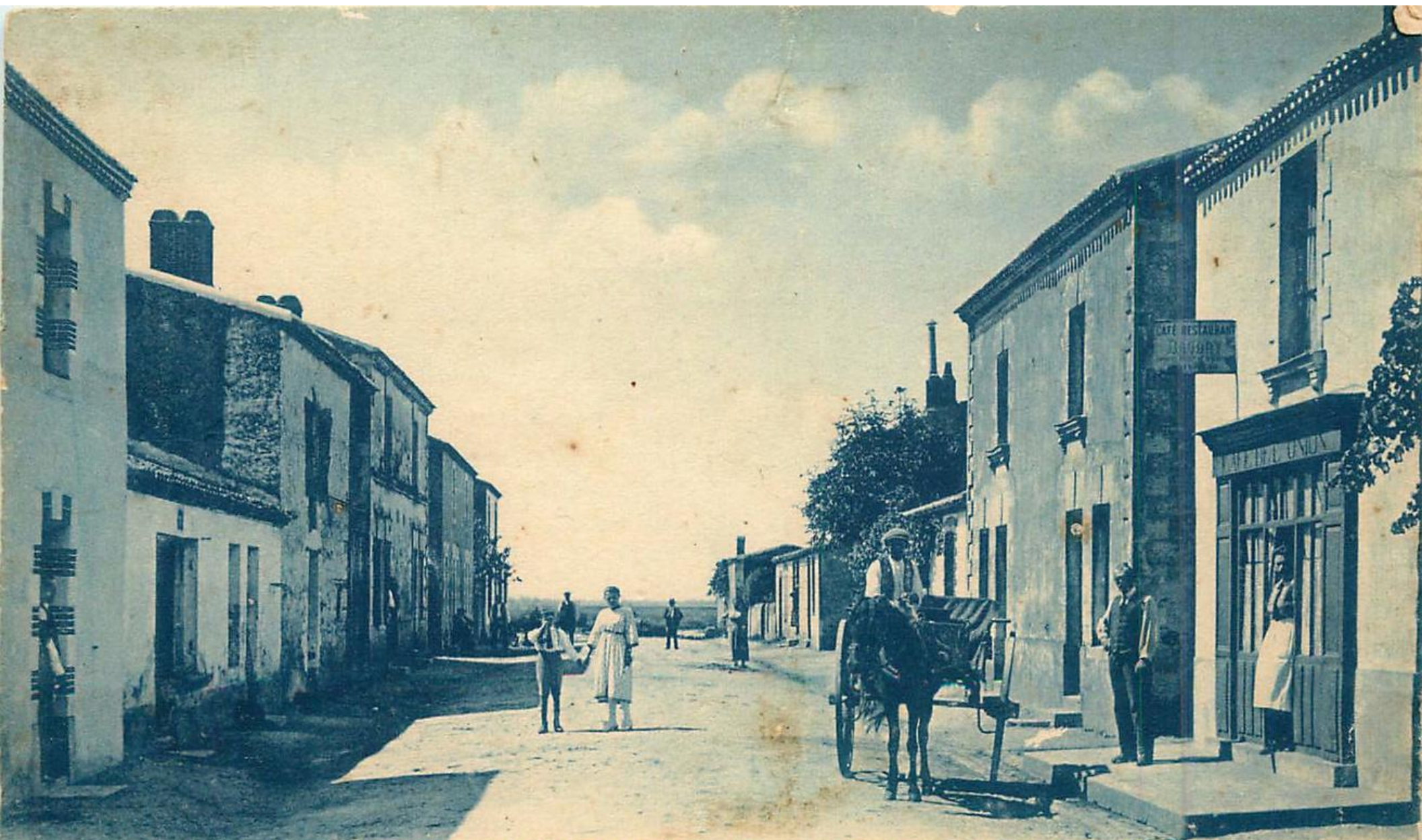
39. LA CHEVROLIÈRE-PASSAY (Loire-Inf.) - La rue conduisant au Port