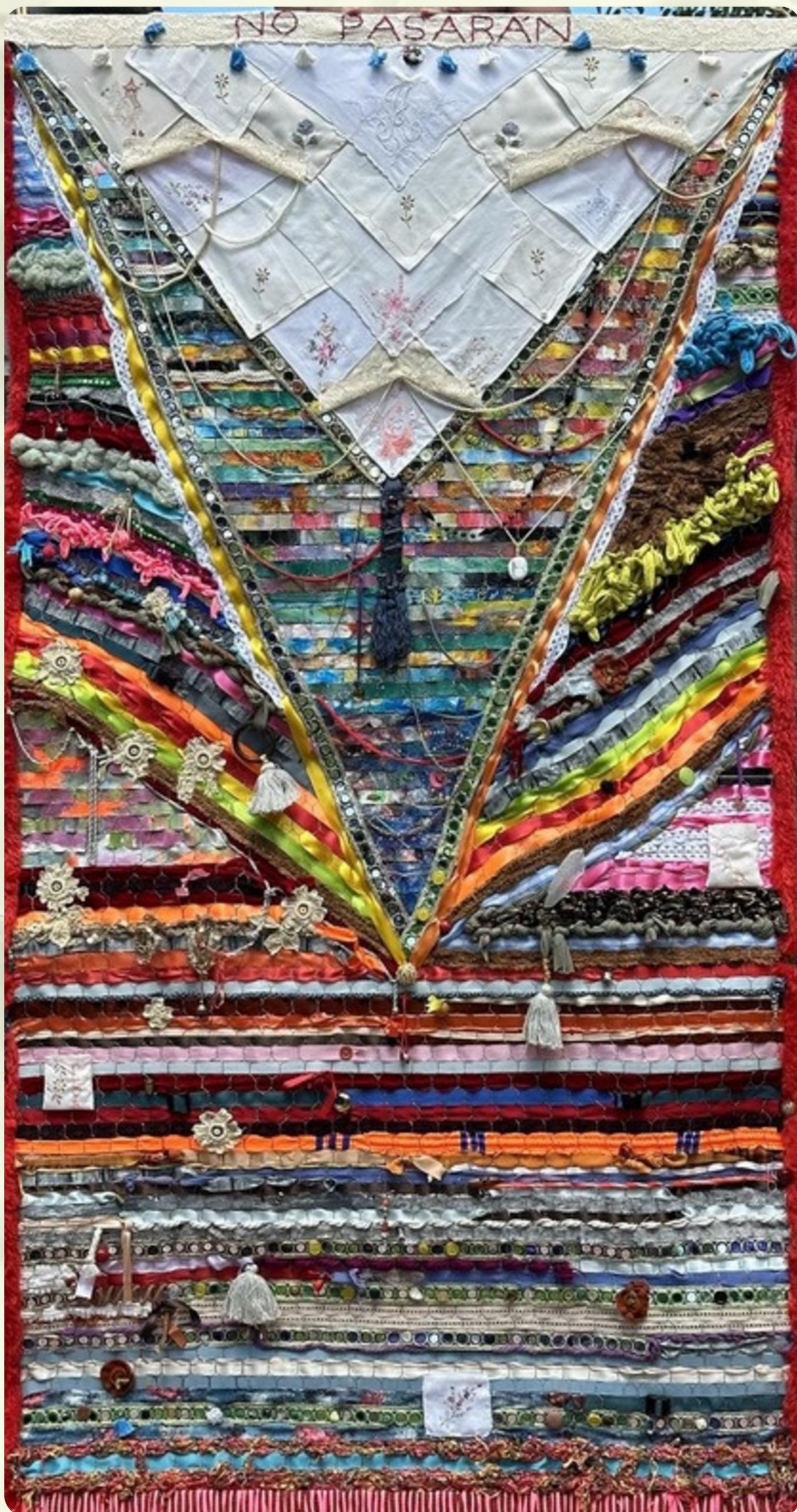
1 - CONJURO CONTRA LA CRUELDAD - NO PASARÁN - INSTALACIÓN TEXTIL