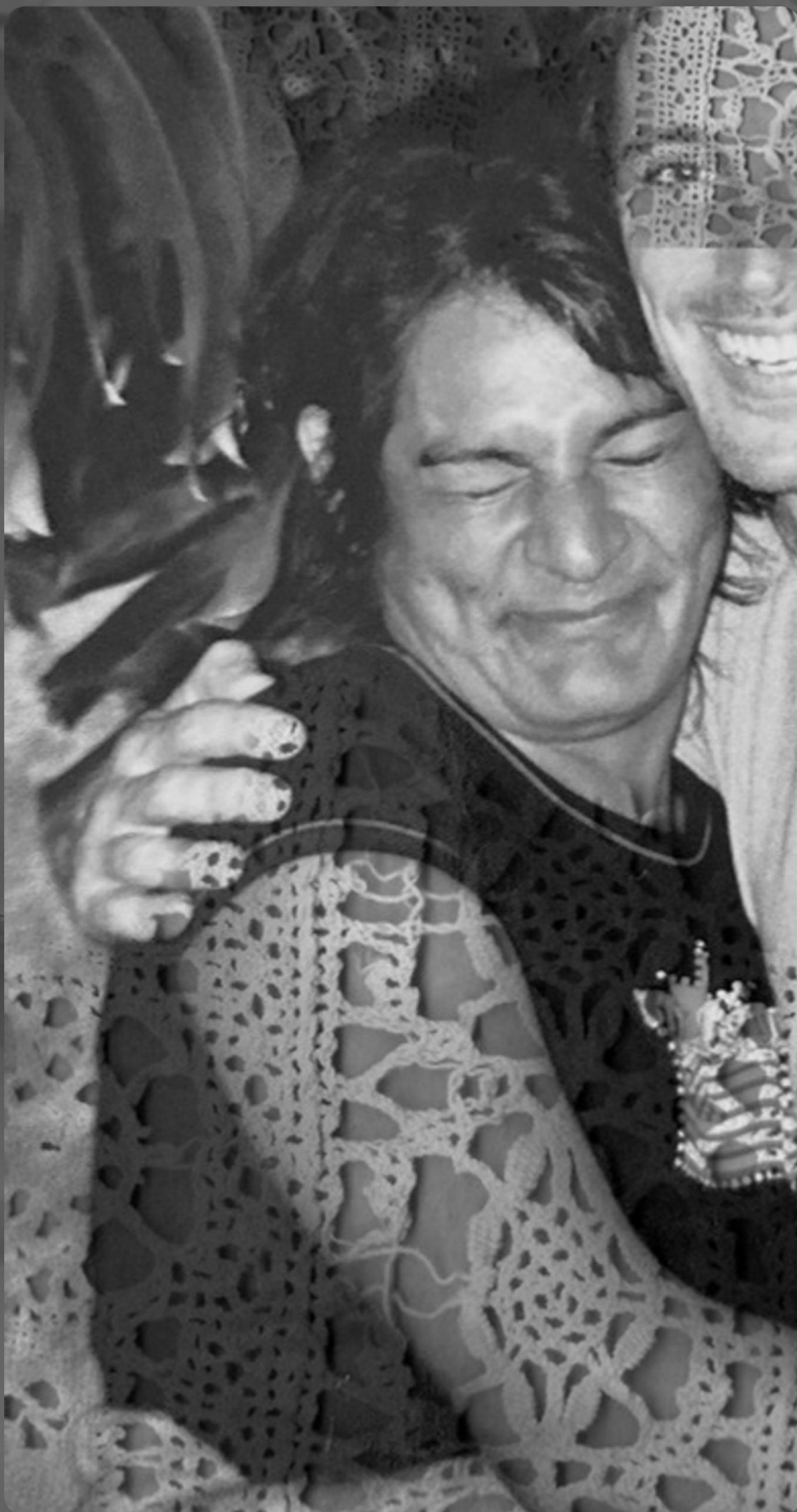
TERNURA 5 - COLLAGE DIGITAL SOBRE MICRO TUL 300 X 145 CM - 2025