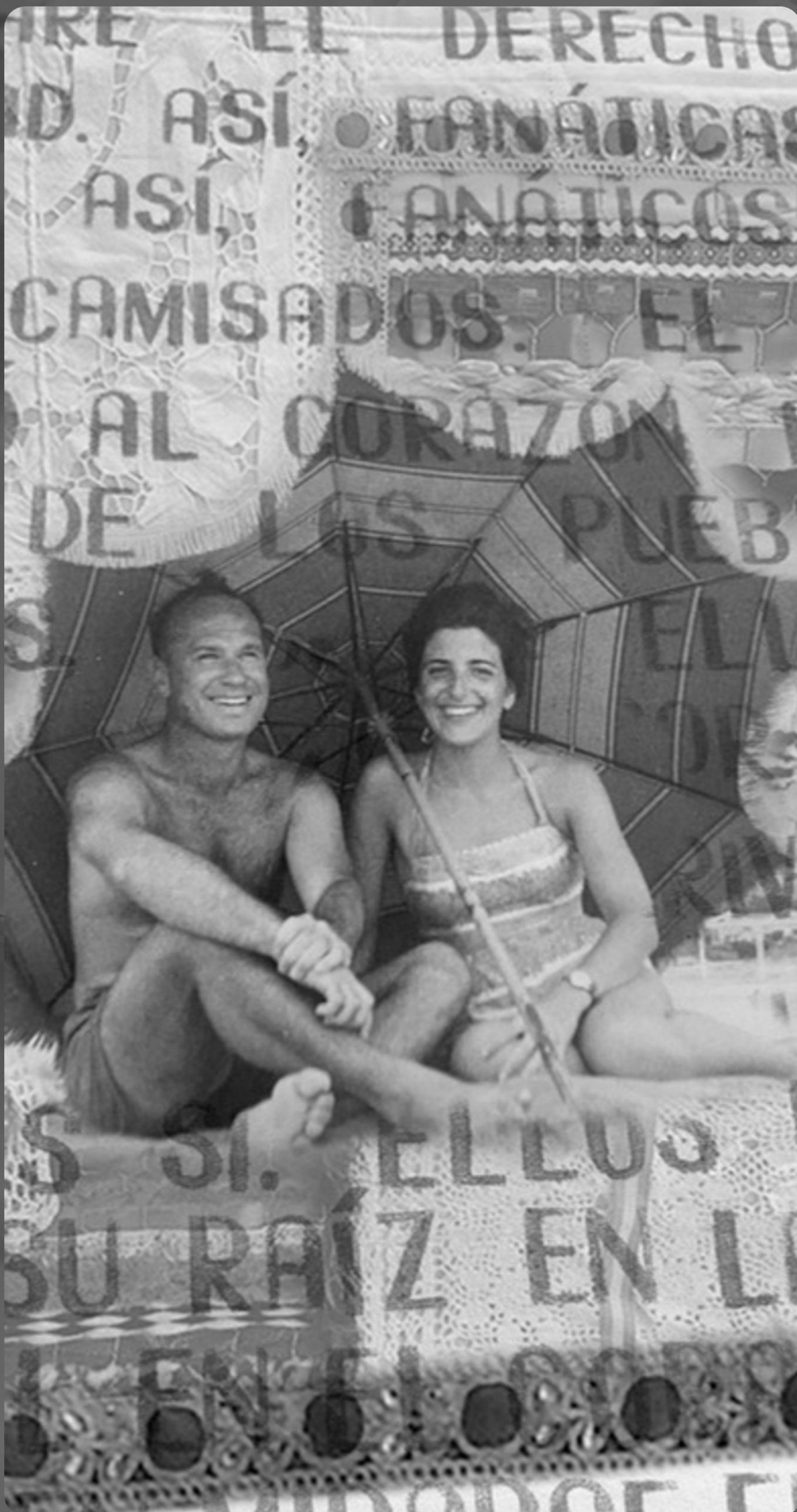
TERNURA 8 - COLLAGE DIGITAL SOBRE MICRO TUL 300 X 145 CM - 2025