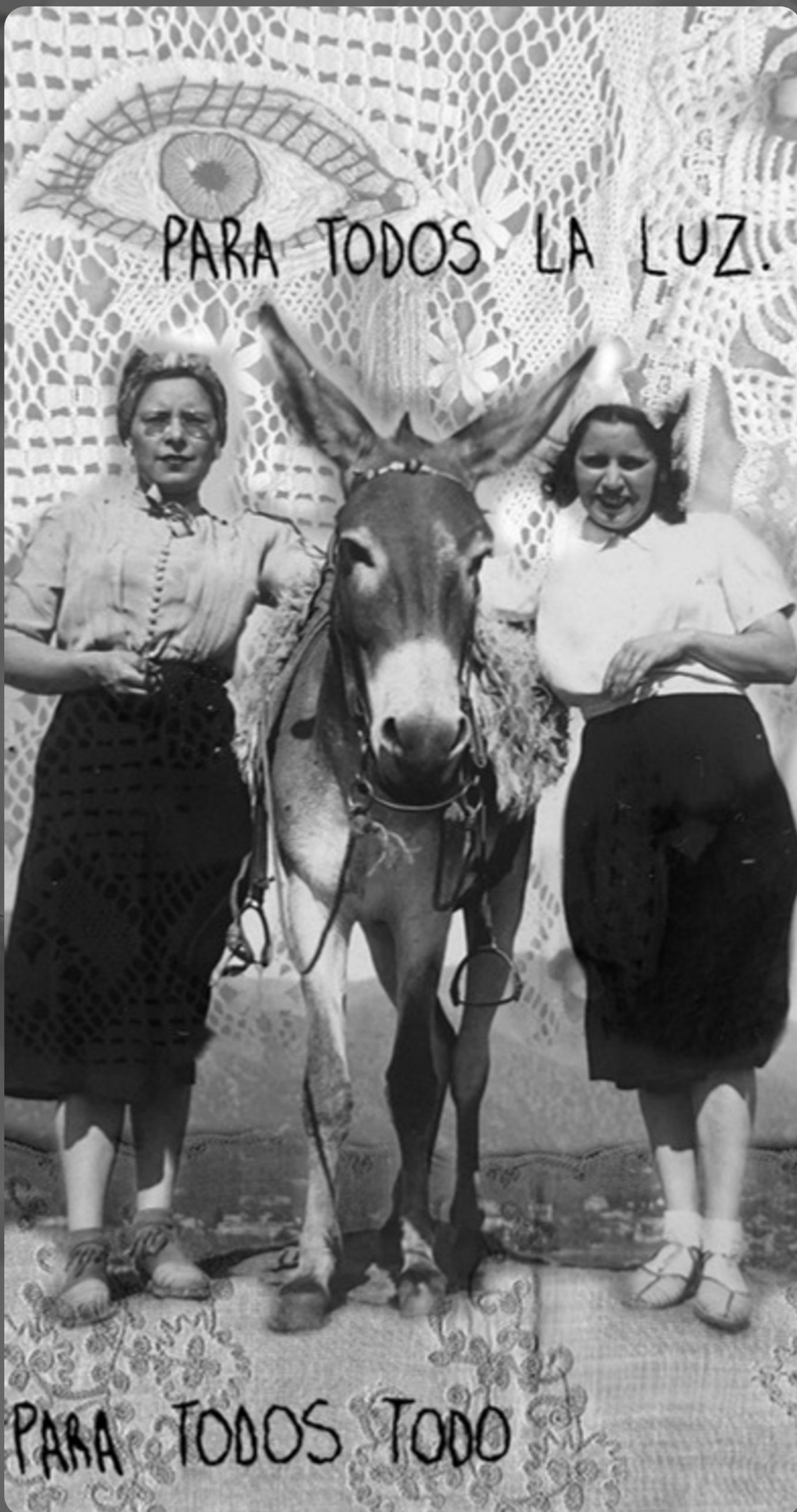
TERNURA 2 - COLLAGE DIGITAL SOBRE MICRO TUL 300 X 145 CM - 2025