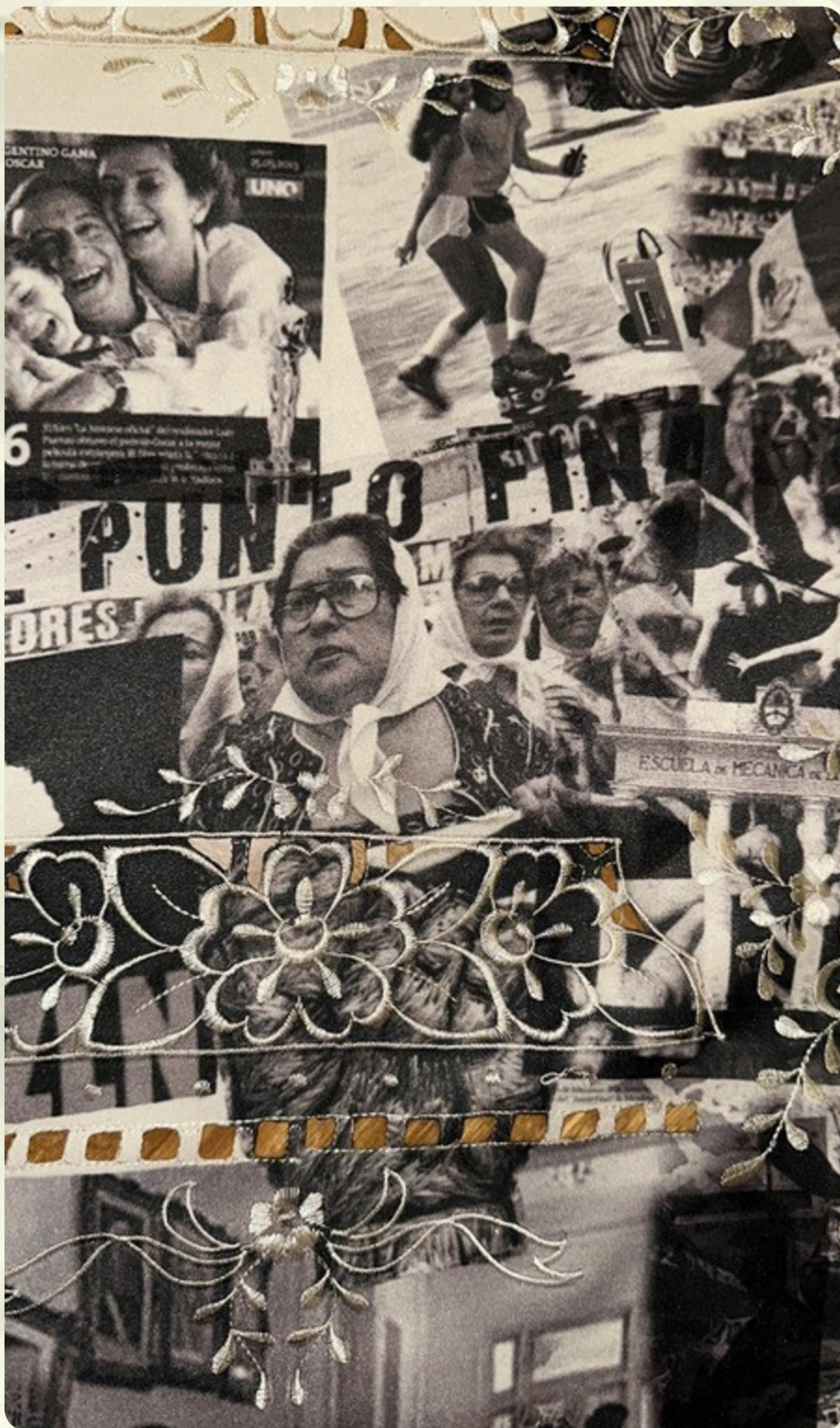
MEMORIAMANTEL - COLLAGE DIGITAL SOBRE MANTEL INDUSTRIAL (DETALLE) -120 X 170 CM - 2025