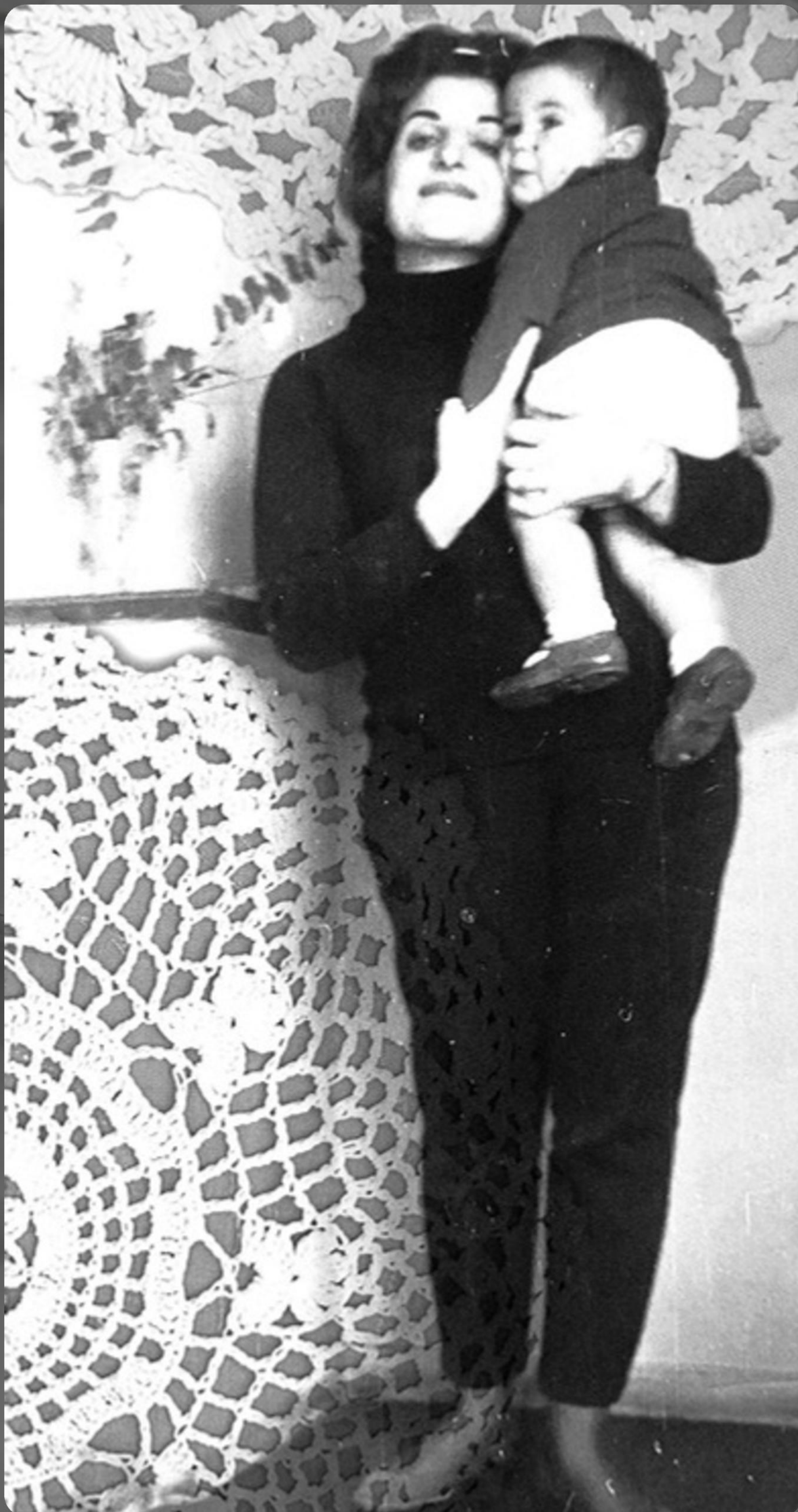
TERNURA 1 - COLLAGE DIGITAL SOBRE MICRO TUL 300 X 145 CM - 2025