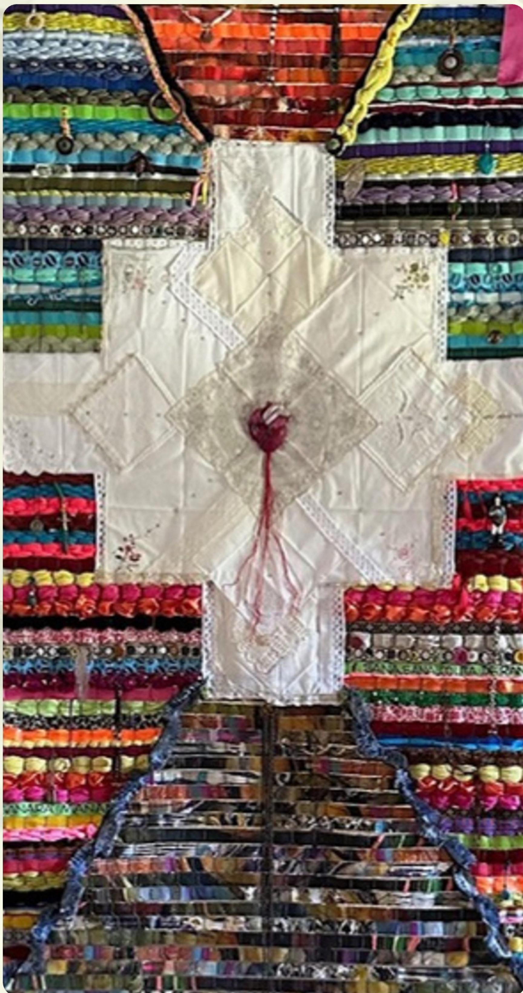
2 - CONJURO CONTRA LA CRUELDAD - LIBERACIÓN O DEPENDENCIA - INSTALACIÓN TEXTIL