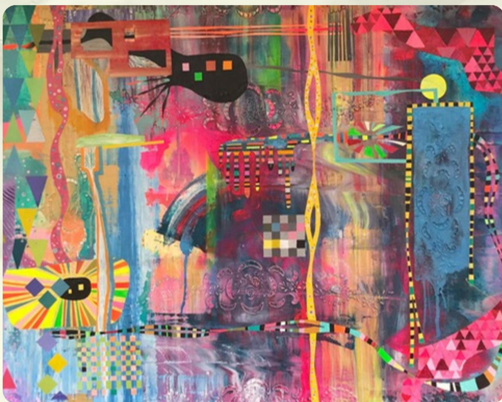
5 - HAY FIESTA EN EL PUEBLO - ACRÍLICO SOBRE MANTEL SOBRE MADERA - 100 X 200 CM. - 2023