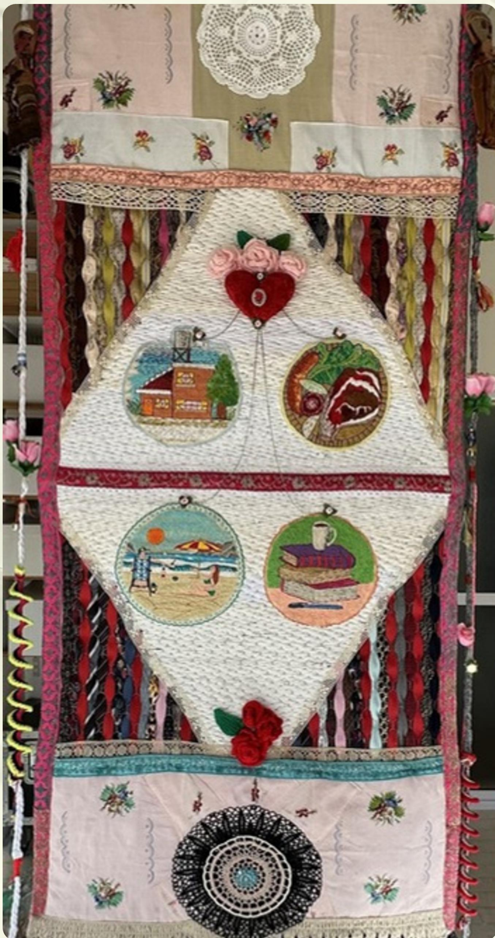
6 - CONJURO CONTRA LA CRUELDAD - PARA TODOS TODO - TEXTIL SOBRE ALAMBRE DE GALLINERO 250 X 100 CM, 2025