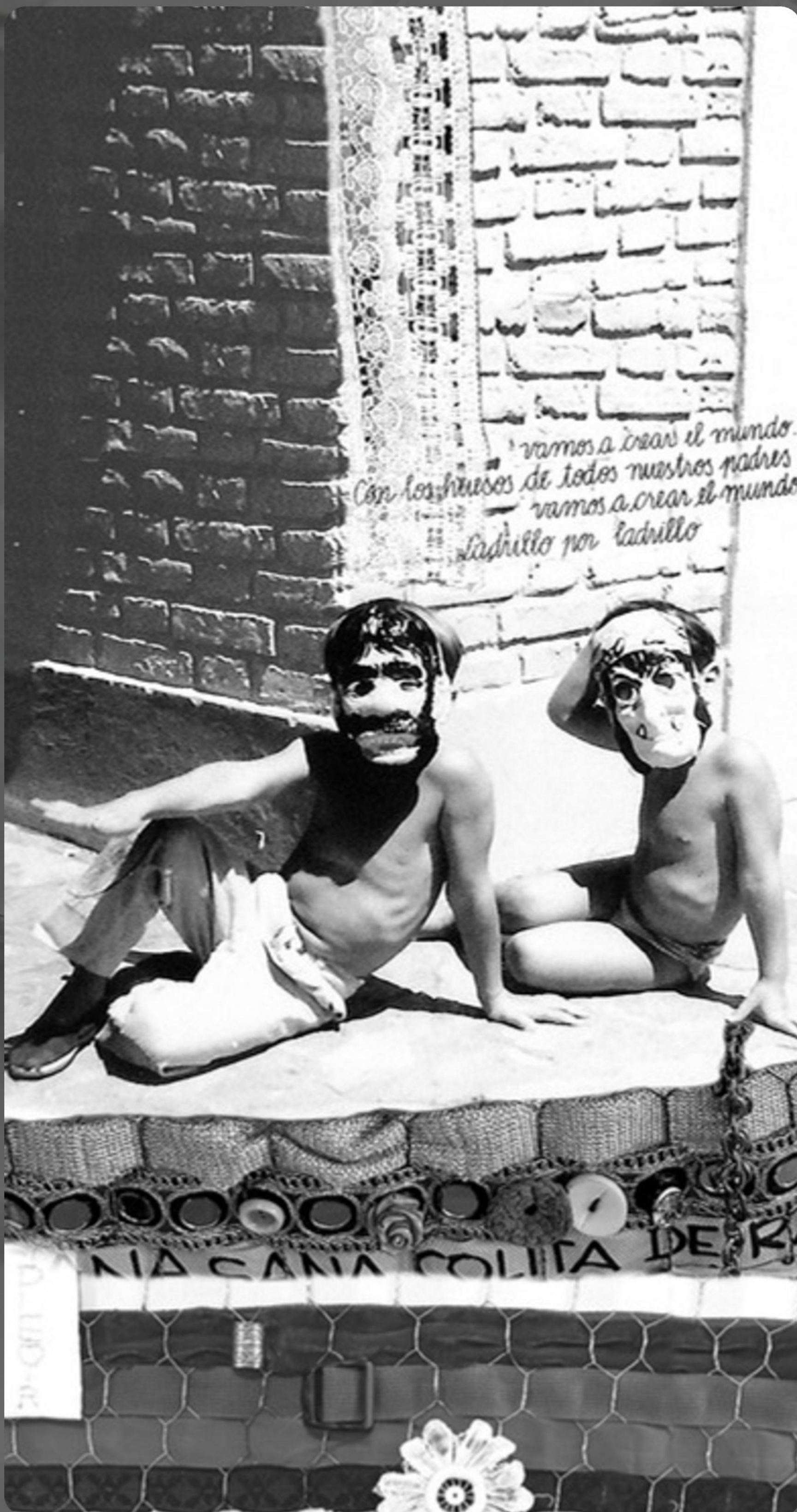
TERNURA 9 - COLLAGE DIGITAL SOBRE MICRO TUL 300 X 145 CM - 2025