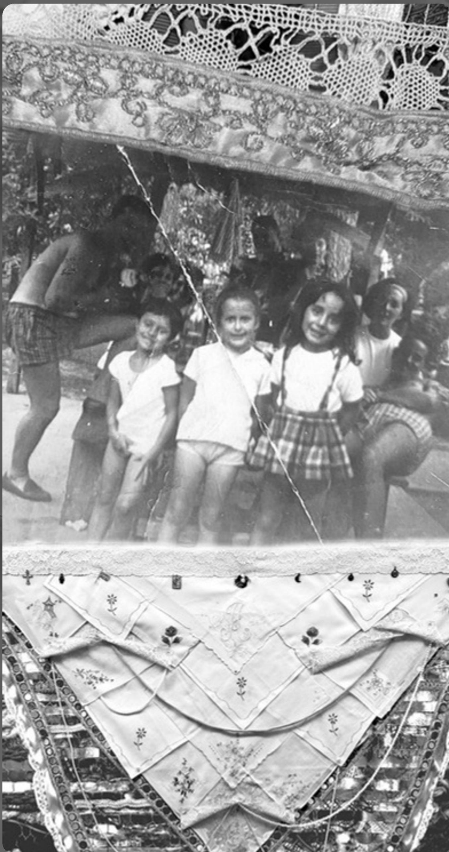
TERNURA 4 - COLLAGE DIGITAL SOBRE MICRO TUL 300 X 145 CM - 2025