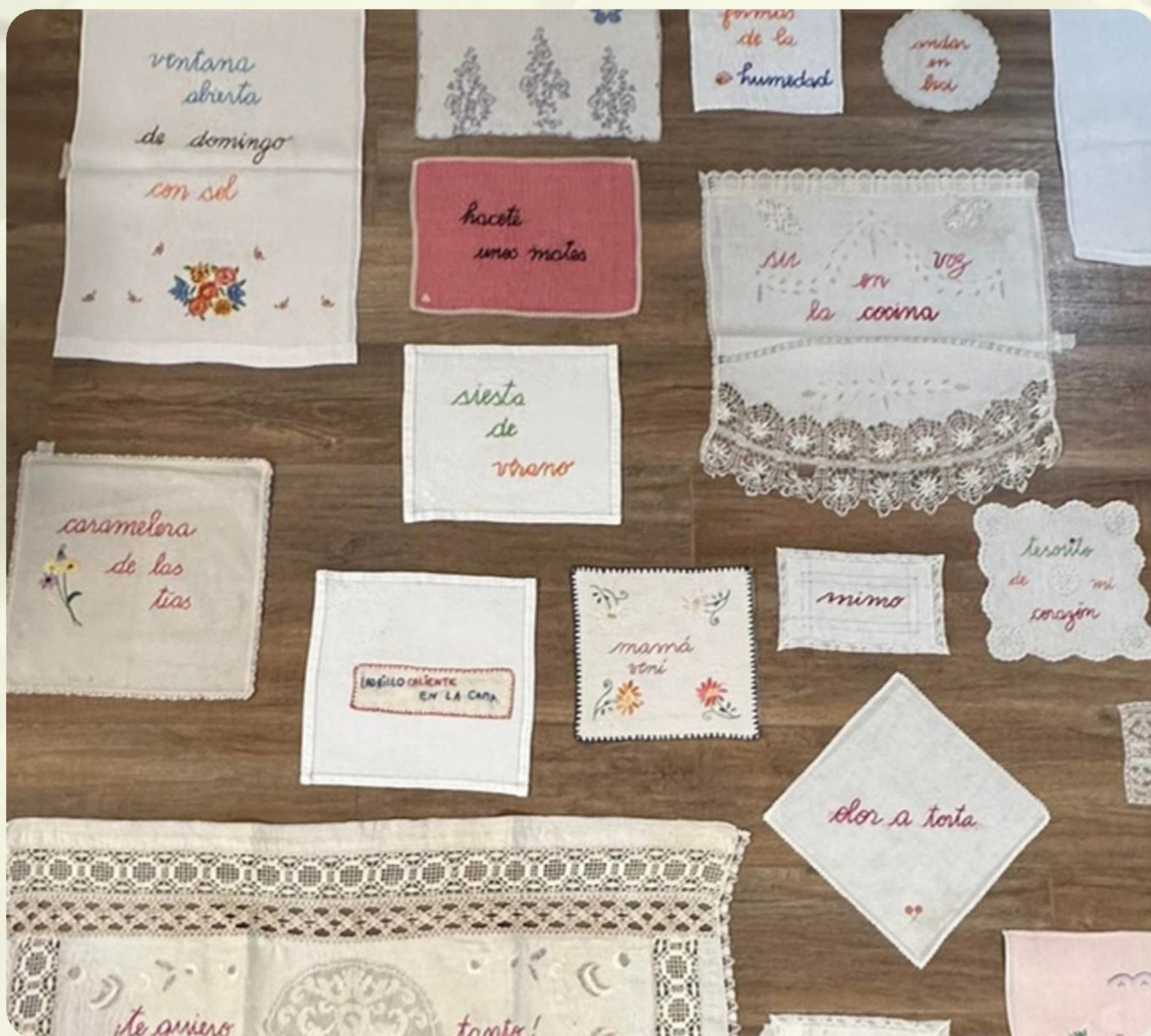
4 - CARTOGRAFÍA POSIBLE DE LO TIERNO - INSTALACIÓN - 200 X 200 CM. - 2025