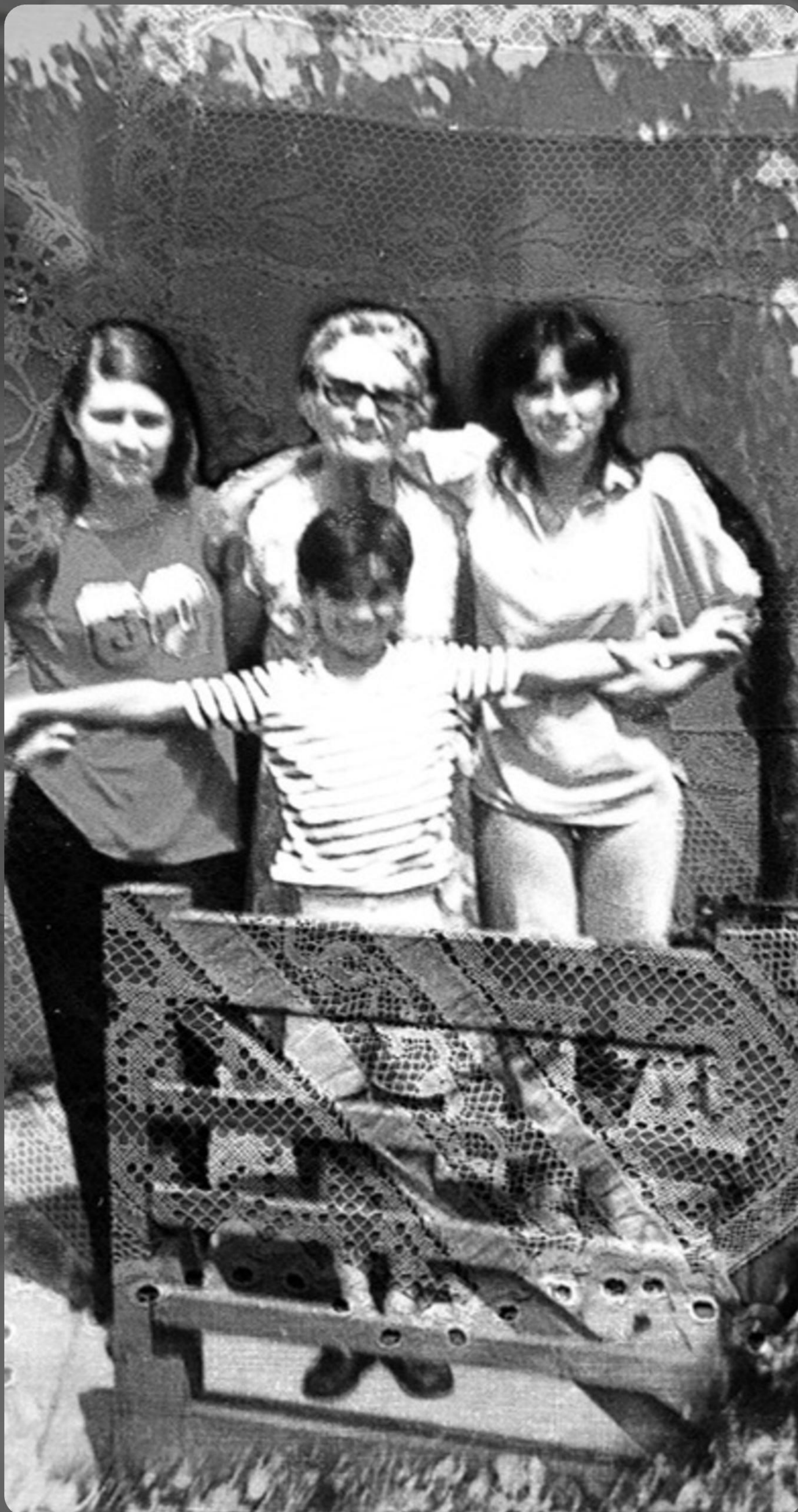
TERNURA 7 - COLLAGE DIGITAL SOBRE MICRO TUL 300 X 145 CM - 2025