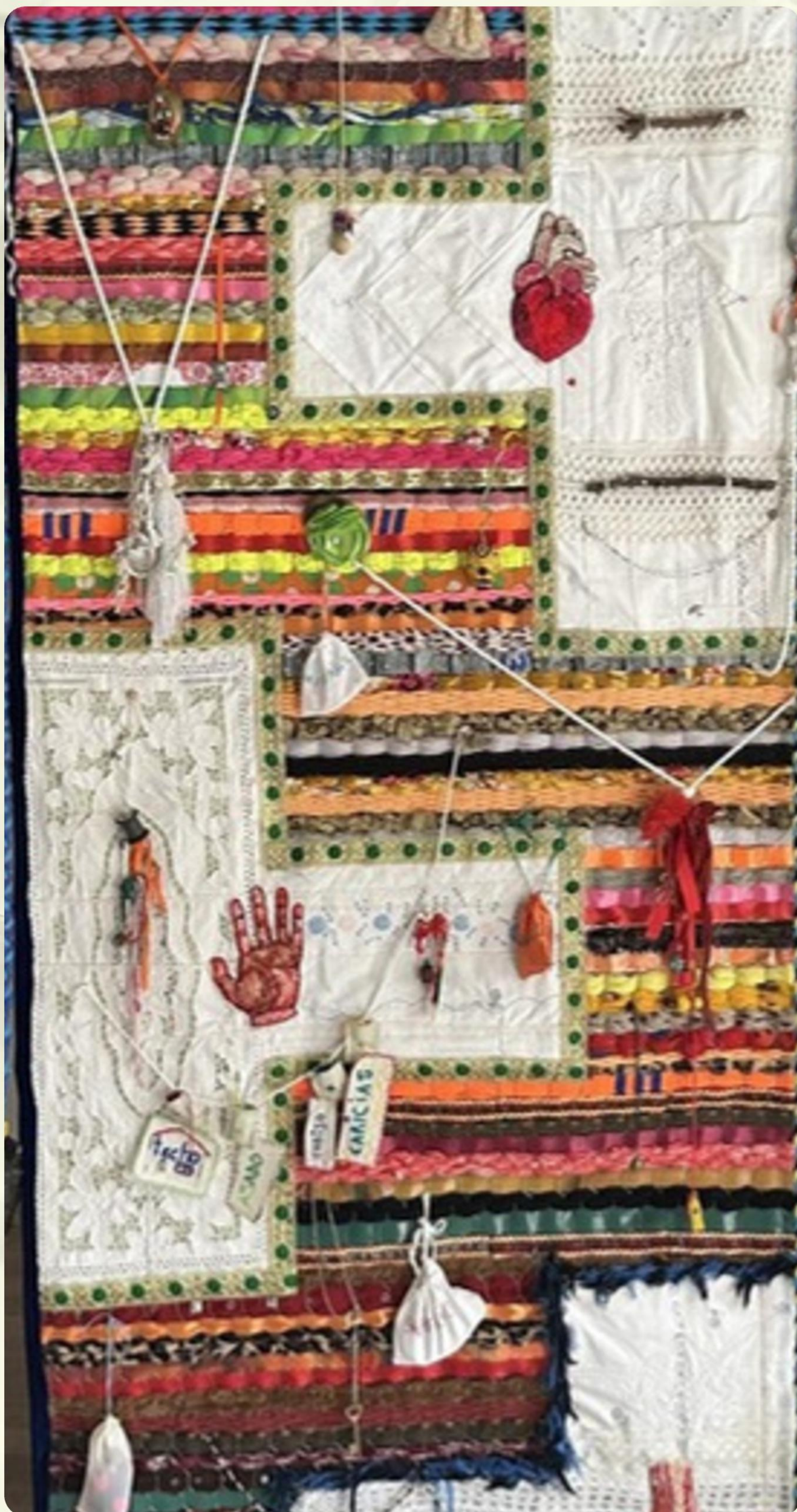
3 - CONJURO CONTRA LA CRUELDAD - UN MUNDO DONDE QUEPAN MUCHOS MUNDOS - INSTALACIÓN TEXTIL