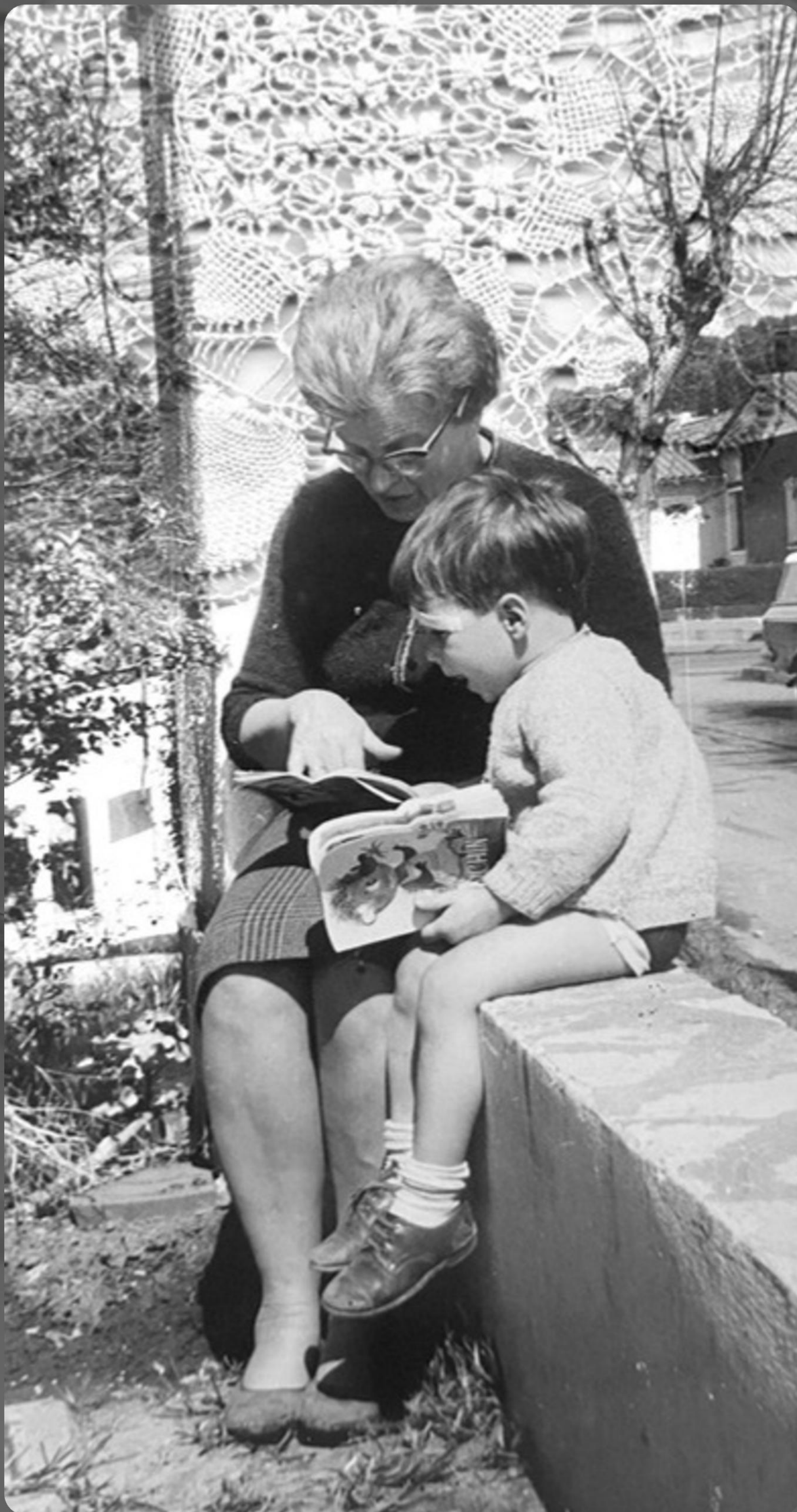
TERNURA 3 - COLLAGE DIGITAL SOBRE MICRO TUL 300 X 145 CM - 2025