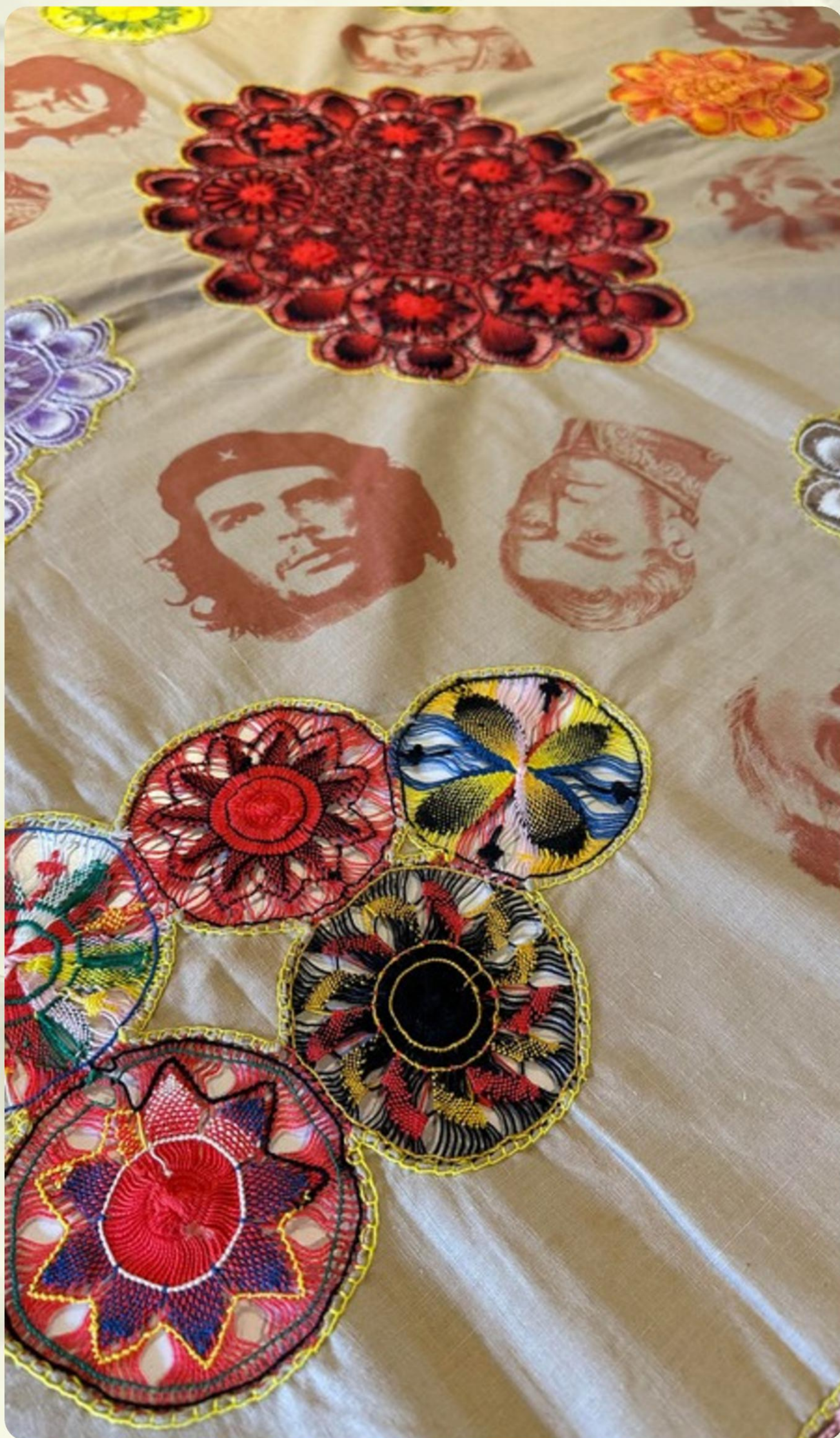
HÉROES DEL ÑANDUTI INTERVENCIÓN SERIGRÁFICA SOBRE MANTEL DE ÑANDUTÍ ANÓNIMO (DETALLE) - 140 X 200 CM - 2025