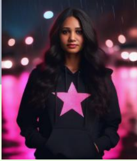
மோகைபீரியா எழுத்தாளர் ~ ஜோதிடர்