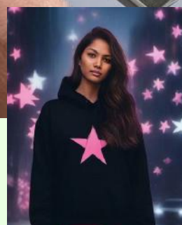
ராகசுதா எழுத்தாளர் ~ வடிவமைப்பு ஆசிரியர்