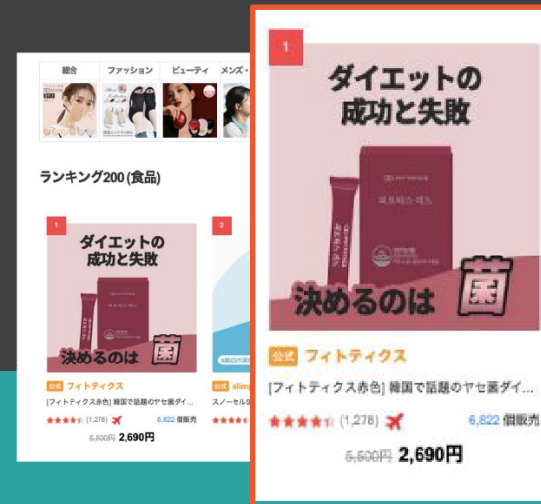
日本 Qoo10 食品新品類別 第 1 名**