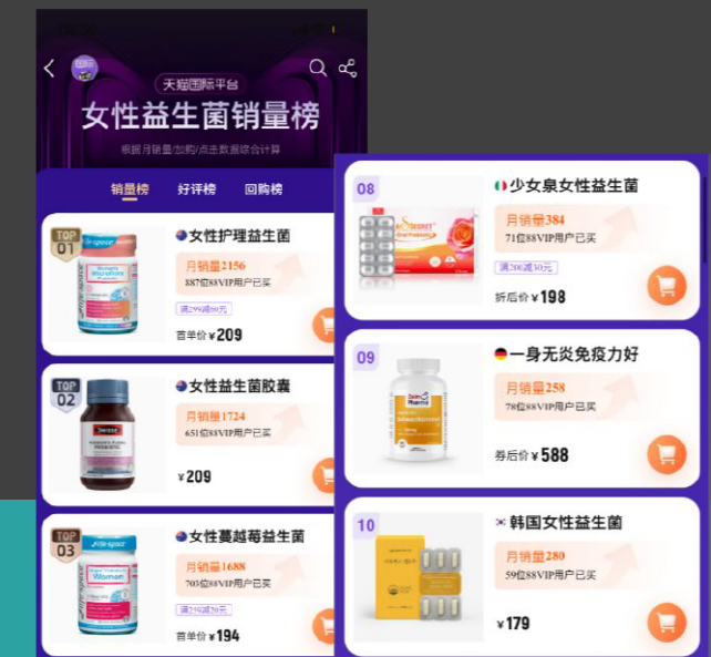
在天貓國際韓國品牌女性益生菌中 排名第1名