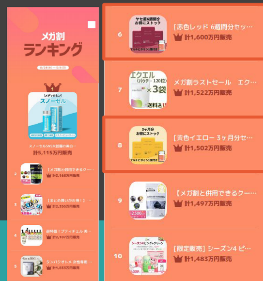
**PHYTOTICS 黄色 & 紅色 系列 多國平台綜合排名上位圈**

日本市場自 2021 年 6 月上市以來，PHYTOTICS 小黃盒和小紅盒益生菌日本食品類別中持續保持 第 1 名。 東南亞市場东南亚益生菌类别（部分经销商除外），品牌商品第一名