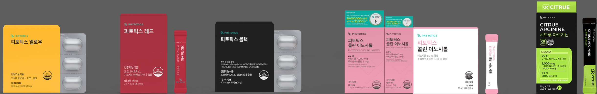
小黃盒女性益生菌