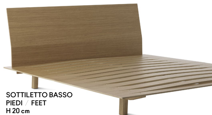
SOTTILETTO BASSO PIEDI / FEET H 20 cm (* )+++