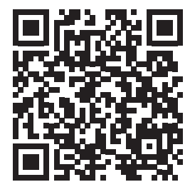
Najaarsfeesten 2020 Omens of Love