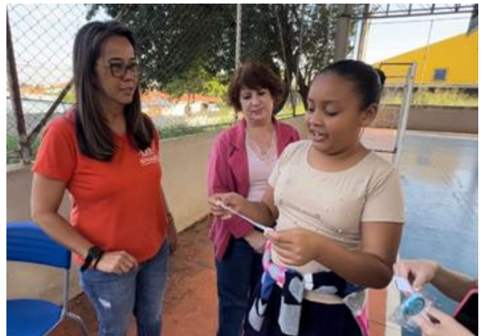
Dinâmica do trava-línguas.

Os alunos se envolveram de maneira lúdica em situações de aprendizagem relacionadas às Áreas do Conhecimento e aos Princípios do Programa de Ensino Integral, principalmente os 4 Pilares da Educação com interações pedagógicas sob a orientação dos Professores.