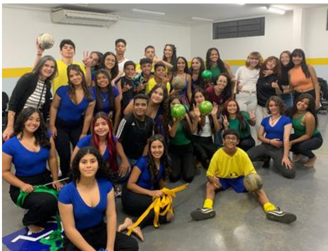
Alunos da Eletiva Ela Dança, Eu Danço.