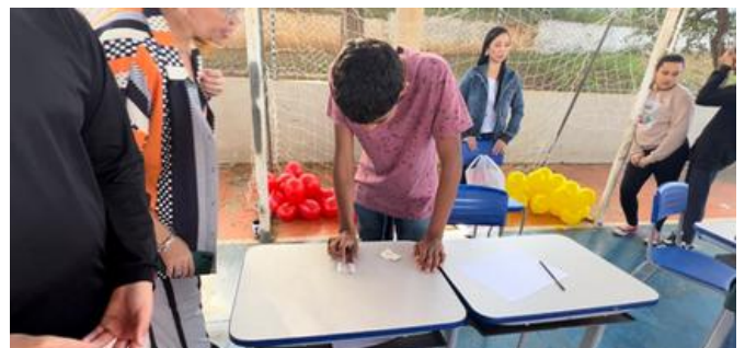
Engajados para ganhar.