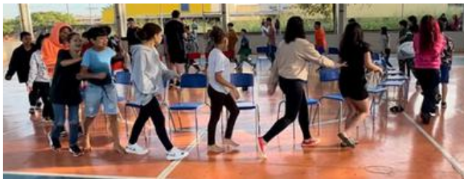
Todos agitando na "Dança da Cadeira".

No sábado 08/06, a Escola José Ferraz promoveu um dia repleto de atividades que foram cuidadosamente planejadas pelos Professores para engajar os estudantes no desenvolvimento de habilidades diversas, combinando cultura, esporte e lazer.