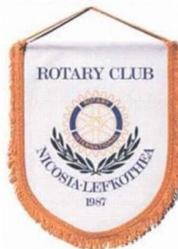
Twin Club Agreement Between Rotary Club Baia Mare 2005(D2241)

"Am reușit să aducem alături de noi un club cipriot puternic, iar aceasta poate să însemne mai multe resurse și energie în sprijinul comunității noastre. Putem să sperăm la și mai multe acțiuni și proiecte comune care să aducă plus valoare comunităților noastre. Am legat prietenii și ne-am creat amintiri de neuitat și împărtășim cu voi puțin din ceea ce au putut surprinde imaginile", transmit rotarienii din Baia Mare.