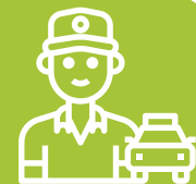
El taxista [pieza antifrágil]

Ilustraremos esto con el siguiente ejemplo: considera dos hermanos gemelos. Uno es directivo en un gran banco y el otro es taxista