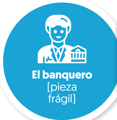
El banquero [pieza frágil]

Como hemos visto, los sistemas que promueven la antifragilidad son vitales. Y son producto de variables como el tamaño de los sistemas, variedad de opciones, y concentración del poder