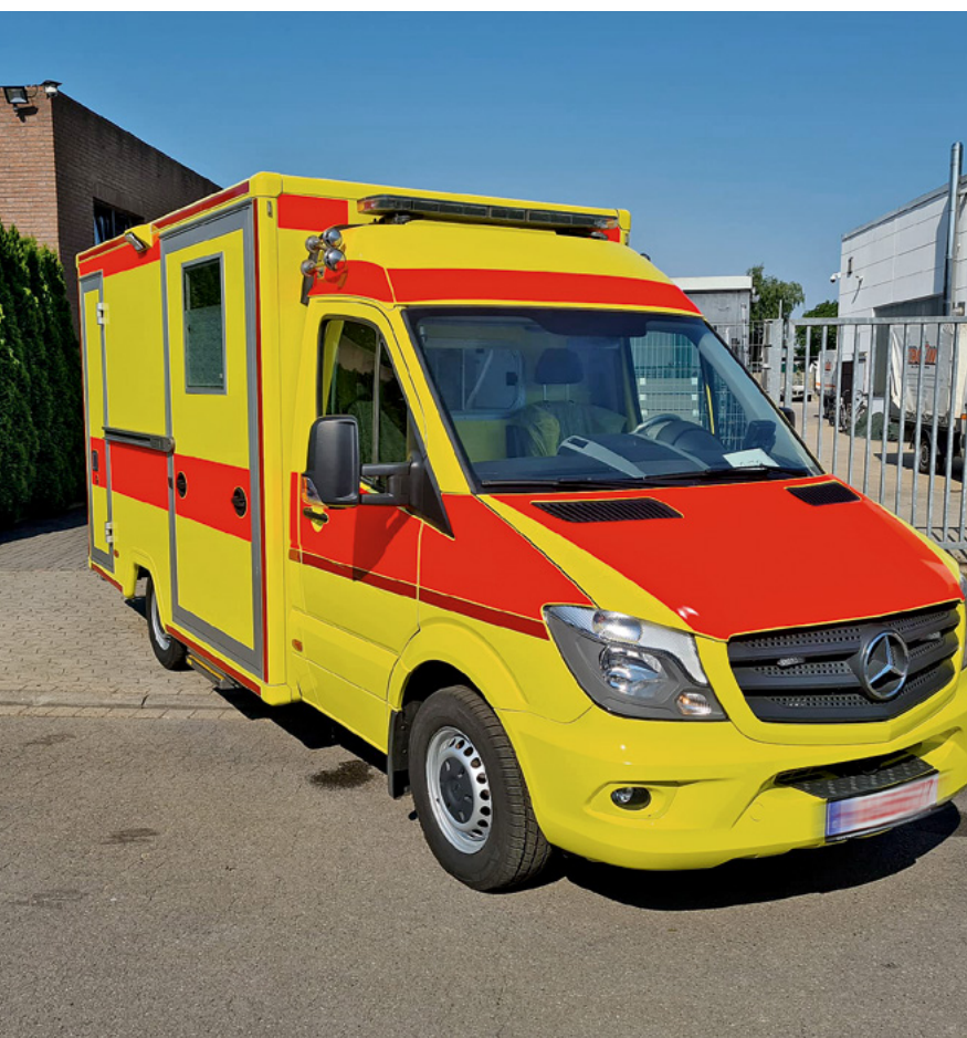
Zakup karetek pogotowia i ich transport do Ukrainy był owocem bardzo ścisłej współpracy naszych zespołów z Niemiec i Polski.

Pomoc humanitarna full service: na zlecenie amerykańskiej organizacji pomocowej nasz zespół Air + Sea zakupił i przetransportował na teren działań wojennych pilnie potrzebne karetki pogotowia ratunkowego.