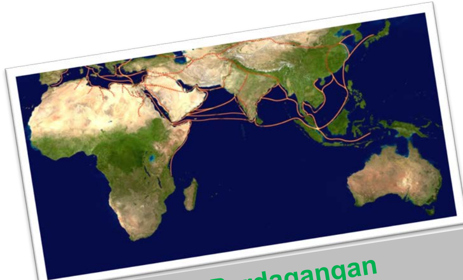
Jalur Perdagangan Periode Klasik (1 M)