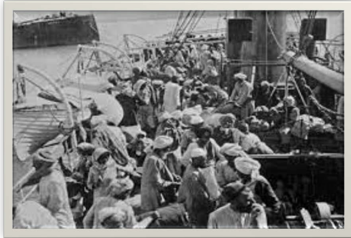
Perjalanan Haji Umat Muslim di Indonesia

Sejak dulu setiap tahun umat Islam Indonesia melakukan ibadah haji ke Mekah, Saudi Arabia, yang berjarak kurang lebih 8.000 km. Perjalanan ditempuh menggunakan perahu layar selama berbulan-bulan. Seiring ditemukannya perahu mesin, perjalanan ditempuh dalam waktu beberapa minggu. Kini, dengan pesawat udara, hanya sekitar 9 jam.