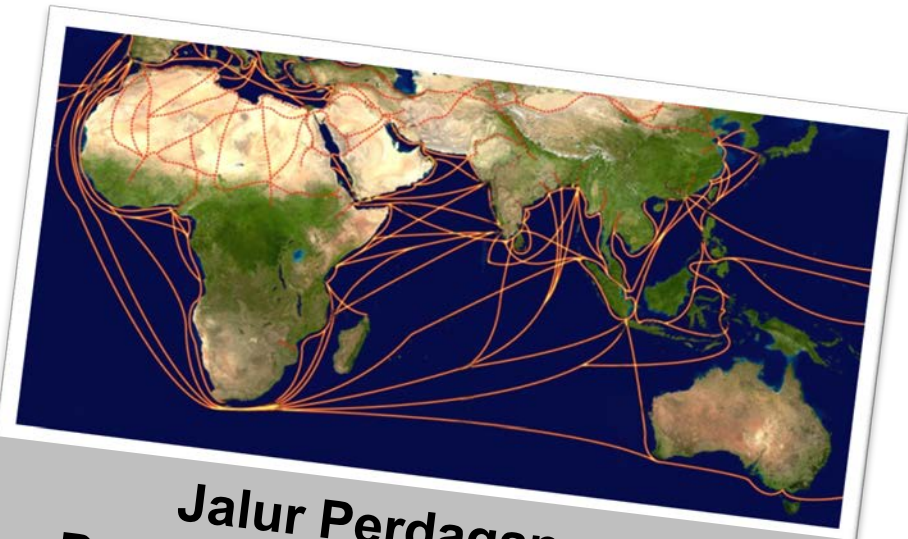
Jalur Perdagangan Periode Modern Awal (18 M)

Proses globalisasi dipicu oleh semakin meluasnya jalur perdagangan di berbagai wilayah dunia.