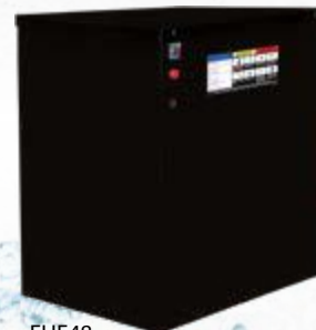
EHE48 Éléments Électriques