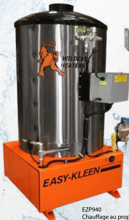
EZP940 Chauffage au propane