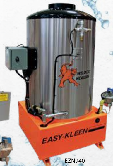
EZN940 À Essence