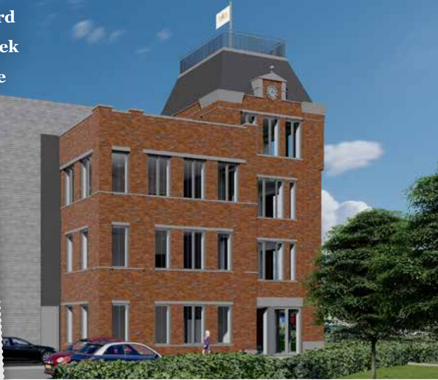
< Vervaardiger Attema, Y., Rijksdienst voor het Cultureel Erfgoed, Documentnummer 552.248

Op de nieuwe locatie zal de productie, assemblage en verpakking van een groot deel van het assortiment plaatsvinden. “Ons huidige aanbod bestaat uit zo’n