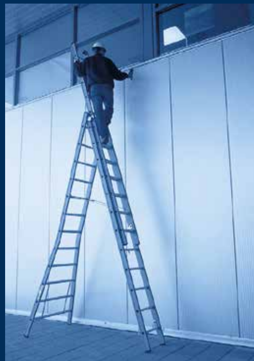
ladders & trappen