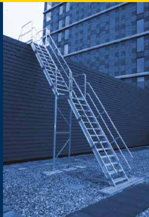
kooiladders & moduletrappen

Deurneseweg 5 • 5709 AH Helmond • T (0492) 538 124 • www.dirks.eu