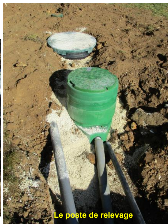
Le poste de relevage