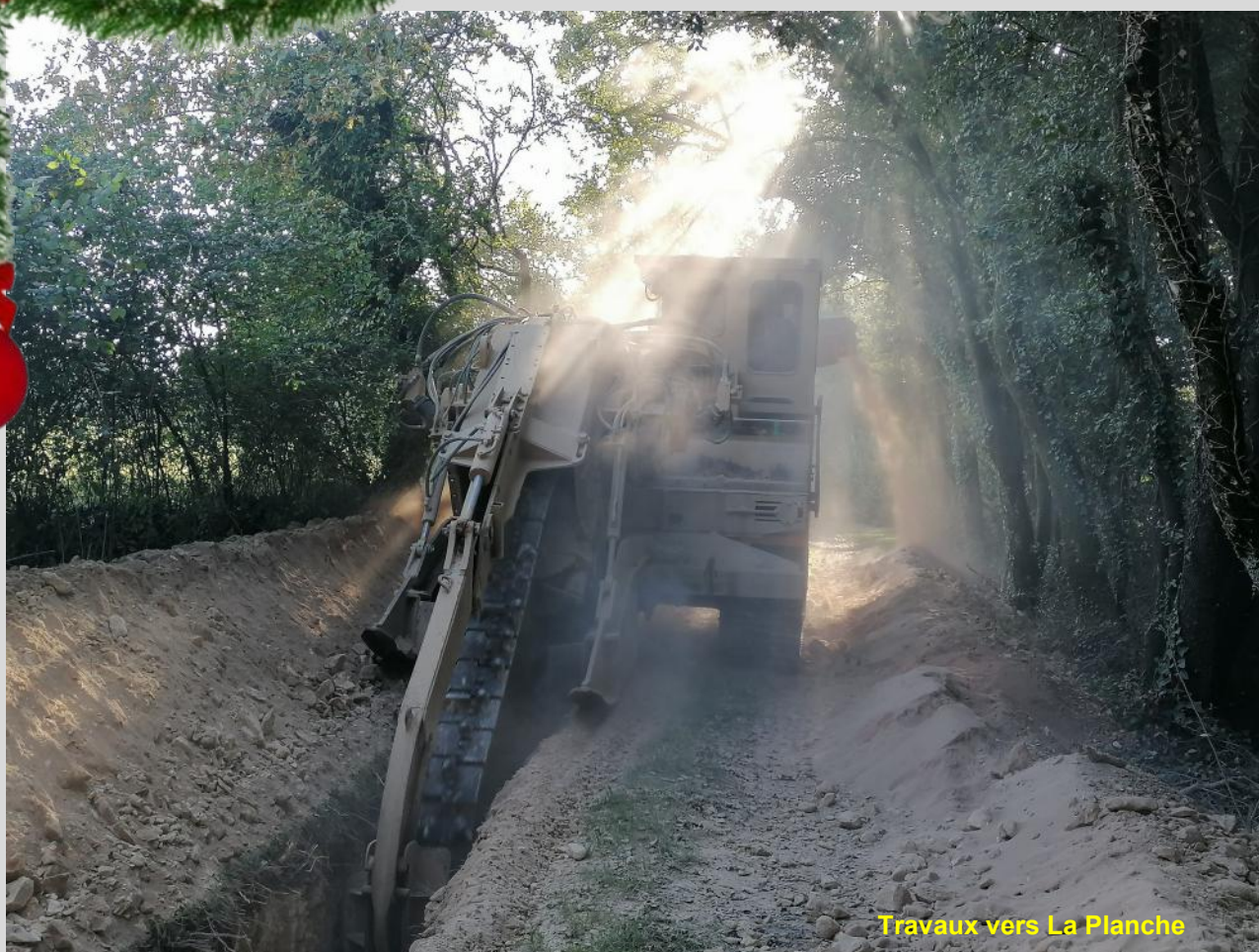
Travaux vers La Planche