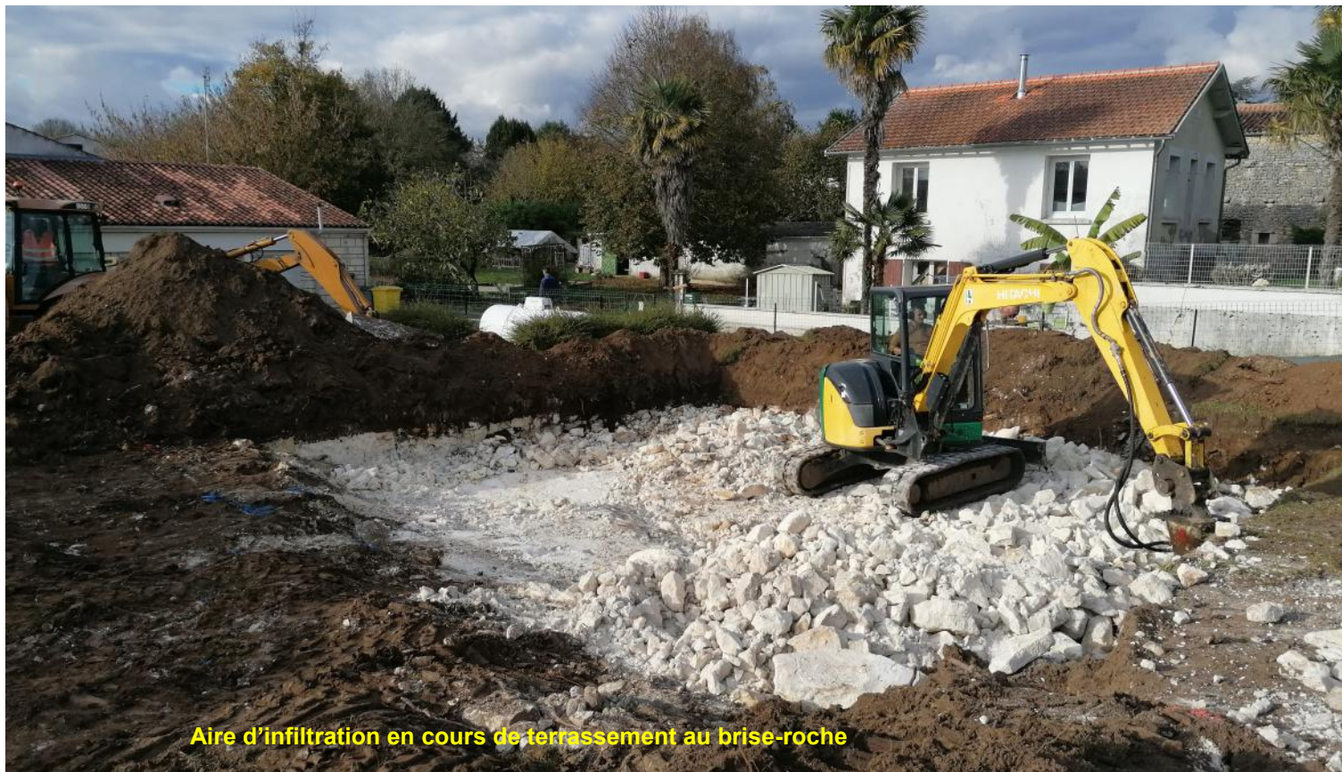
Aire d'infiltration en cours de terrassement au brise-roche

Il ne reste plus qu'à raccorder les sanitaires de l'atelier municipal et les sanitaires ouest de l'école.