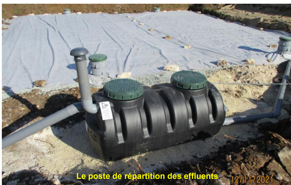
Le poste de répartition des effluents