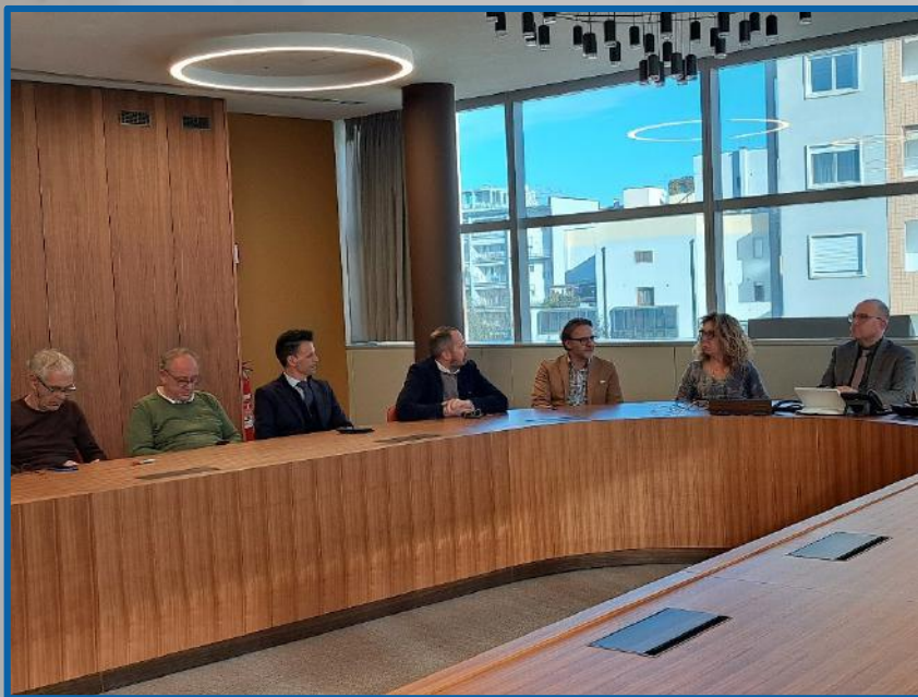
I Presidenti e Direttori di Ater Padova, Verona e Vicenza

“Questa collaborazione concreta con BCC Veneta- commentano i firmatari del protocollo di collaborazione – contribuisce a dare una risposta concreta alla domanda di casa, primo passo indispensabile per superare il disagio sociale-economico a favore di un pieno inserimento nella comunità, alla quale potranno apportare il loro contributo. Non è soltanto un valore civico, ma soprattutto di impegno sociale per dare un'opportunità a chi ne ha davvero bisogno”.