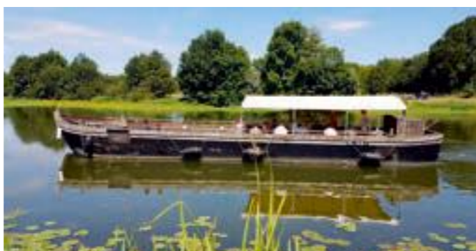
Croisière sur la Sarthe à bord de La Gogane à Cheffes