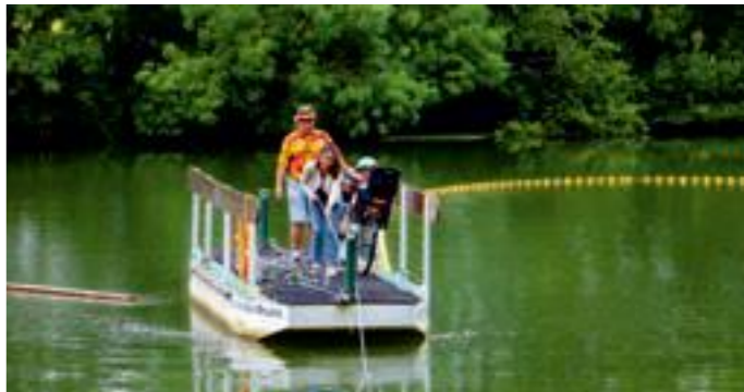
Bac de Montreuil-sur-Loir