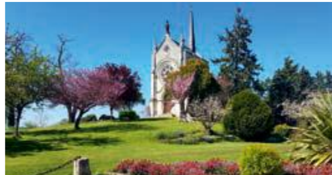
Chapelle de Matheflon à Seiches-sur-le-Loir