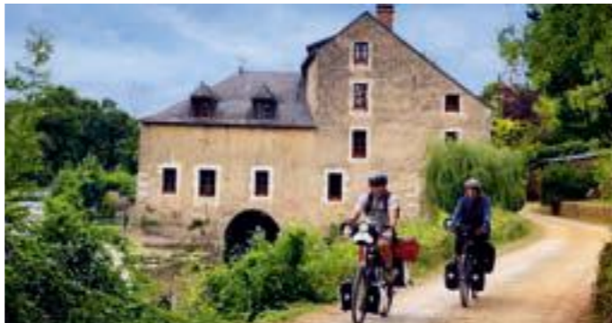
Moulin de Matheflon