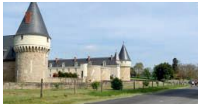
Château du Verger à Matheflon