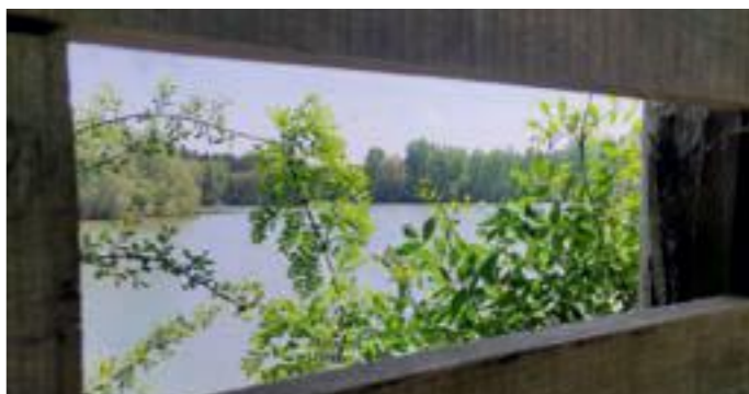
Les Etangs de Boudré à Seiches-sur-le-Loir