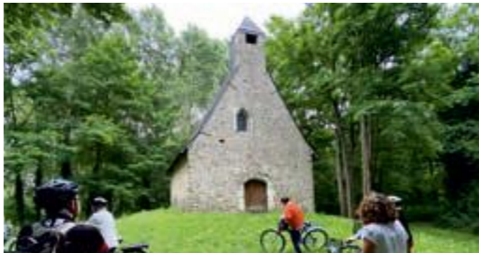
Chapelle Notre-Dame de la Garde à Matheflon