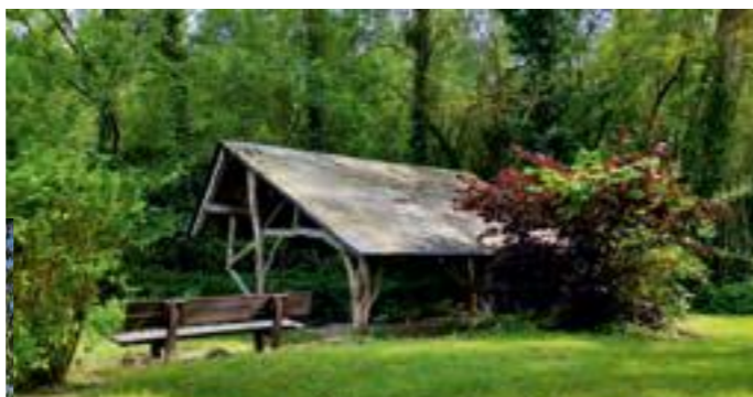
Lavoir du Ponceau à Matheflon

HORAIRES D'OUVERTURE Du 1 er mai au 30 septembre Mardi au samedi : 10h - 13h / 14h - 18h Fermé le dimanche en mai et juin Ouvert les dimanches de juillet, août et 2 dimanches en septembre : 10h - 14h