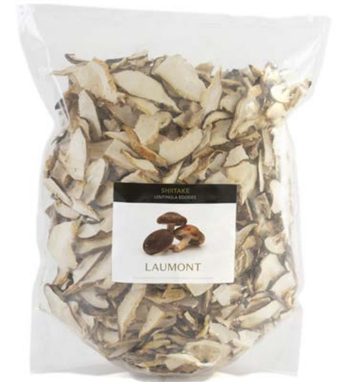
Bolsa de 500 g 500 g Bag Ref.: 24623