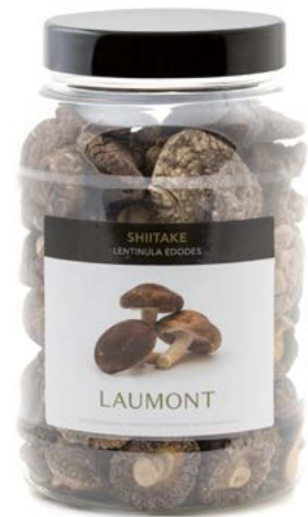
Bote PET de 200 g 200 g PET pot Ref.: 24612

Ingredients: Cultivated Lentinula edodes .