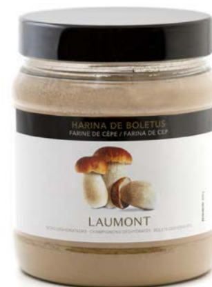
Bote PET de 400 g 400 g PET pot Ref.: 20094