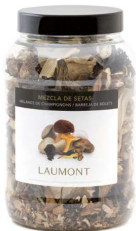
Bote PET de 200 g 200 g PET pot Ref.: 20512

Ingredients: cultivated Lentinula edodes (China), wild Boletus edulis (China), cultivated Agaricus bisporus (China), cultivated Pleurotus eryngii (China), cultivated Pleurotus ostreatus (China), wild Cantharellus cibarius (EU), wild Craterellus cornucopioides (EU), wild Cantharellus tubaeformis (EU), wild Marasmius oreades (EU). In variable proportions.