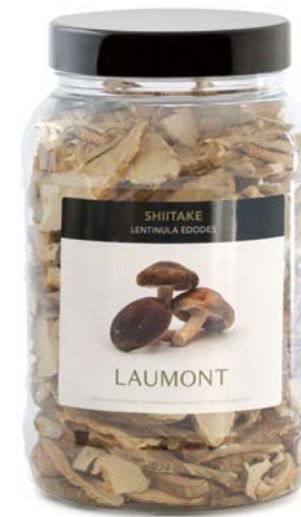
Bote PET de 150 g 150 g PET pot Ref.: 24622

Ingredients: Cultivated Lentinula edodes .