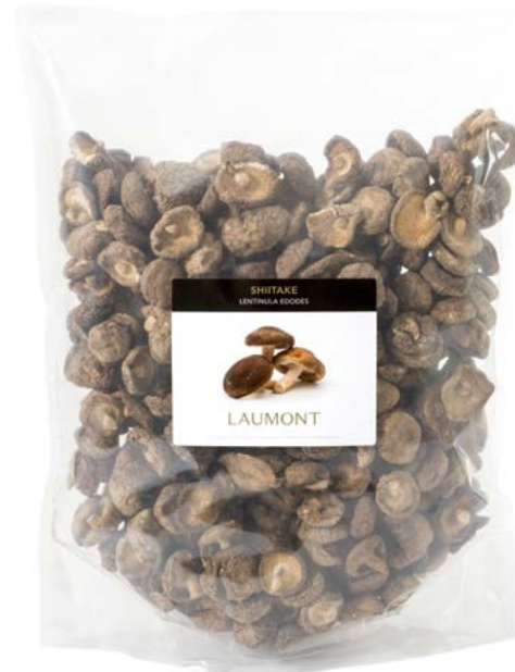
Bolsa de 500 g 500 g Bag Ref.: 24611